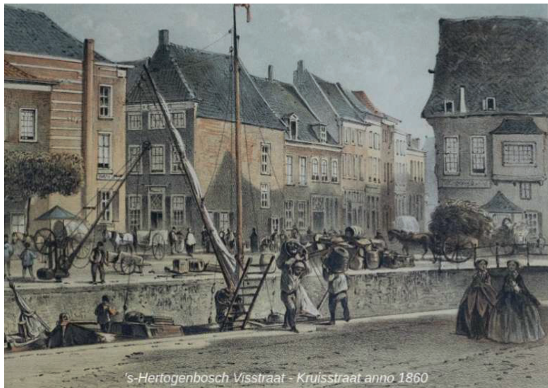
's-Hertogenbosch Visstraat - Kruisstraat anno 1860