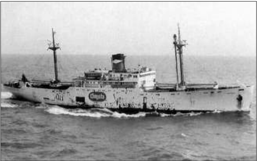
Afb. 4: S. S Coppename.

In 1907 werden tegelijkertijd vier Naamloze Vennootschappen opgericht, respectievelijk genoemd naar de vier bananenboten. In het betreffende pers-