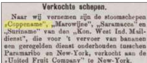
Afb. 10: 25 september 1913; de vier K.W.I.M schepen verkocht.

Het einde van het bananenvervoer per K.W.I.M naar New York kwam in 1913 toen de United Fruit Company de vier bananenboten overnam (afb. 10).