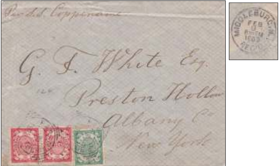
Afb. 1: Per S.S. Coppename van Paramaribo naar New York, 30 januari 1909.

De brief in afb. 1 is verstuurd op 30 januari 1909 'Per S.S Coppename' van Paramaribo naar Preston Hollow, N.Y in de U.S.A.