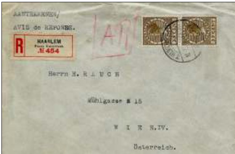
Haarlem-Frans Halsstraat, 29 november 1926. Brief naar Wenen. Tarief: brief van 41-60 gr: 35 cent. Aantekenrecht 15 cent, met bericht van ontvangst (Avis de Reception) 15 cent. Totaal 65 cent; 5 cent teveel geplakt.