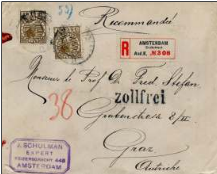
Amsterdam-Kerkstraat, februari 1926. Aangetekende brief naar Graz, Oostenrijk. Tarief: brief tot 20 gr, 15 cent; elke 20 gr of gedeelte meer 10 cent. De brief heeft tussen 81 en 100 gr gewogen: 55 cent. Aantekenrecht 15 cent. De brief was vrijgesteld van invoerrechten, zie het stempel ZOLLFREI.