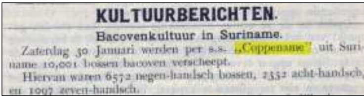
Afb. 8: Bericht van het aantal bananen vervoerd per Coppname , 30 januari, 1909.

Op 30 januari 1909 werden met de Coppname 10,001 bossen verscheept (afb. 8).