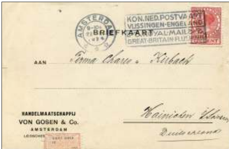
Amsterdam, 22 december 1924. Briefkaart naar Hainichen, Dtsl. Tarief: briefkaart buitenland 12½ cent. De kaart is gebruikt als kwitantie, achterzijde, compleet met zegel van 10 cent. Postzegel (1924) zonder watermerk.