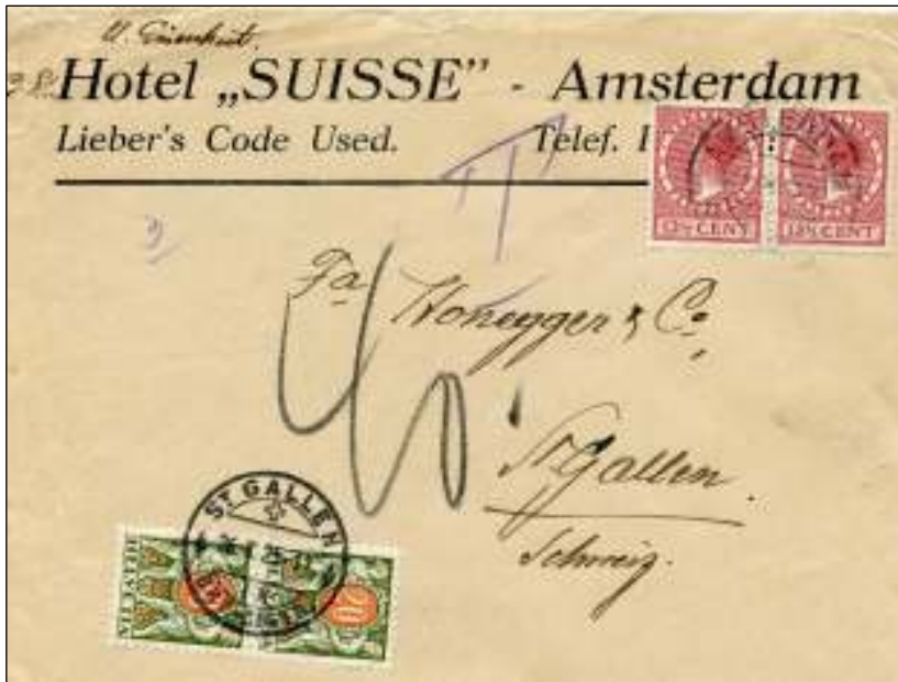
Amsterdam, 24 oktober 1925. Brief naar St. Gallen, Zwitserland. Gefrankeerd als brief 21-40 gram, 25 cent. De brief bleek tussen 41-60 gram te wegen, 35 cent. Het dubbele van het tekort van 10 cent werd in Zwitserland vertaald naar 40 rappen wegens de koersverhouding Gulden-Zwitserse franc.