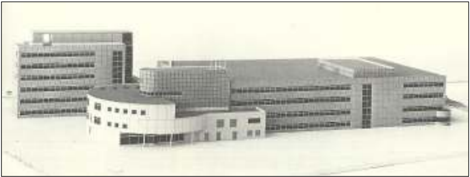
Maquette van het EKP Den Bosch.

Aan dat laatste aspect werd ook nog een aparte publicatie gewijd met als auteur dr. Paul Hefting van de PTT Dienst voor Esthetische Vormgeving (DEV). Daarin is onder meer te lezen: 'Een goede samenwerking tussen ontwerper/kunstenaar, architect en opdrachtgever kan alleen dan ontstaan wanneer zij als driehoek echt iets willen en volledig van elkaars ideeën, ontwikkelingen, wensen en idealen op de hoogte zijn. En dat geldt zowel voor de kunst opdrachten als voor de belettering en de inrichting van een gebouw.' Het is inderdaad een zeer geslaagd gebouw geworden. De DEV speelde daarbij een grote rol, tot en met bijvoorbeeld het ontwerp van de rolcontainers, sorteerkasten en de groenvoorziening rondom.