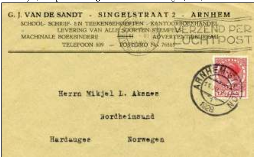
Arnhem-Station, 11 november 1928. Brief naar Hardauges, Noorwegen. Tarief: brief buitenland 12½ cent. Deze kleur (1927) met watermerk heeft slechts een jaar gediend en is in 1928 al vervangen door de kleur blauw.