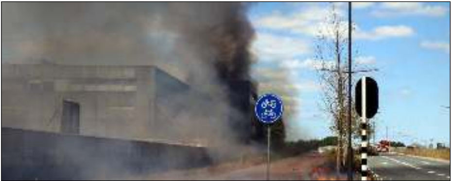
Het EKP op zondag 8 juli 2018.

Op zondag 8 juli j. l. heeft een uitslaande brand een groot deel verwoest van het voormalig PTT-Expediteeknooppunt (EKP) aan de Parallelweg in Den Bosch. Tot kilometers in de omtrek was een dikke rookwolk te zien. Het spoorwegverkeer langs het naastgelegen NS-station werd stilgelegd, evenals het wegverkeer in de buurt. PostNL knapt het uitgebrande deel van het gebouw niet meer op. Binnenkort zou het complex toch plat gaan voor ontwikkelingen in de spoorzone, waarvoor de aanbesteding start na de zomer. In het zuidelijke deel kan Avans voorlopig nog wel blijven met zijn kunstacademie.