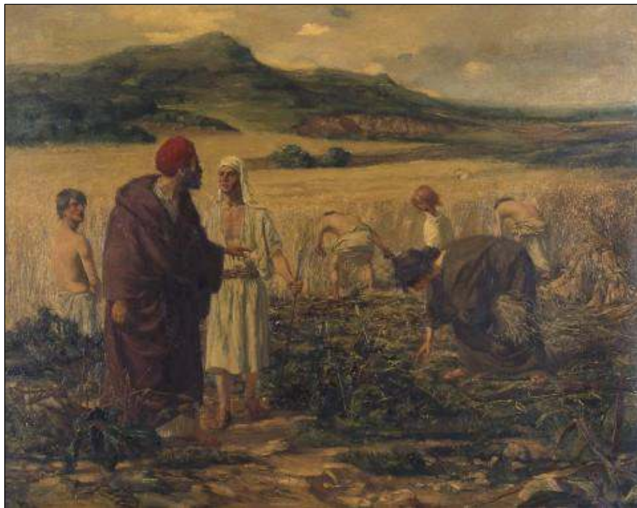
'Boas en Ruth' door Herman Gouwe.

Zuid-Limburg, in het bijzonder in Maastricht, Gulpen en net over de grens in Eben-Emael. Daar bleef het niet bij: van 1901-1912 was hij werkzaam in Blaricum (Laren); daarna maakte hij van 1912 tot 1915 een reis naar Frankrijk, Italië, Spanje en Marokko.