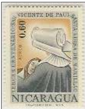
Afb. 4: Een Dochter van Liefde met vliegkap. Kunstenaars in het vrouwen!

hiervoor. Wat de Liefdezusters van de Heilige Vincentius a Paulo per brief aan de ‘President’ van de stichting gevraagd hebben zullen wij nooit weten. In ieder geval een bedankje gestuurd neem ik aan?