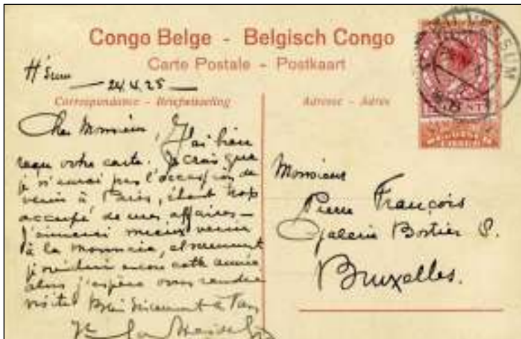
Hilversum, 25 april 1925. Briefkaart naar Brussel. De briefkaart van Belgisch Congo is gebruikt als adresdrager. Postzegel zonder watermerk (1924). Het voorkeurstarief naar België was toen gelijk aan het buitenland tarief van 12½ ct.