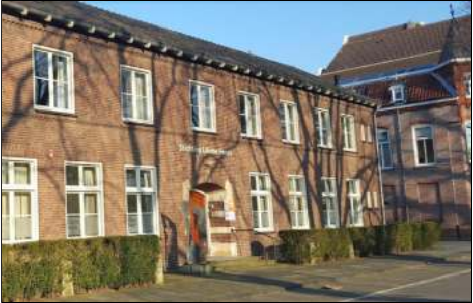
Afb. 2: Huidige kantoor Stichting Liliane Fonds, Havensingel 26 te 's-Hertogenbosch.

heeft op de Leonardus lagere school en Leonardus MULO gezeten, les gehad van de zusters.