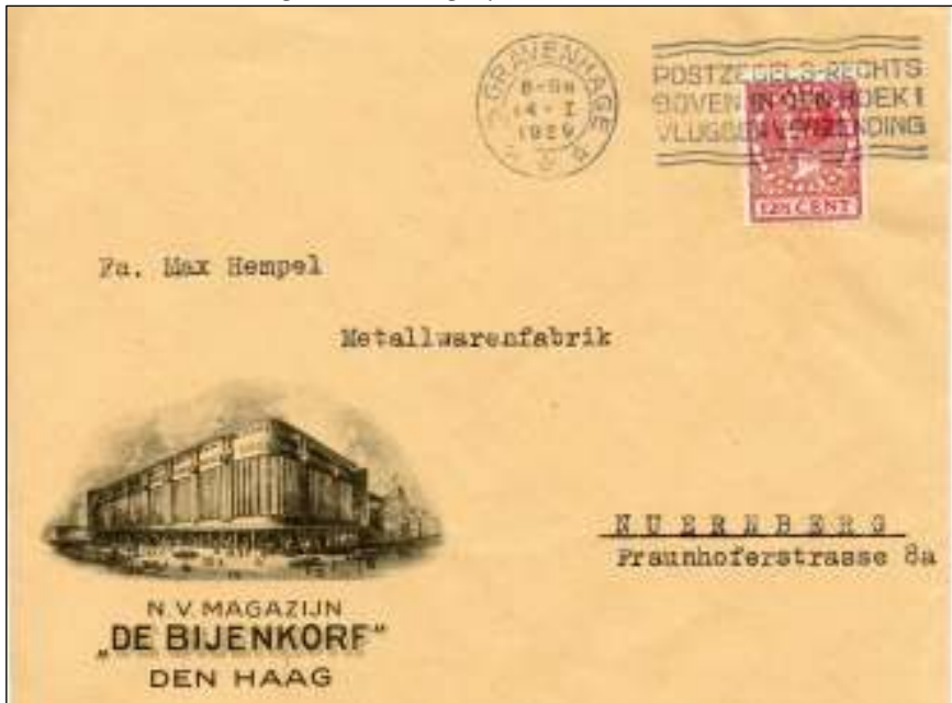
's-Gravenhage, 14 januari 1929. Brief naar Nürnberg, Dtsl. Tarief: brief buitenland 12½ cent. Postzegel met watermerk (1927) en firmaperforatie S P G. Deze staat voor S.P. Goudsmit, eigenaar van de Bijenkorf.