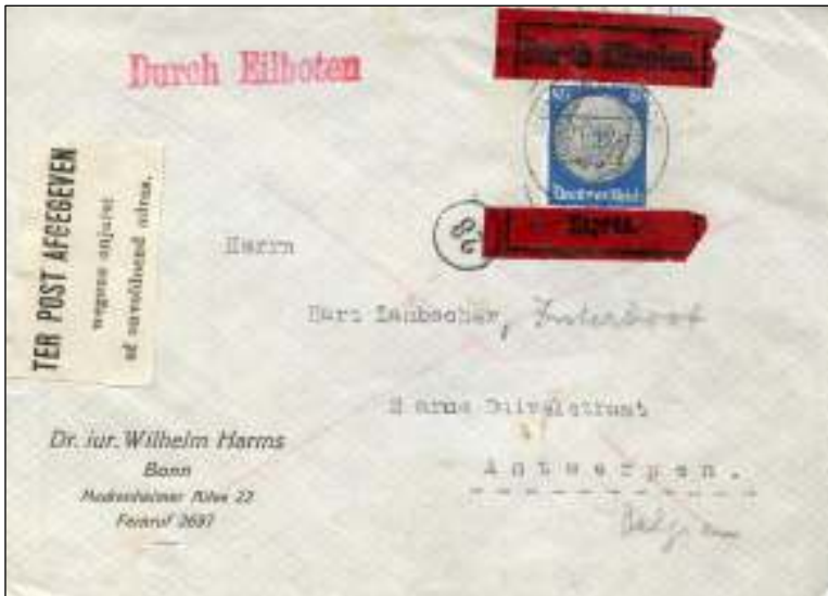
Bonn, 30 januari 1937. Brief per expres met bestemming Antwerpen. Tarief: brief tot 20 gram 25 pfennig, expresrecht 50 pfennig; 5 pfennig teveel. De brief is overgedragen aan de post wegens onjuist/onvoldoende adres. Op de achterzijde is vermeld dat de geadresseerde naar een ander adres is verhuisd.