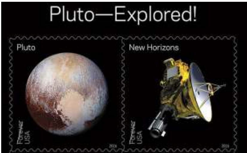
Afb. 5: 2016: 'Pluto-Explored!'

De actie was niettemin succesvol. Op 31 mei 2016 vond de presentatie plaats van twee sets postzegels, en wel als onderdeel van de recente World Stamp Show in New York. De ene set bevatte acht postzegels met 'Views of Our Planets'. Een aparte set van twee postzegels toonde de sonde New Horizons en een foto van Pluto, gemaakt toen de sonde op 14 juli 2015 de 'dwerfplaneet' op korte afstand passeerde (afb. 5).