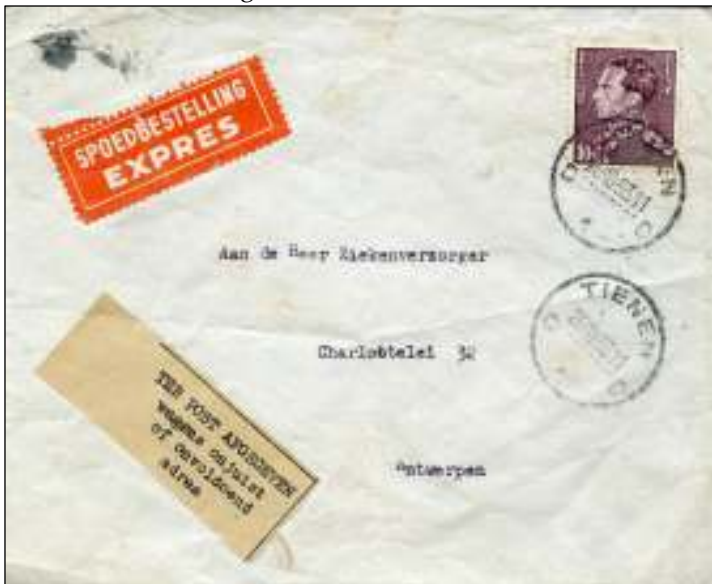
Tienen, 26 oktober 1953. Brief per expres met bestemming Antwerpen. Tarief: brief tot 50 gram 2 franc, expresrecht 8 franc, totaal 10 franc. 'Ter post afgegeven wegens onjuist of onvoldoend adres.'