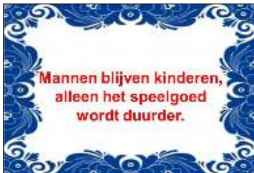
Afb. 1: Tegeltwijsheid.

Mannen blijven kinderen (afb. 1). Amerikaanse mannen nog iets meer dan anderen. Mannen die bij de NASA werken, de Amerikaanse ruimtevaartorganisatie, het meest. Die blijven in sprookjes geloven en maken hun dromen tot werkelijkheid. Ik zal dit illustreren aan de hand van de avonturen van een postzegel gedurende een kwarteeuw, van 1991 tot 2016.