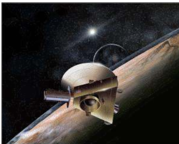
Afb. 6: Artist's Impression: New Horizons scheert langs Pluto.

De tekst 'Pluto-Explored!' op het velletje was een subtiele verwijzing naar de tekst op de postzegel uit 1991. USPS maakte trouwens van de Pluto-passage door New Horizons gretig gebruik om Pluto met een apart velletje uit te lichten. Daarmee hoefde USPS immers geen partij te kiezen in het gekrakeel of Pluto nou wel of niet als een planeet moet worden beschouwd.