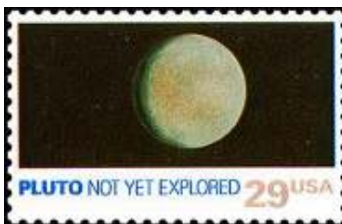
Afb. 2: 1991: PLUTO NOT YET EXPLORED.

In 1991 gaf de Amerikaanse overheid opdracht voor een serie van 10 postzegels van 29 cts, een voor elke planeet, plus de maan. Ze moesten als het ware een eerbewijs vormen voor wat het Amerikaanse ruimtevaartprogramma had gepresteerd. Elke postzegel liet bovendien een afbeelding zien van de ruimtesonde die het betreffende hemellichaam had verkend. Dat ging niet op voor Pluto, die toen nog gold als de negende planeet. Want, zo luidde de tekst op de postzegel: 'Pluto not yet explored.' (afb. 2)