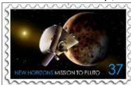
Afb. 3: Ontwerp uit 2008 'New Horizons Mission to Pluto'.