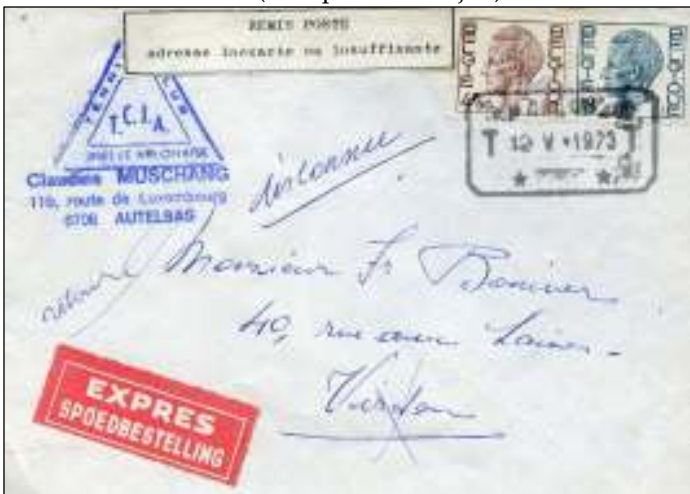
Autelbas, 12 mei 1973. Brief per expres met bestemming Virton. Tarief: brief tot 50 gram 4,50 franc, expresrecht 18 franc. De brief is overgedragen aan de post omdat het adres niet te vinden was ('inconnu'). Dit lukte ook de postierijen niet, zodat de brief is teruggestuurd (geschreven 'retour').