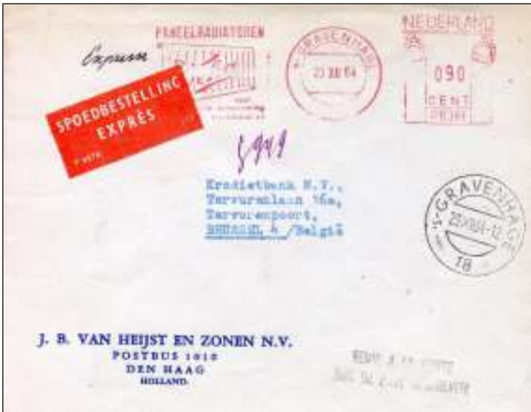
's-Gravenhage, 23 december 1964. Brief per expres met bestemming Brussel. Tarief: brief tot 20 gram 15 cent (voorkeurstarief naar België), expresrecht 75 cent. Stempel 'remis à la poste/aan de post afgegeven'. Kennelijk was dit sneller. Aankomst in Brussel 21.30 uur (stempel achterzijde).