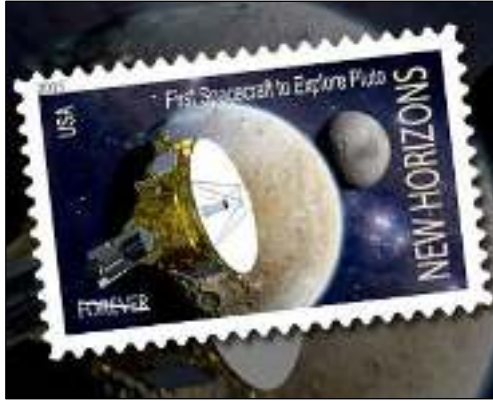
Afb. 4: Ontwerp uit 2012: 'New Horizons. First Spacecraft to Explore Pluto'.

wetend dat het USPS-beleid is ontwerpen niet te accepteren waar officieel geen opdracht voor is gegeven.