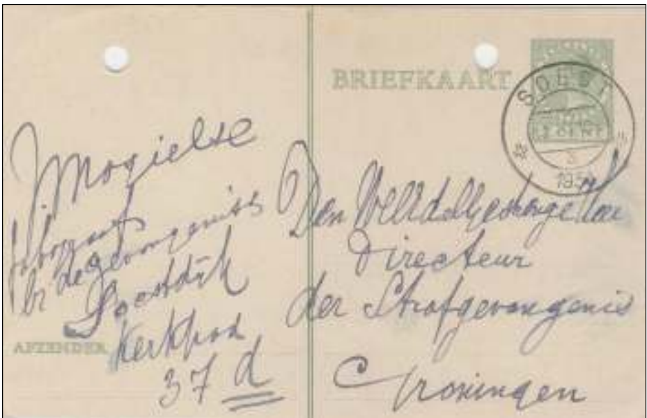
Afb. 2: Briefkaart G237, april 1934. Met zegel 'Wilhelmina type Veth'. Twee afzenderlijnen, roomwit karton (140x90mm).

Fotograaf J. Magielse is in Soestdijk of omgeving niet te traceren. Mogelijk liggen zijn wortels in Goes. Hier heeft in de eerste helft van de vorige eeuw in ieder geval een naamgenoot met dezelfde voorletter een fotozaak gehad.