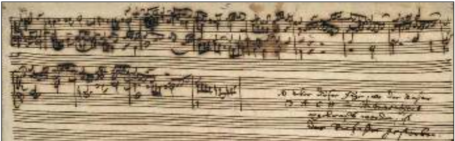
Handschrift van J. S. Bach met het slot van Die Kunst der Fuge.

De eerste die hiervan gebruik maakte was Bach zelf. Aan het eind van zijn leven schreef hij een meesterwerk getiteld Die Kunst der Fuge. Een Fuga is een tamelijk ingewikkelde muziekvorm. Ik zal die hier niet gaan uitleggen. Waar het om gaat is dat Bach zijn laatste fuga onvoltooid liet. Aan het slot introduceerde hij een nieuw thema: de noten B-A-C-H. Hij zette hiermee als het ware zijn handtekening onder zijn laatste compositie.