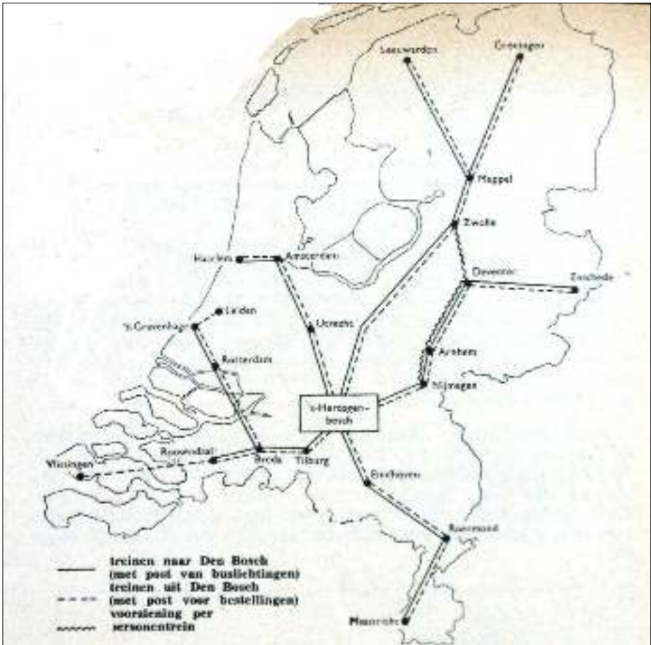
Afb. 1: Het maandagochtendnet 1969.

In 1969 ging op veel kleinere schaal een sternet van start (afb. 1) dat tot op zekere hoogte een voorafspiegeling was van de hierboven beschreven situatie omstreeks 1977. In de nacht van zondag op maandag 29 september 1969, terwijl de rest van Nederland op een oor lag, gingen PTT-ers op pad om overal de brievenbussen te leggen en te verzamelen wat zaterdag en zondag op de post was gedaan. Want, ook al was er op maandag slechts één bestelling, de PTT wilde de post van het weekeinde per se de eerste werkdag bezorgen. In een aantal sorteercentra werd dezelfde nacht de postverzending voorbereid voor treinen die rond 05.00 uur vertrokken uit zeven steden (afb. 2). Die reden alle naar 's-Hertogenbosch. Dat werd immers het knooppunt van het vroege maandagnet en plaats van centrale overlading. Utrecht, knooppunt van het