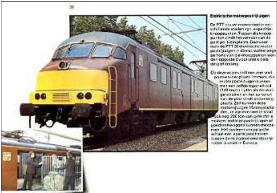
Afb. 4: Uit 'Onze treinen en lokomotieven', 1977.

Toen omstreeks 1977 twaalf expeditieknoppunten de plaats innamen van de eerdere 45 expeditiekantoren en een landelijk sternet structureel verantwoordelijk werd voor sortering, vervoer en afhandeling van de post, werd het Bossche maandagochtendnet overbodig (afb. 3 en 4). Sinds de jaren '60 was het 'werkend vervoer', dat wil zeggen het tijdens de rit sorteren en stempelen van losse poststukken, geleidelijk al afgebouwd. Na ingebruikname van de EKP's kwam het nagenoeg niet meer voor. Daardoor konden de trein-stempels, die ruim 122 jaar hadden dienst gedaan (sinds 1910 in de vorm van blokstempels) naar het museum of bij het schroot.