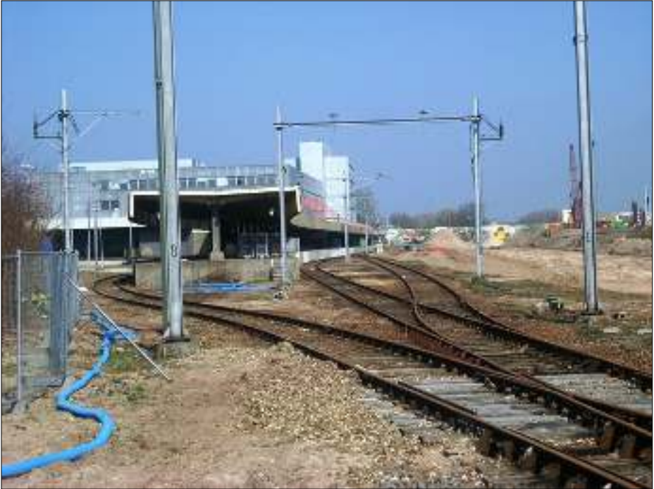
Afb. 5: Het onttakelde Expeditieknoppunt 's-Hertogenbosch.

Over het heden van PostNL doen we er maar kies het zwijgen toe.