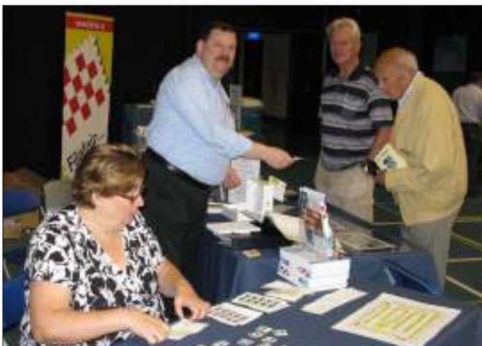
FF.Kijken, kopen, verkopen en scheuren.