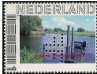
Twee Bossche 'waterrijke' postzegels; links met perfin HP, rechts met perfin