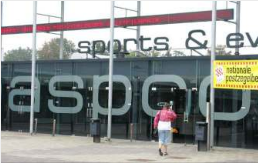
Entree van de Maaspoorthal met op de lichtkrant een aankondiging van Filafair.

speciale Filafair-postzegel (al dan niet in reliëfdruk) en 'ut Engelke' van de Sint-Jan in twee kleurvarianties. Veel succes had ook de berg met dubbeltjeszegels, waarin jong en oud gretig hebben gegrasdruind onder aanvuring van drie generaties van de familie Teurlings.