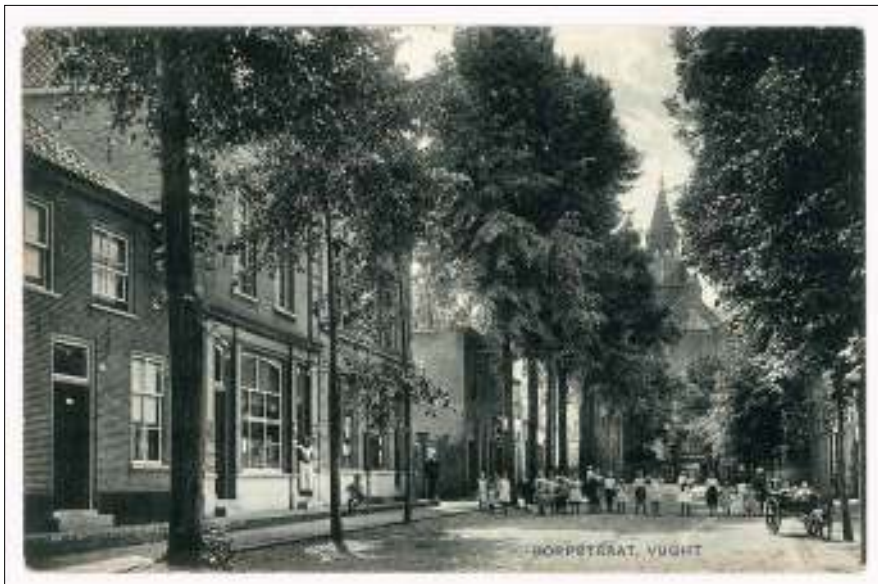
Afb. 5: De situatie omstreeks 1920 in de Dorpstraat. Het derde pand van links is dan het gemeentehuis. Van 1882 tot 1897 was er het postkantoor gevestigd. Voor de deur staat de gemeentebode.