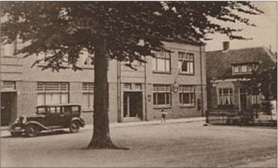
Afb. 8: H. Hartplein/Kerkplein/Heuvel met rechts het postkantoor van 1927 tot 1941.