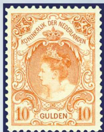
80 - postfrisje 10 gulden oranje 1905, Koningin Wilhelmina, cert. Dr. Louis BPP 1998, verkocht voor € 1.293