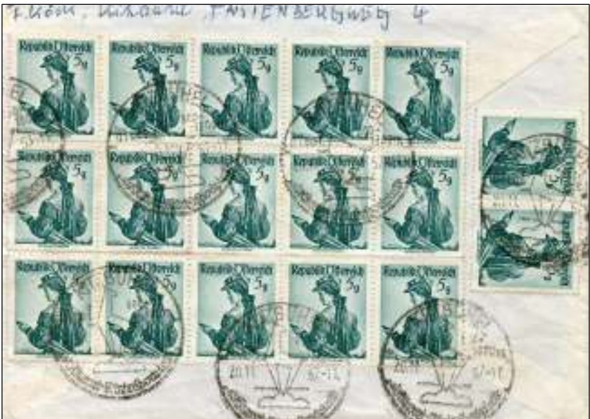
Achterzijde met de overige 17 stuks van 5 Groschen.