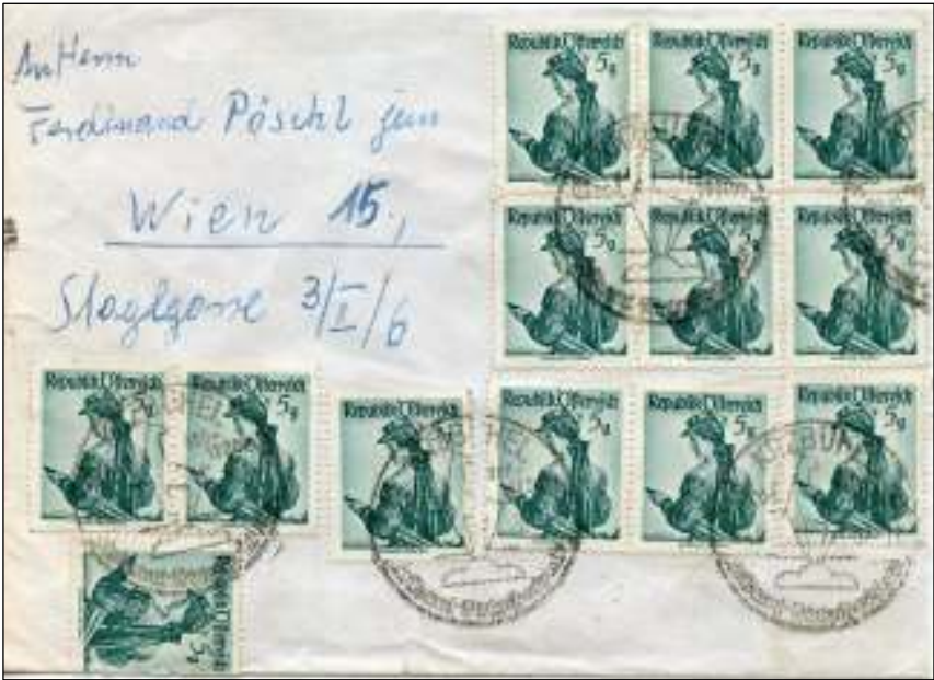
Kitzbühel, 20 november 1957. Brief met bestemming Wenen. Tarief vanaf 1 juli 1957 tot 1 januari 1964: 1,50 Schilling voor een gewicht van 21-250 gram. Voldaan door 30 postzegels van 5 Groschen. Op de voorzijde 13 stuks.