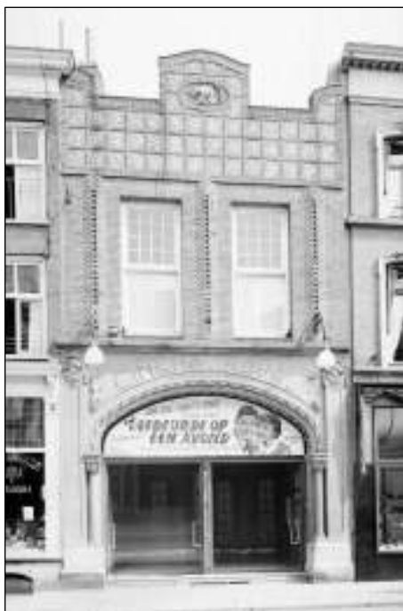
Afb. 2: Cinema Royal, Hinthamerstraat.