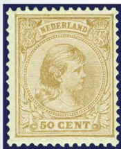
43b - postfrisje 50 cent geelbruin Prinses Wilhelmina 1891, met cert. Moeijes 1982, verkocht voor € 1.140