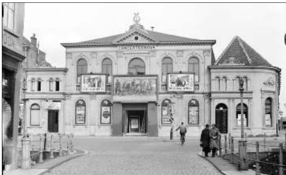
Afb. 3: Concertgebouw met filmaanplakbiljetten, Jan Heinsstraat. (afb. 2, 3, 4 coll. Stadsarchief 's-Hertogenbosch.)