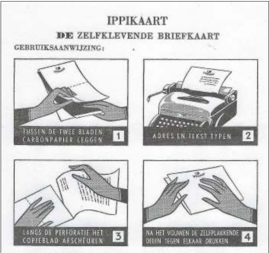
Afb. 9: Uit een reclamefolder van IPPI.

Problematisch was ook dat het tot 1959 zou duren voordat Van Mackelenbergh een geheel bevredigende methode ontdekte waarmee kleefstof op zijn opvouw-