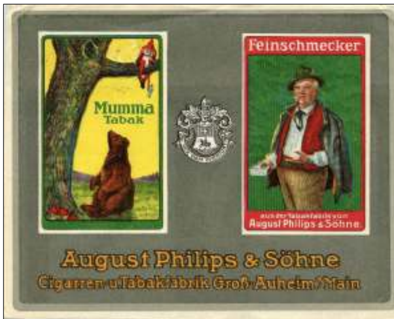
Hanau, 24 maart 1920. Brief met zeer rijke firmareclame voor tabaksproducten verstuurd naar Woyens in Sleeswijk-Holstein. Briefftarief 20 Pf. D. v. d. L.