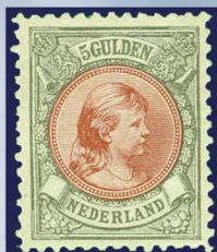
48 - postfrisje 5 gulden bronsgroen en roodbruin Prinses Wilhelmina 1896, lijntanding 11, cert. Vleeming 2010, verkocht voor € 1.201