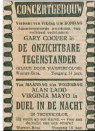
Afb. 5: Advertentie d.d. 29.10.1953.

In de Provinciale Noord-Brabantse Courant Het Huisgezin staat de film aangekondigd voor drie voorstellingen, op maandag 2 t/m woensdag 4 november 1953 (afb. 5). Gezien de bijna briesende toon van de kaart die de operateur meteen op de eerste avond schreef aan Warner Bros. verbaast het niet dat verdere voorstellingen niet meer werden geprogrammeerd. 'Duel in de Nacht' is de