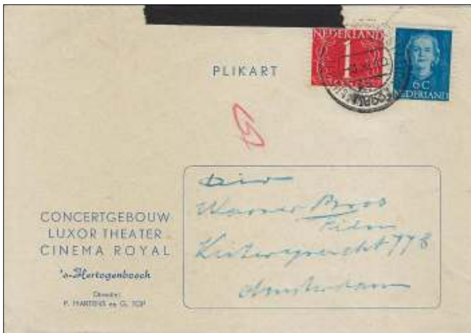
Afb. 1: 's-Hertogenbosch 3.11.1953 naar Amsterdam. Briefkaarttarief: 7 cent.

Afgezien van de afstempeling in het Stationspostkantoor van 's-Hertogenbosch op 3 november 1953 is het meest opvallende Bossche element op deze briefkaart (afb. 1) de firmanaam van de drie bioscopen die de stad telde in die periode. Te lezen is ook dat het hier gaat om een 'PLIKART'. Daarover is ook wel een en ander te vertellen. Maar eerst over de bioscopen.