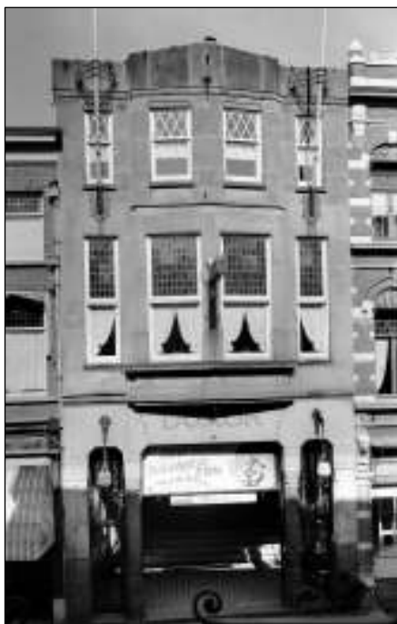
Afb. 3: Luxor Theater, Hooge Steenweg.