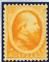
6A - postfrisje 15 cent oranje 1864 Koning Willem III, attest Vleeming 2013, verkocht voor € 3.199