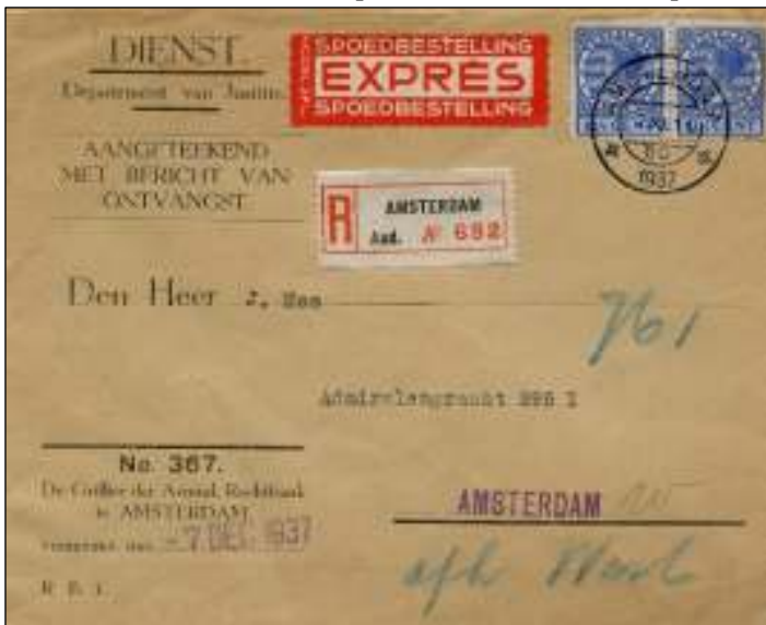
Amsterdam, 7 december 1937. Brief met lokale bestemming. Tarief: brief portvrijdom, aantekenrecht portvrijdom, met bericht van ontvangst 15 cent, expresrecht 10 cent, samen 25 cent.