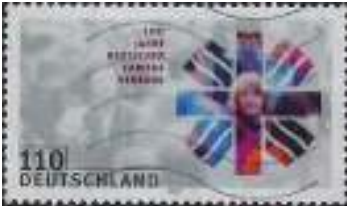
Afb. 4: 100 jaar Caritas Duitsland.

In Europa zijn grote verschillen tussen de Caritas organisaties. Bij de grootste organisatie Deutsche Caritas Verband (DCV) werken >650.000 mensen en ongeveer 350.000 vrijwilligers, en de organisatie werkt op lokaal, regionaal en landelijk (Freiburg) niveau. In sommige landen bestaat slechts een nationaal bureau met een beperkte staf en zijn het de lokale vrijwilligers (van de parochiële Caritas en/of Vincentius verenigingen) die de activiteiten uitvoeren.