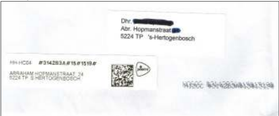
Afb. 4: Als afbeelding 3 maar met verschoven herstelsticker PostNL en nu geheel zichtbare PRIC.

Het mij onbekende vierkantje is niet een QR-code. Wat dan wel? Doel van de sticker lijkt mij duidelijk: ook de straatnaamvariatie Abr. Hopmanstraat is niet juist en moet hersteld worden. Bij PostNL moeten de nieuwste sorteermachines geld opleveren. Ook hier heeft de afzender het adres niet volkomen correct (volgens welke regels?) geschreven. Dus komen er postale correctie-maatregelen.