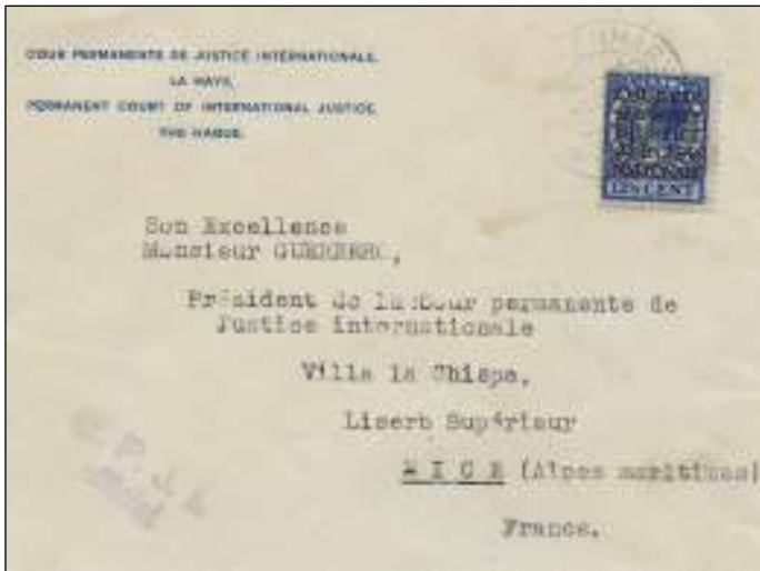
's-Gravenhage, 1 november 1937. Brief naar Nice, Frankrijk. Tarief: brief tot 20 gram 12½ cent. De postzegel is overdrukt met Cour Internationale de Justice.