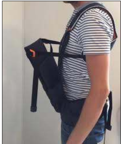
Oefenen met het 'postvest'.