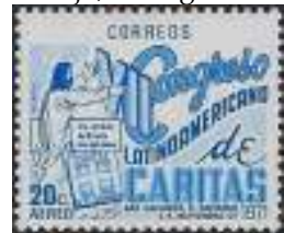
Afb. 5: El Salvador Caritas Congres 1971.

Tijdens de presentatie zal ik ook ingaan op de regionale Caritas netwerken zoals in Latijns-Amerika, waar Caritas zegels verschenen in onder andere El Salvador vanwege het 7 de Latijns Amerikaanse Caritas congres in 1971 (afb. 5).