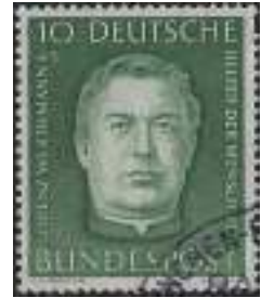
Afb. 2: Lorenz Wertmann.

Met de industrialisatie in de 19 e eeuw nam de trek naar de steden toe, en eind 19 e eeuw woonden de meeste arbeiders in erbarmelijke omstandigheden en grote armoede. In 1891 verscheen de pauselijke encycliciek Rerum Novarum (afb. 1) om deze misstanden aan te kaarten. Paus Leo XIII spoorde aan tot oprichting van vakbonden en riep de werkgevers op om betere arbeidsvoorwaarden en -omstandigheden in de fabrieken te creëren. Deze encycliciek wordt algemeen gezien als de grondlegger voor het katholieke sociale denken in de 20 ste eeuw. In 1897 werd in Duitsland door Lorenz Wertmann (afb. 2) de eerste Caritas organisatie opgericht gericht voor armoedebestrijding bij kwetsbare groepen in de samenleving. In 1901 en 1903 volgde de oprichting van Caritas Zwitserland en Caritas Oostenrijk. Wertmann was de grondlegger van het in 1950 opgerichte netwerk Caritas Internationalis, waarbij anno 2018 Caritas organisaties zijn aangesloten uit 165 landen. Deze organisaties zijn gericht op armoedebestrijding in hun eigen land, en op humanitaire hulp en wederopbouw bij rampen en conflicten.