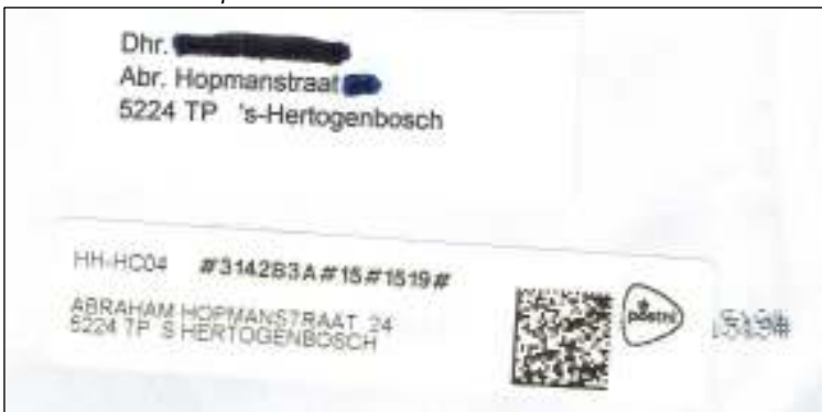
Afb. 3: Deel Hertogpost-envelop met adressticker HFV en adresverbeterstrook PostNL over PRIC.

Verwacht Weener XL met dit correctievodje van afbeelding 2 ook nog actie van de ontvanger? Bijvoorbeeld dat de ontvanger het GVB aanschrijft met verzoek het adres in Abraham Hopmanstraat te veranderen?