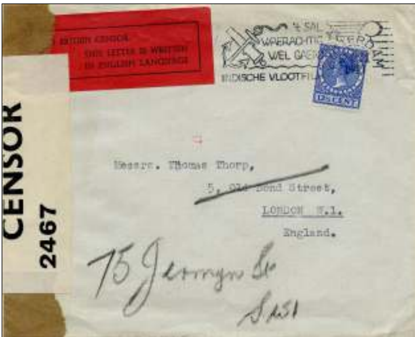
Rotterdam, 12 maart 1940. Brief naar Londen. Tarief: brief tot 20 gram 12½ cent. Censuurstrook plus vignet van de Engelse censuur. Na het uitbreken van WOII op 1.9.1939 werd de post wereldwijd door de Engelsen gecensureerd.