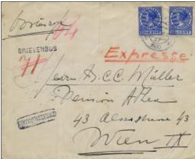
Rijnsburg, 2 juni 1930. Brief naar Wenen. Tarief: brief tot 20 gram 12½ cen t. Expresrecht 25 cent. Stempel BRIEVENBUS: in de bus gegoid. Tot 1.9.1938 moest zowel het brieftarief als het expresrecht volledig zijn voldaan om per expres te worden besteld. In Wenen per ROHRPOST (buisenpost) besteld.