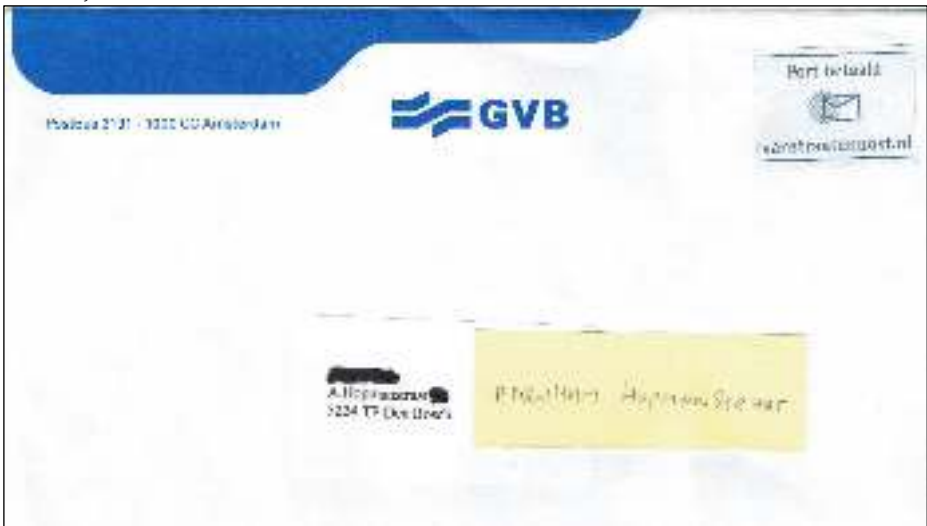
Afb. 1: GVB-envelop voor de A Hopmanstraat. Met een vanstraatenpost.nl Port Betaald-zegel.

Ergens in juli en op 16 augustus 2018 krijgt een bij mij bekende Bosschenaar uit twee verschillende postale hoeken van de samenleving een Port Betaald-stuk waarbij ik vind dat de waan het wint van de zin.