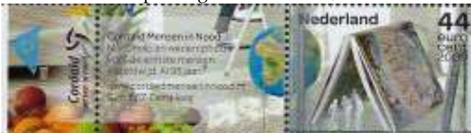
Afb. 6: Nederland 2009, Cordaid /Mensen in Nood.

In Azië, het Midden-Oosten en Afrika zijn slechts enkele Caritas zegels verschenen, zoals in Libanon en de Centraal Afrikaanse Republiek. Verder komen enkele bijzonderheden aan bod, zoals de postzegel van de diocesane Caritas Hinderheim 'Friedland Hilfe', sinds 1945 werkzaam speciaal voor vluchtelingen en migranten. Zo ook zegels uitgegeven door het Vaticaan en verwijzingen naar zeldzame Jul zegels met Caritas uit Denemarken. Ten slotte zal ik afsluiten met een korte geschiedenis van Caritas Nederland n. a. v. de in 2009 verschenen postzegel van Cordaid/Mensen in Nood (afb. 6).