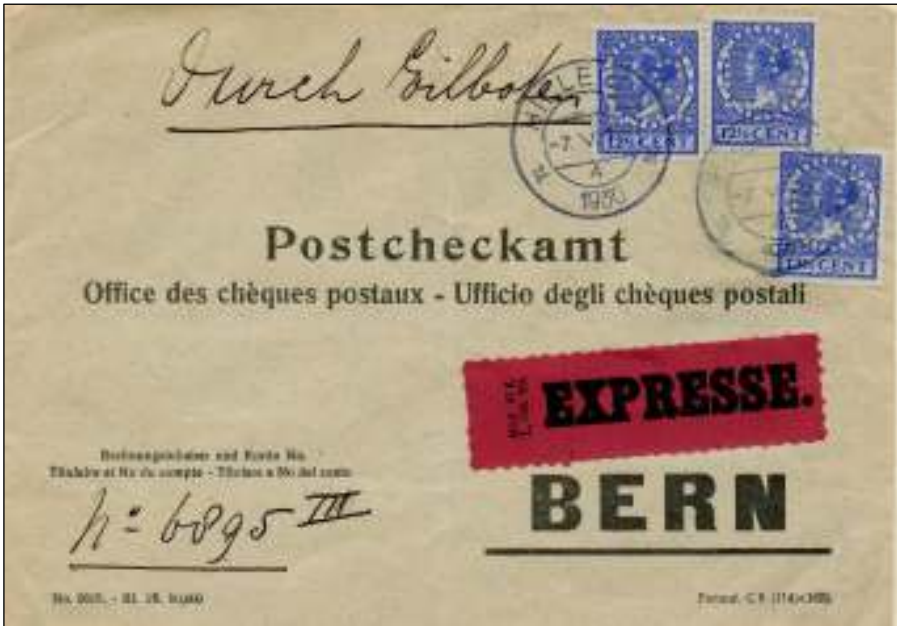
Hillegom, 7 mei 1930. Brief met bestemming Bern, Zwitserland. Tarief: brief tot 20 gram 12½ cent. Expresrecht 25 cent. Totaal 37½ cent. Firmaperforatie in de postzegels L. S. (L.Stassen Jr.)