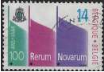
Afb. 1: 100 jaar Rerum Novarum.

In de presentatie 'Caritas-postzegels' tijdens de bijeenkomst van onze vereniging op 25 oktober a. s. wil ik de geschiedenis van 'Caritas' aan de hand van postzegels toelichten.