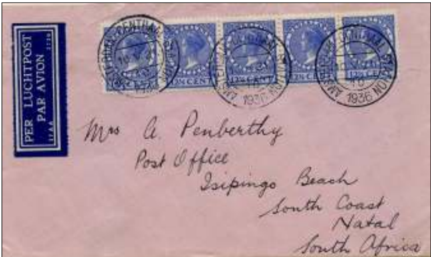
Amsterdam CS, 10 mei 1936. LP-brief met bestemming South Coast, Natal. Tarief: brief tot 20 gram 12½ cent. Luchtrecht 5-10 gram, 25 cent per 5 gram, is 50 cent. Samen 62½ cent.