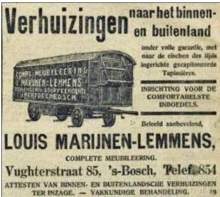
Afb. 4: Advertentie in de Bossche krant van 24 januari 1921.

Een Bossche collega-woninginrichter merkte ooit fijntjes op dat de familie van de firma Marijnen-Lemmens een zuster had in het klooster van de zusters Mariënborg, zodat zij zich verzekerd wisten van opdrachten van die kloosterorde.