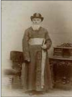
Johann Martin Schleyer, de maker van het Volapük, in vol ornaat.

Degene die er in slaagt, ontvangt 'eeuwige roem' en wellicht ook nog wel iets anders... Uw oplossing s.v.p. naar de redacteur (adres: zie kader op pagina 2).