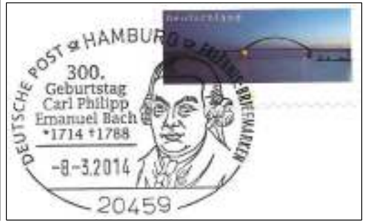
Carl Philipp Emanuel Bach componeerde een 'Fuge über B-A-C-H'.