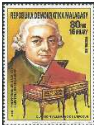
Vader J.S. en zoon C.Ph.E. Bach.