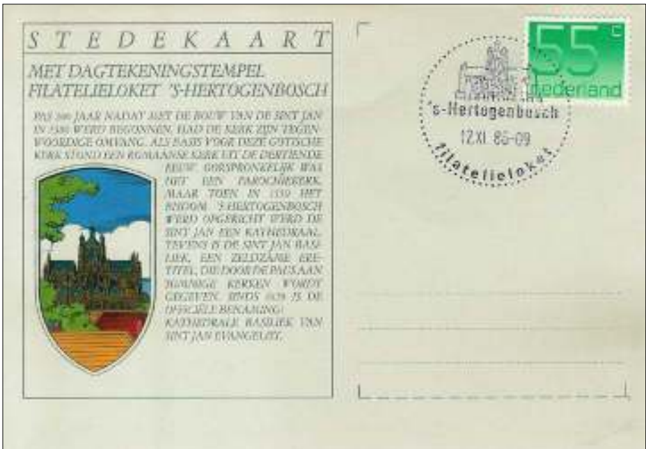
Afb. 4: Stedekaart met eerste dagstempel van het filatelieloket 's-Hertogenbosch.

Zijn protestantse afkomst heeft niet kunnen verhinderen dat Karel de Rooij zich helemaal thuis voelt in het 'Bossche'. Zo schreef hij bijvoorbeeld een boek