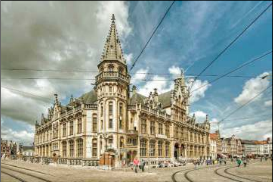
Foto van het Postkantoor te Gent. In sommige (beschaafde) landen houdt men dergelijke gebouwen in ere en worden ze niet gesloopt.

Daar ligt Wim's inspiratiebron. Door gebruikmaking van HDR-techniek (High Definition Range) hebben zijn foto's een tekenachtig effect. Hij tracht ermee een beeld te creëren van de stad zoals die vroeger is geweest. Want die vindt hij mooier dan nu. Hij geniet van verhalen van oude mensen over