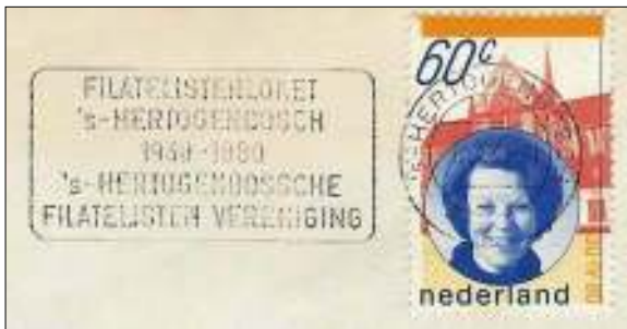
Afb. 1: Gelegenheidsstempel Filatelistenloket 's-Hertogenbosch 1930-1980.

Het eerste bestuur van onze vereniging ging meteen zo voortvarend van start, dat al twee maanden na de oprichtingsvergadering in oktober 1930, op zaterdag 13 december voor de eerste keer een 'verzamelaars-loket' in het postkantoor te 's-Hertogenbosch werd opengesteld. Het was het succesvolle resultaat van een lobby-actie bij de PTT-directie in Den Haag. Het verzamelaars-loket was voortaan steeds open op de 2 e zaterdagmiddag van de maand. Aan het loket waren alle postzegels te koop waarvan de geldigheidstermijn nog niet was verstreken, ook al was de periode van verkoop aan de normale loketten al afgesloten. Niet veel later werd aan de wand een kastje gehangen waarin alle postzegels werden tentoongesteld die bij het zogenaamde filatelistenloket konden worden gekocht.