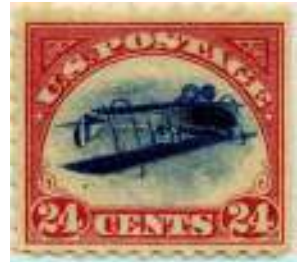
afb. 5: de 'Curtiss Jenny' op z'n kop.

's Wereldse eerste permanente luchtpostzegels werden in mei 1918 door de Verenigde Staten uitgegeven met de afbeelding van de Curtiss Jenny . De 24 cent met kopstaand middenstuk was als zeer grote rariteit de eerste foutdruk onder de luchtpostzegels (afb. 5). Er zijn er maar honderd van gemaakt en twee daarvan zijn nog spoorloos. Op dit moment wordt er grif meer dan 100.000 dollar voorgegeven. Je zult hem maar per ongeluk in je verzameling hebben.