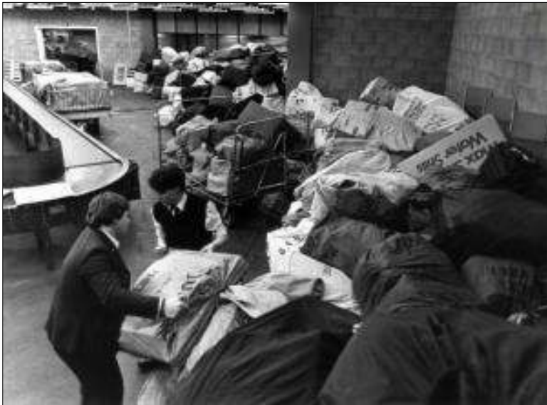
Afb. 5: Een overvolle sorteerkamer tijdens de poststaking in 1983.

De twee stakingsweken waren een gouden tijd voor particuliere bezorgdiensten. Stadspostdiensten schoten als paddenstoelen uit de grond. Verschillende grote vaste klanten van de PTT (o. a. postorderbedrijf Wehkamp) zochten daar hun toevlucht. Het leverde een enorme blijvende schadepost op voor de PTT, want na afloop van de staking keerden ze niet meer terug. Stadspostdiensten gaven speciale (extra dure) postzegels uit en maakten daarvoor soms gebruik van overdrukken op officiële PTT-zegels (afb. 6 en 7).