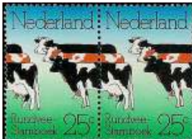
Afb. 3: Een 'normaal' paartje koetjes.

Dat stond niet in de weg, dat Van Roosmalen en Cleij dat jaar maar liefst zeven serieuze inzendingen hadden, bovendien een artikel van 30 pagina's in de tentoonstellingscatalogus over 'De Bossche Abklatsch'.