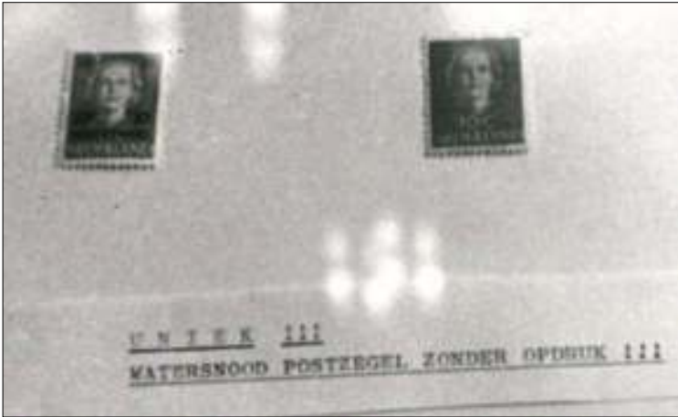
Afb. 2: De Watersnoodzegel 1953 met en zonder opdruk.