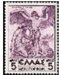
afb. 1: luchtpostzegel