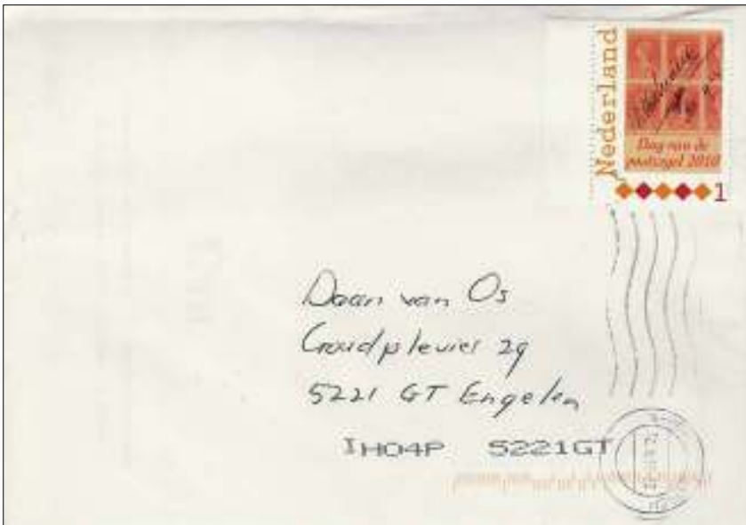
Gesorteerd en overdwars gestempeld, maar de postzegel is niet geraakt.

Thuis gekomen, snel een envelop aan mezelf geadresseerd en voorzien van mijn nieuwe aanwinst. Deze gepost in de overtuiging dat er op maandag een brief in de bus zou liggen met een postzegel die gestempeld was vóór de officiële uitgave-datum. Vervolgens naar de postzegelinstuif waar ik nu ook