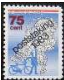
Afb. 6: Stadspostzegel van Augustinusga in Friesland ter gelegenheid van de Poststaking in 1983.

De twee stakingsweken waren een gouden tijd voor particuliere bezorgdiensten. Stadspostdiensten schoten als paddenstoelen uit de grond. Verschillende grote vaste klanten van de PTT (o. a. postorderbedrijf Wehkamp) zochten daar hun toevlucht. Het leverde een enorme blijvende schadepost op voor de PTT, want na afloop van de staking keerden ze niet meer terug. Stadspostdiensten gaven speciale (extra dure) postzegels uit en maakten daarvoor soms gebruik van overdrukken op officiële PTT-zegels (afb. 6 en 7).