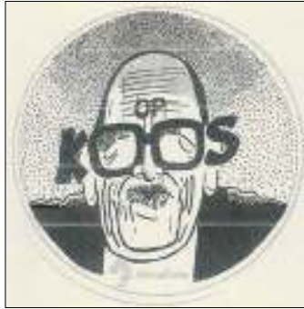
Afb. 4: 'Boos op Koos'.

Die poststaking, anderhalf jaar voordat de tentoonstelling plaatsvond, lag iedereen toen nog vers in het geheugen. In de herfst van 1983 waren de postbodes nog officieel ambtenaar. Dat jaar stond het land er economisch slecht voor. Onder de strakke leiding van premier Lubbers werd dan ook flink bezuinigd. Ambtenaren en trendvolgers zouden 3,5 procent van hun loon moeten inleveren. Minister van Binnenlandse Zaken Koos Rietkerk toonde zich een starre onderhandelaar. Vakbondsbestuurder Jaap van der Scheur en de ambtenaren waren daarom 'Boos op Koos' (afb. 4).