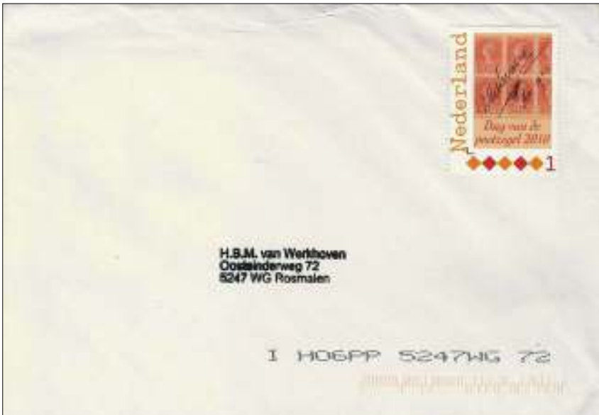
Gesorteerd en bezorgd, maar niet afgestempeld.

O tempora o mores (Ach, wat een tijden, ach wat een zeden!). De oude Cicero riep het al uit in 63 v. Chr. Leefde hij nu, hij zou dezelfde woorden gebruiken.