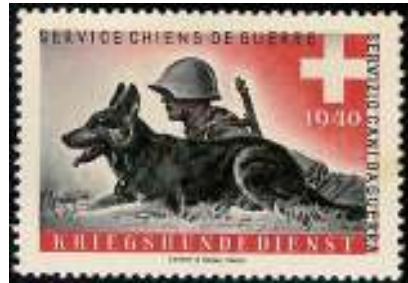
Afb. 3: Twee Zwitserse soldatenzegels

in heel kleine oplagen en daar kun je, ook al zou je het geld ervoor hebben, niet of nauwelijks aankomen. Tenslotte is hij gefascineerd door de Zwitserse soldatenzegels, die tijdens de Eerste en Tweede Wereldoorlog zijn uitgegeven t. b. v. de postverzorging van diverse, vaak heel kleine legeronderdelen. Ook die kennen geen grote schare verzamelaars. Graetz verzamelt ze graag, ook al omdat er nogal vaak afbeeldingen van paarden en honden op zijn te vinden (afb. 3) en dat sluit weer mooi aan bij zijn thematische verzameling