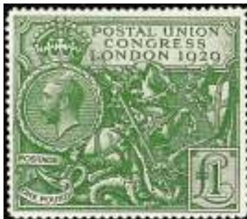
Afb. 2: de 'mooiste'