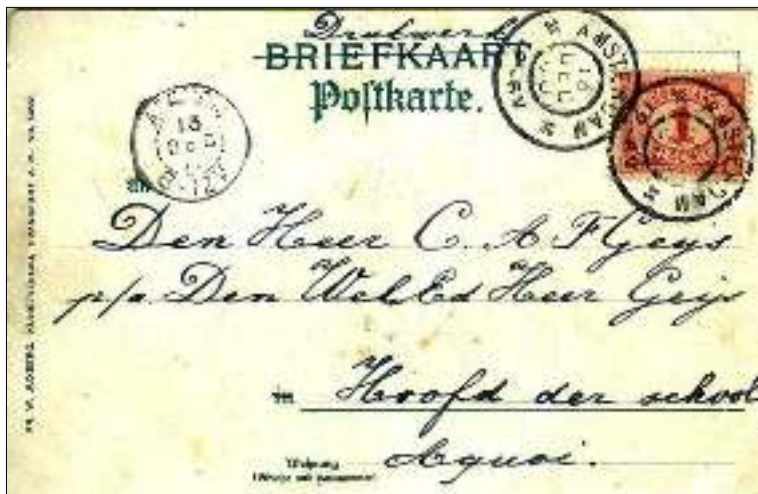
Afb. 9: Briefkaart van Amsterdam naar Acquoy met klein rond aankomststempel van 13 december 1900