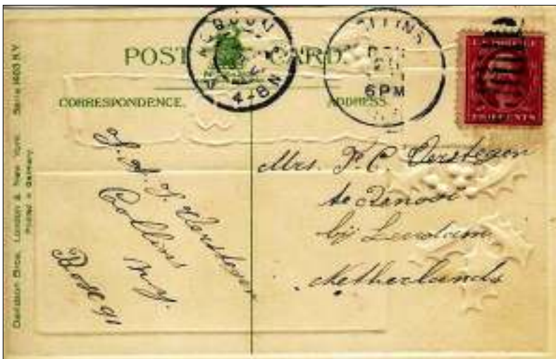
Afb. 11: Briefkaart uit Collins N. Y. USA naar Rhenoy (Renooi) met als 'transitstempel' het grootrondstempel Acquia