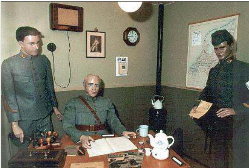
Afb. 4: Een veldpostkantoor anno 1940 zoals dat is te zien in het Museum van de Verbindingsdienst te Ede