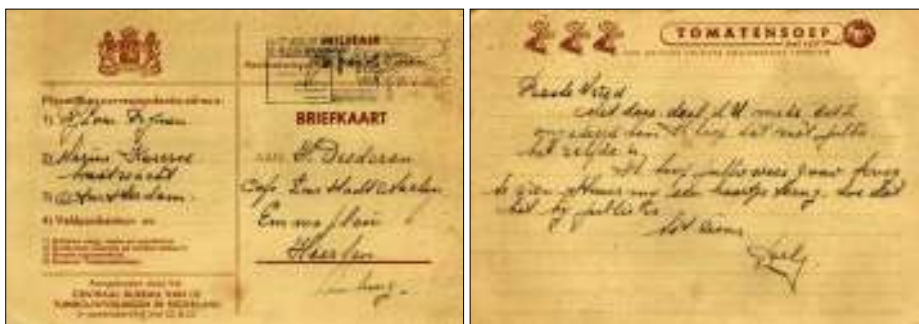
Afb. 1: De militaire/tomatensoep briefkaart van 1940

De kaart (afb. 1) maakt een officiële indruk, maar vanwaar die symbiose tussen het Nederlandse Wapen ('Je Maintiendrai') en 'Tomatensoep met rijst van zuivere volrijpe Hollandsche tomaten'?