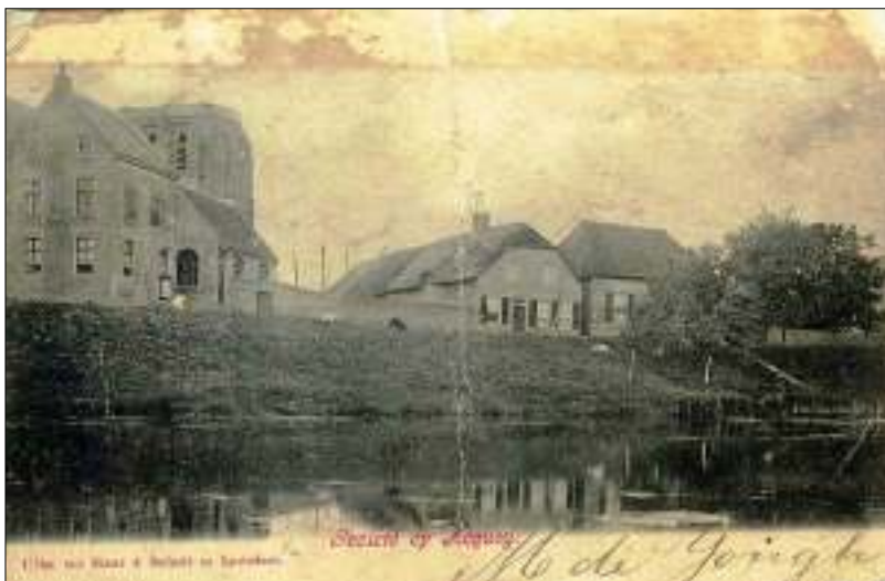
Afb. 1: 'Gezicht op Acquoy' uit 1902, uitgave ter Haar en Schuit, Leerdam

Het imposantste gebouw is de Nederlands Hervormde kerk die al dateert van vóór 1371. In 1674 heeft een storm zowel het schip als de toren van de kerk in een ruïne veranderd. Beide werden gerestaureerd, maar in 1867 is het bovenste gedeelte van toren opnieuw afgewaaid en daarna niet meer opgebouwd.