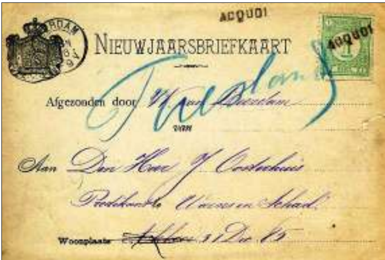
Afb. 7: Nieuwjaarskaart verzonden op 1 januari 1886, verstuurd van Acquoy naar predikant Oosterhuis in Warns en Schat te Friesland. Voorzien van naamstempels Acquoi en dagtekenstempel van Leerdam, waaronder Acquoy ressorteerde.

vroegste stuk van 1 augustus 1905 (afb. 10). Uit stukken in mijn verzameling blijkt dat in ieder geval het plaatsje Rhenoy (afb. 11), maar zeer waarschijnlijk ook Gellicum, door een bode vanaf hulpkantoor Acquoy postaal werden bediend.