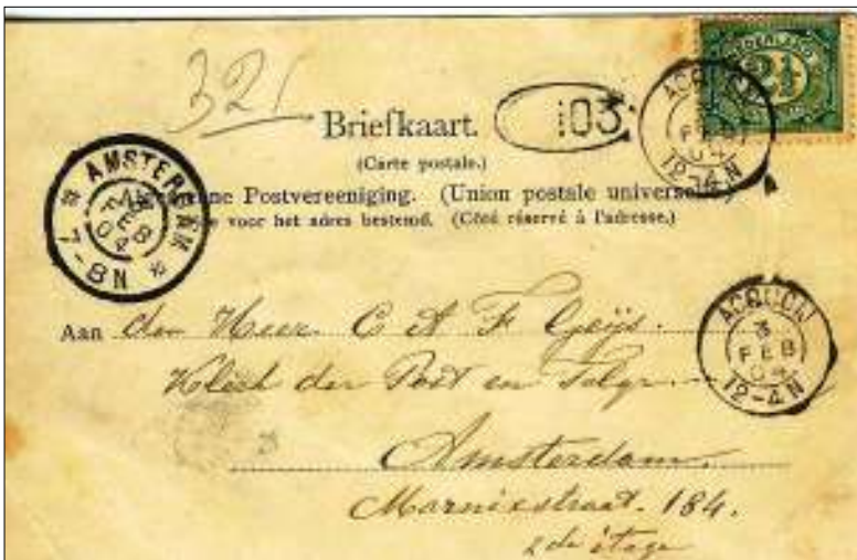
Afb. 8: Briefkaart verzonden op 3 februari 1904 van vader aan zoon (mijn opa). Voorzien van een kleinrond vertrekstempel Acquoy