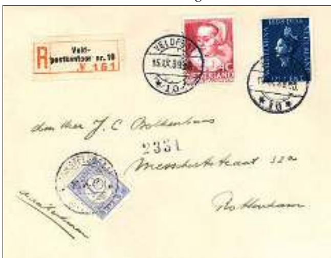
Afb. 3: Brief aangetekend verzonden op 15.9.1939 van Veldpostkantoor nr. 10 ('s-Hertogenbosch) naar Rotterdam