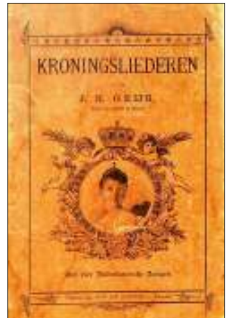
Afb. 5: Voorblad van een bundel 'Kroningsliederen' door J. H. Geijs