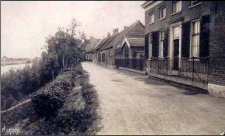
Afb. 3: Foto Lingedijk met rechts op de voorgrond de school

Ook verscheen er van zijn hand een bundel 'Kroningsliederen' (afb. 5) ter gelegenheid van de kroning van Prinses Wilhelmina tot Koningin der Nederlanden.