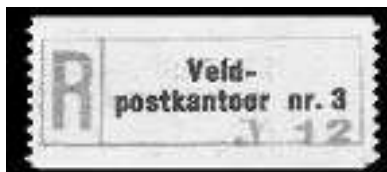
Afb. 2: Aantekenstrookje Veldpostkantoor nr. 3

Dat laatste is best een compliment van zo'n expert. De militaire briefkaart is dus gesponsord en wel door het Centraal Bureau van de Tuinbouwweilingen in Nederland. Dit Bureau mocht als tegenprestatie reclame maken voor Hollandsche tomatensoep. En de Duitsers waren er op 18 mei 1940 kennelijk nog niet aan toe om het verzenden van zo'n kaart met de Nederlandse leeuw erop te verhinderen.