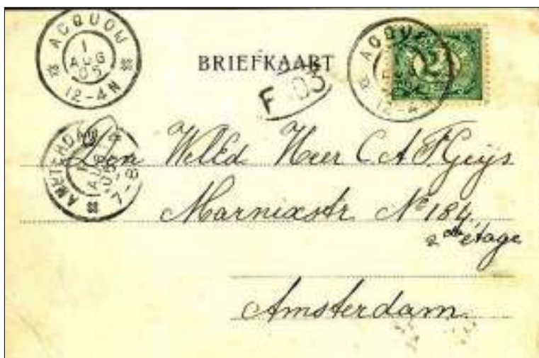
Afb. 10: Briefkaart met groot rond vertrekstempel Acquoy