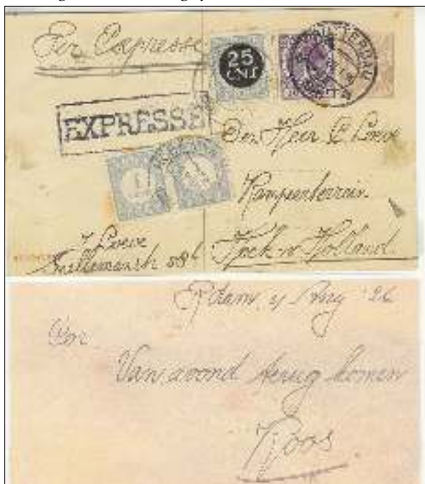
Expresse briefkaart van Rotterdam naar "Kampeerterein" Hoek van Holland, bezorgd via postkantoor Hoek van Holland met 27cts extra (scan van voor- en achterzijde met een kort maar krachtig bericht!).