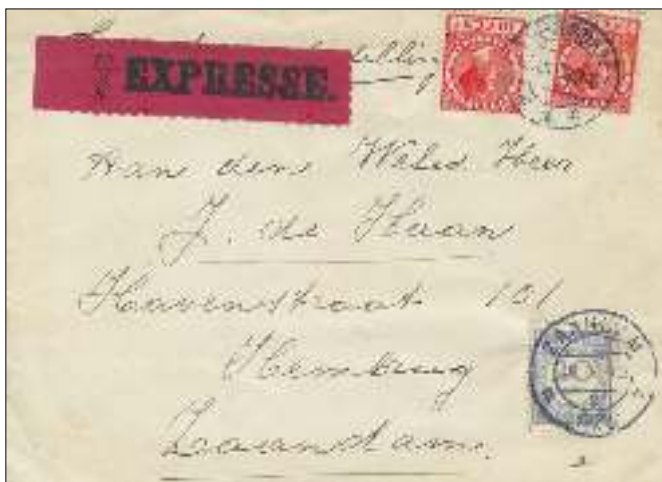
Expresse brief van Bergen (N.H.) naar Hembrug, bezorgd via postkantoor Zaandam met een extra belasting voor "evenredig afstandsrecht" van 20cts.