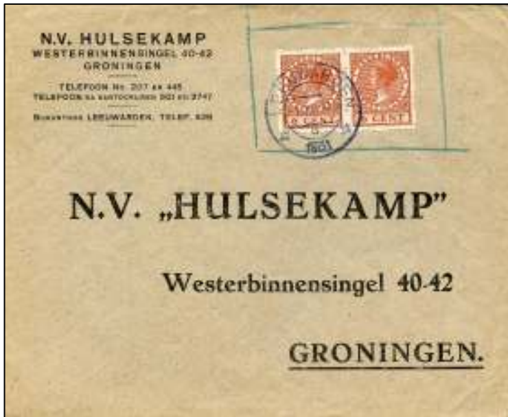
Leeuwarden, 1 december 1931. Brief met bestemming Groningen. Tarief: brief 21-40 gram 12 cent. Voldaan met een paartje vierzijdige roltanding .