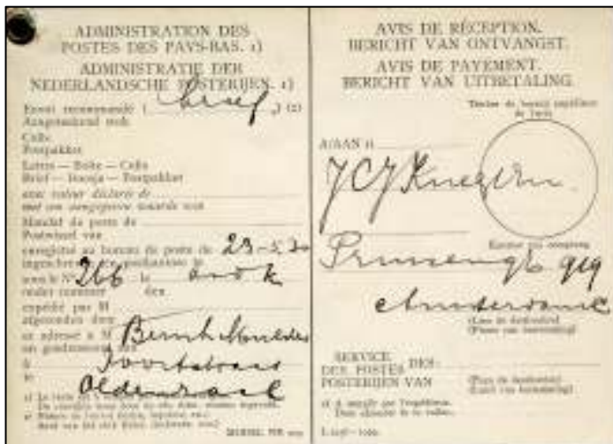
De aangehechte Bericht van Ontvangst-kaart/Avis de Réception die niet werd gebruikt omdat de brief retour kwam.