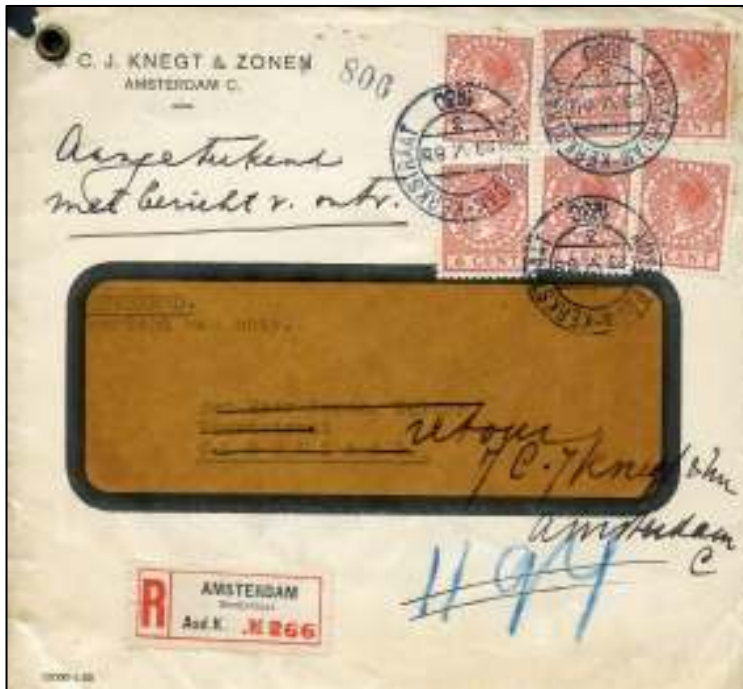
Amsterdam-Kerkstraat, 23 mei 1930. Brief met bestemming Oldenzaal. Tarief: brief tot 20 gram 6 cent, aantekenenrecht 15 cent, bericht van ontvangst 15 cent. Totaal 36 cent. Firmaperforatie KNEGT in zegels. Retour gestuurd.