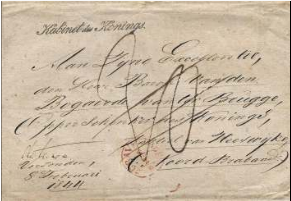
Afb. 3: Briefomslag van het Kabinet des Konings, 's Gravenhage 8 februari 1844 aan de Opper Schenker des Konings. Port 20 cent door ontvanger te betalen.

naar het Binnenhof direct voor het rijtuig van de koning, in twee koetsen, 'ieder met zes paarden bespannen, gaande twee lakkeijen naast elk portier'. En tijdens de zitting namen de grootofficieren plaats achter de troon van de koning.