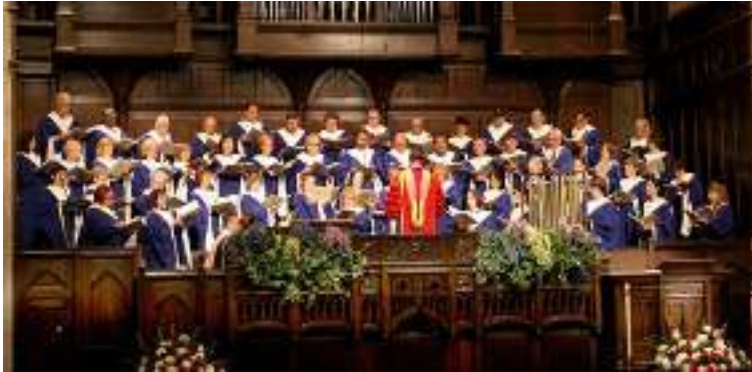
Afb. 3: Het Cathedral Choir van de First Presbyterian Church of Hollywood.