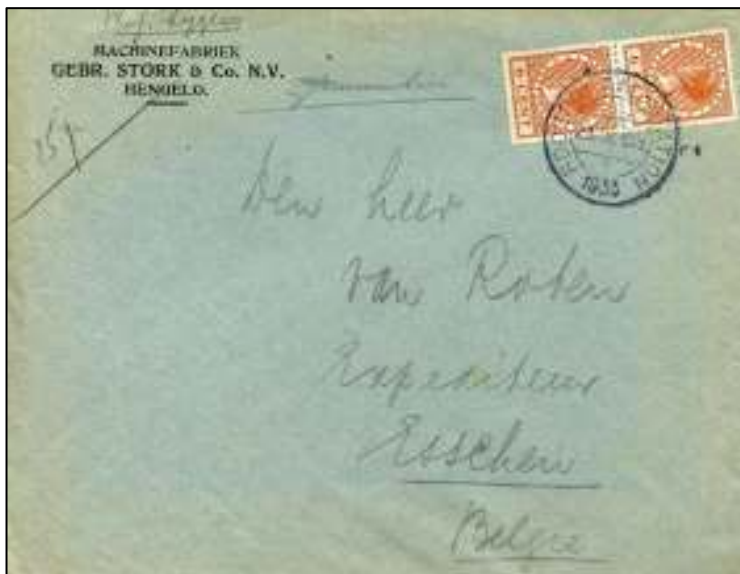
Roosendaal-Station, 23 september 1933. Brief met bestemming Esschen, België. Grenstarief minder dan 30 kilometer, brief 21-40 gram 12 cent. Gelijk aan binnenlands tarief.