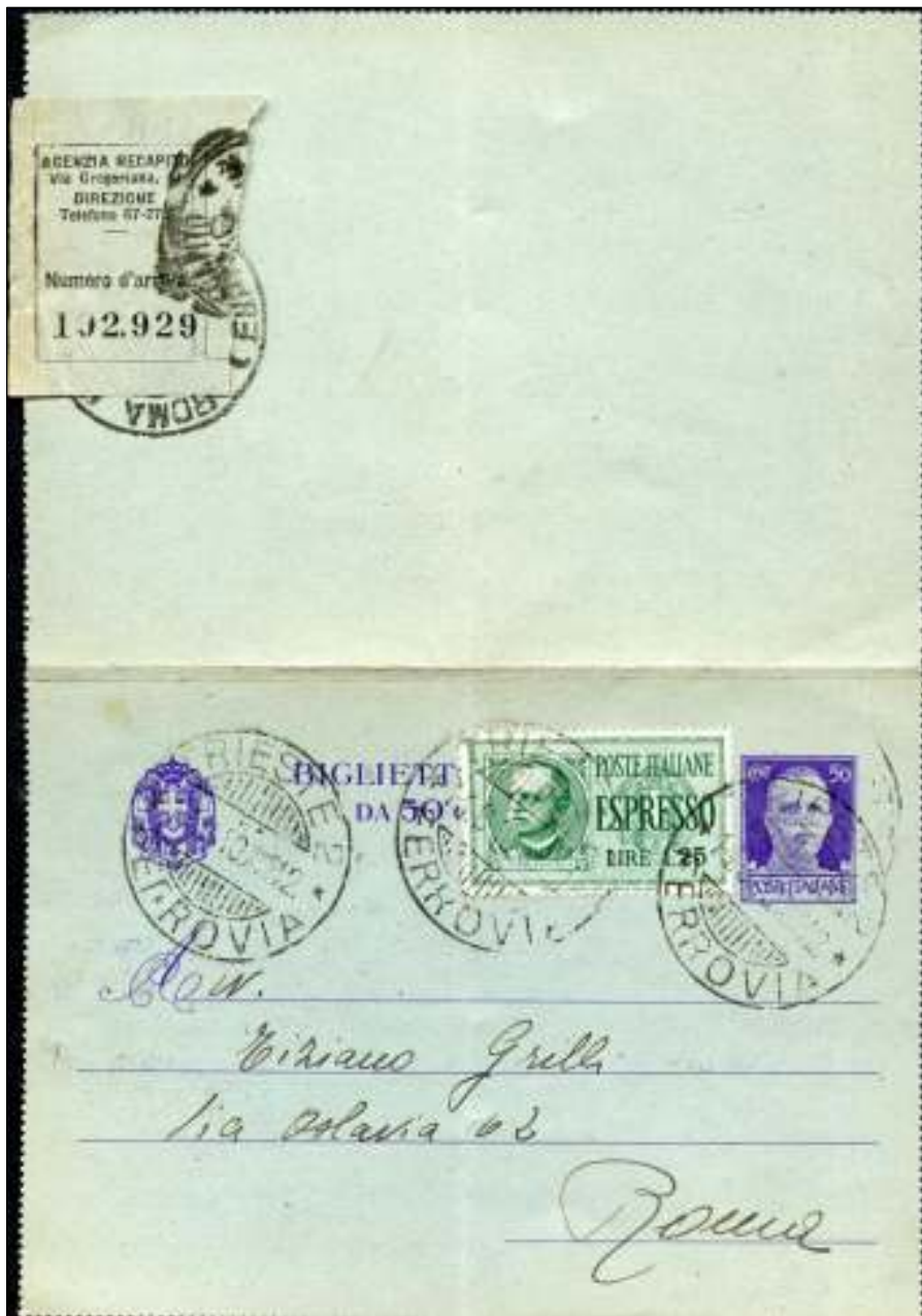
Trieste 2, 14 augustus 1940. Kaart per espresse met bestemming Rome. Tarief: als brief, 50 centesimi, expresrecht 1,25 lire. Bestelling in Rome door een door de Posterijen geautoriseerd agentschap. Zie het vignetje.