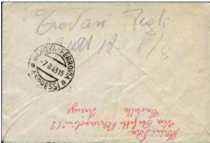
Achterzijde met het aankomststempel Genua 7 augustus 1943. Naam/adres van de afzender, en een geschreven adres in Pegli plus 8/8 als datum van aankomst.