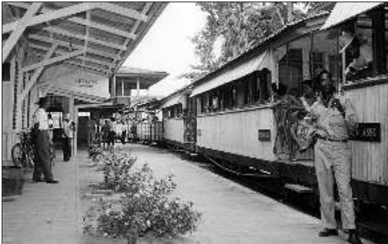
Station van Paramaribo, 1961.

Hij houdt een klein, select verzamelgebied over: Suriname, niet-gestempeld Paramaribo. Ook allerlei stempels van stationnetjes langs de spoorlijn door Suriname genieten zijn bijzondere aandacht. Met daarnaast ook ansichtkaarten van de spoorlijn door Suriname en boeken over dit land.