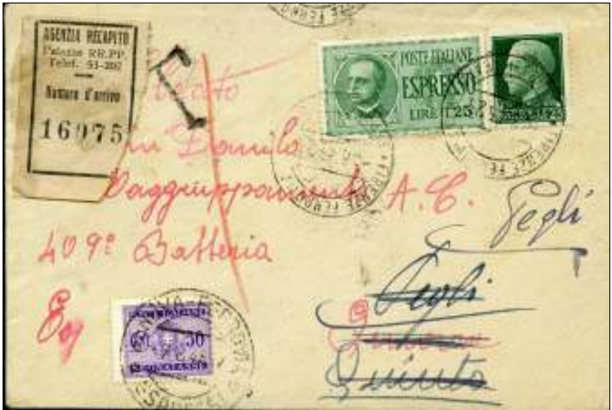
Firenze, 5 augustus 1943. Brief per esprime met als eerste bestemming Genua. Tarief: brief 50 centesimi, expresrecht 1,25 lire. Frankering met 25 centesimi; het tekort van 25 centesimi werd verdubbeld tot 50 centesimi verhoogd port. De eindbestemming is Pegli, adres en datum van bezorging op de achterzijde. Het vignet is bij de eerste bestelling in Genua geplakt door het geautoriseerde agentschap.