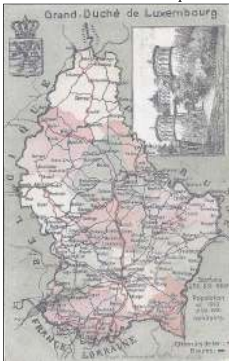
Afb. 1: Luxemburg omstreeks 1910.

Dit keer maken we een overstapje naar het Groothertogdom Luxemburg, de minibuur van onze al veelbesproken zuiderbuur. In het Maandblad Filatelie