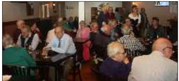
we beginnen met 'n gezellige borrel

'Iedereen van harte welkom. Op naar 2020, ons 90-jarig jubileum, met – wie weet – een internationale in 's-Hertogenbosch!'