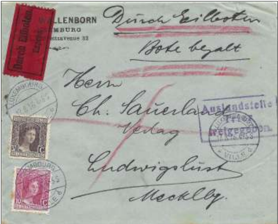
Afb. 3: Expressebrief van Luxembourg stad, met een samengestelde frankering van 10 en 37½ cts (Marie-Adelheid), verzonden 17-8-1916 naar Ludwigslust, Mecklenburg. Tarieven: 17½ cts brief naar Duitsland tot 20 gr, 30 cts expresse toeslag.

1919 leidde tot pro-republikeinse demonstraties in de straten van de hoofdstad. Maar een op dezelfde dag door de communistische opstanden in Rusland en Duitsland geïnspireerde coup door een handvol Luxemburgse militairen werd snel door Franse troepen de kop in gedrukt. Drie dagen later deed Marie-Adelheid afstand van de troon ten gunste van haar zuster Charlotte.