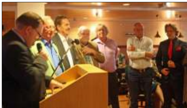
de voorzitter bedankt zijn bestuur