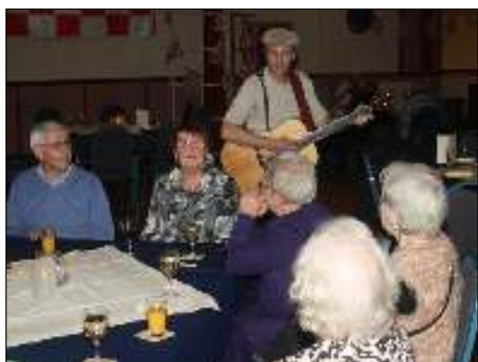
de rondtrekkende troubadour