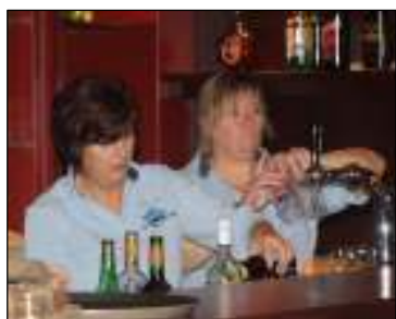
de dames achter de bar