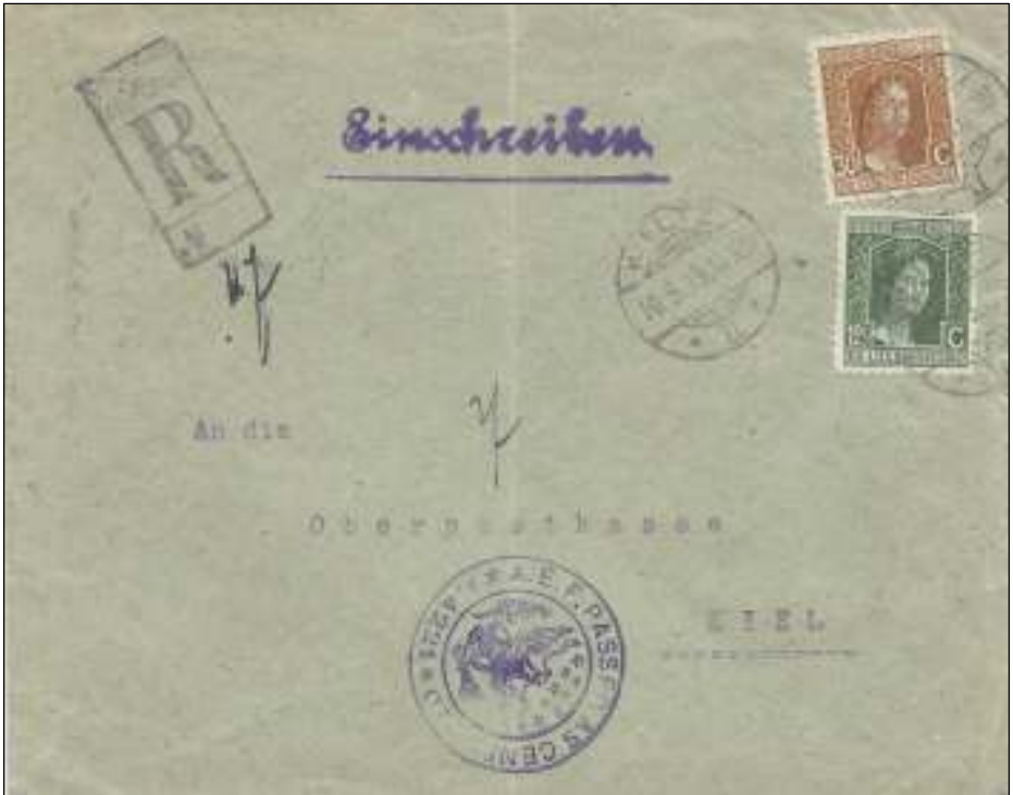
Afb. 4: Aangetekende brief uit Wiltz, van 10 maart 1919 via Luxemburg stad (stempel verso) verzonden naar Kiel, Duitsland. Port: 47½ cts.

Tarief: 17½ cts brief tot 20 gr D en 25 cts aantekenrecht. Bij doorgang op de linker Rijnsoever onderworpen aan Amerikaanse censuur (bezetting Rijnland). Dubbelringsstempel met Amerikaanse adelaar in paars en 'A.E.F. passed as censored 4221'.