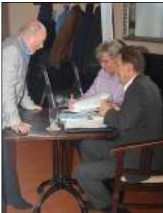
comité van ontvangst