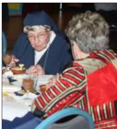
de zuster genoot dat ze er weer bij was