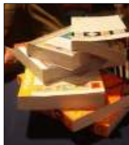
cadeau van de Stichting aan de Vereniging