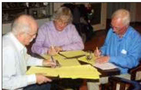
nakijken van de quizformulieren