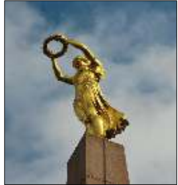
Afb. 2: de 'Gelle Fra'.

van de overwinning en van de vrijheid, de Friddenskinnigin (afb. 2). De inscriptie in de voet van het monument vermeldt dat 3.700 Luxemburgers in Franse krijgsdienst zijn getreden en dat er 2.000 slachtoffers te betreuren zouden zijn geweest. Of het alleen gesneuvelden of ook gewonden betreft, is niet duidelijk. Het beeld was binnenslands lange tijd omstreden. Weer een andere –Franse- bron meldt dat slechts 948 Luxemburgers –overwegend Franstaligen- gediend zouden hebben aan geallieerde zijde. 836 van hen dien-