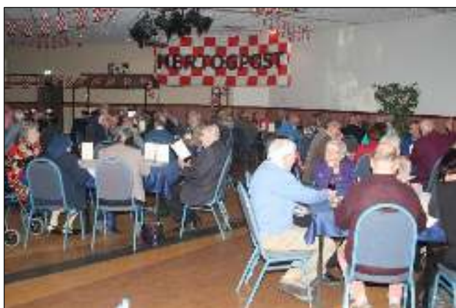
'n tevreden sfeer