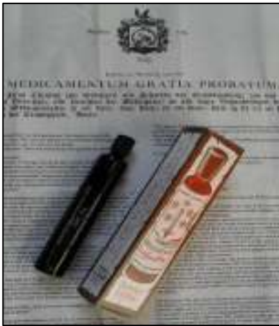
Afbeelding 4: Een flesje van 10 ml Haarlemmerolie van de firma C. De Koning Tilly, in 2014 voor 8,10 € gekocht.