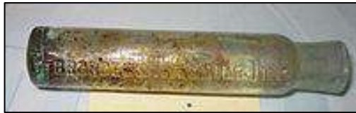
Afbeelding 5: Flesje Haarlemmerolie van de Gebr. Waaning-Tilly.