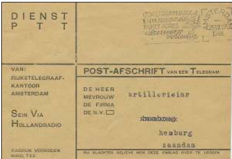
Afb. 4: Envelop voor post-afschrijf van een telegram, augustus 1948.

Eigenlijk zegt het woord het zelf al: wat aanvankelijk een telegram is, d. w. z. een kort bericht dat via de kabel of de ether op een snelle manier is verzonden, krijgt bij de papieren bezorging een tragere behandeling als een gewone brief (afb. 4).