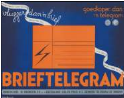
Afb. 5: Brievenbusbiljet d. d. 1948.

Wie de hele tekst van de brochure wil lezen zoals hieronder afgebeeld, kan zijn loep erbij pakken. Ook kan men het artikel bekijken op onze website Hertogpost.nl in een vergrote vorm.