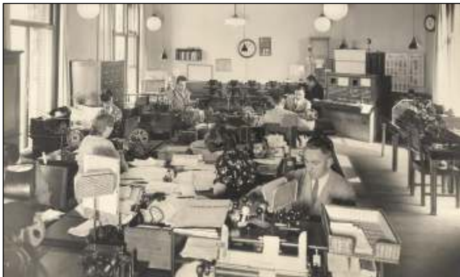
Afb. 3: De telegraafafdeling van het 's-Hertogenbosse hoofdpostkantoor aan de Kerkstraat, eind jaren '30.

Wat verder wel een bekend gegeven is: de telegraafdienst beschikte over eigen telegraafkantoren (afb. 3) en over eigen telegrambestellers, die niet alleen telegrammen bestelden maar ook expressepost.