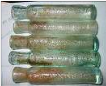
Afbeelding 3: Acht centimeter lange oude Haarlemmerolieflesjes met opschrift 'C. de Koning Tilly'.