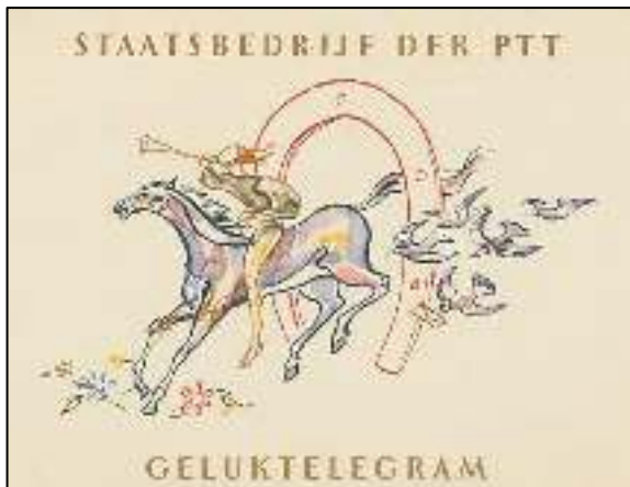
Afb. 2: Afbeelding op een 'gelukstelegram'.

stiefmoederlijk is behandeld. Er bestaat nauwelijks literatuur over de Nederlandse historie van het telegram. Het handboek van de BBF-cursus wijdt er deze ene zin aan: 'Hoewel telegrammen niet hun hele traject aflegden als een brief, werden ze uiteindelijk wel als een poststuk bezorgd en daarom kunnen ze in een verzameling als een volwaardig poststuk worden gebruikt.' Inderdaad kunnen in thematische verzamelingen wel telegrammen worden aangetroffen. Voornamelijk gelukstelegrammen, vanwege de vaak fraaie en thematisch interessante afbeeldingen op het speciaal daartoe vervaardigde drukwerk (afb. 2).