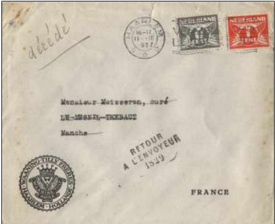
Afb. 6: Voorzijde van de brief.

en de stok (met drie vijfstralige open, uit elkaar staande sterren) vermeldt als plaats Haarlem, als datum 11 maart 1937 en als dagdeel in de 24-uurs indeling 16-17 uur. De omslag heeft een ongebruikte sluitklep. Volgens het tarief in de periode 1 november 1928 tot 1 november 1946 gaat het hier om drukwerk buitenland tot 50 gram: tarief 2½ cent. En die 2½ cent is hier geplakt.