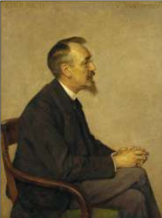
Portret van Antoon Derkinderen door Jan Veth 1 .

Den Bosch heeft een aantal bekende schilders voortgebracht. De meest beroemde daarvan is natuurlijk Jheronimus Bosch. Maar na hem heeft Den Bosch ook andere schilders van naam voortgebracht. Bijvoorbeeld Jan Sluijters (1881-1957), waarvan in het Noord-Brabants Museum een aantal werken als onderdeel van de vaste collectie getoond wordt. Een andere, tegenwoordig misschien iets minder bekende Bossche schilder, was Antoon Derkinderen.