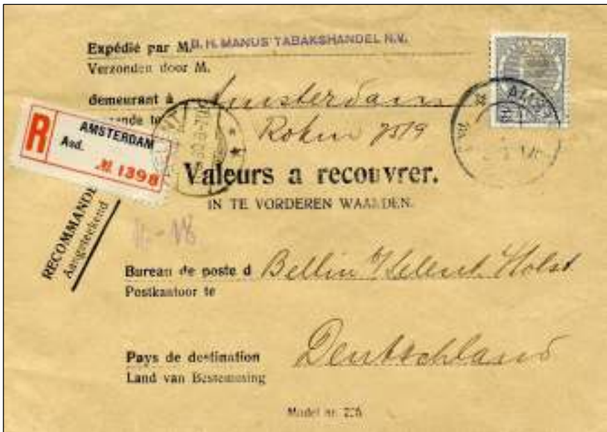
Amsterdam, 16 juni 1930. Brief 'valeurs a recouvrer' naar Selent, Duitsland. Tarief: als brief tot 20 gram 12½ cent, aantekenrecht 15 cent. Totaal 27½ cent. In dit soort brieven werden kwitanties en wissels ter inning door de Posterijen opgestuurd. Firmaperforatie in zegel B.H.M.