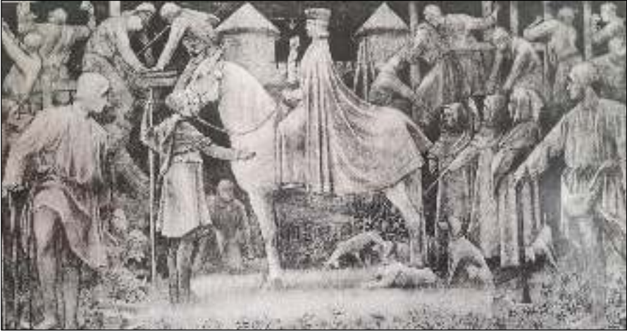
Schets eerste Bossche wandschildering 1892.