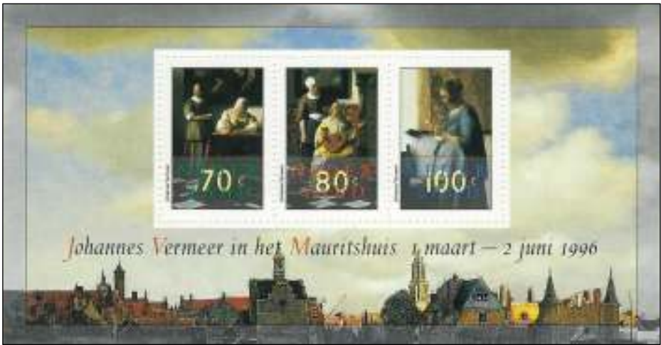
Johannes Vermeer: Gezicht op Delft.