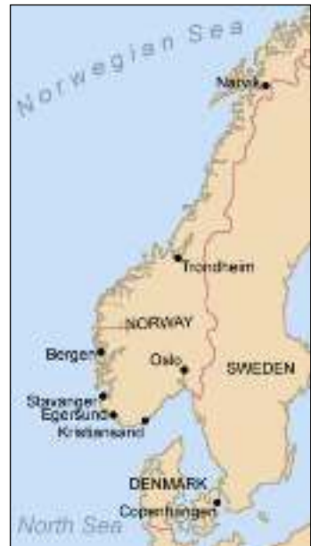
Afb. 4: Duitse oorlogsdoelen Operatie Weserübung 9 april-10 juni 1940 in Denemarken en Noorwegen.

De Britten winnen op 9 en 13 april 1940 weliswaar de 1 e en 2 e zeeslag om Narvik, maar de geallieerden (Britten, Noren, Polen en Fransen) verliezen uiteindelijk de land-, zee- en luchtgevechten. Narvik blijft in Duitse handen. Dan geeft de Britse Admiraliteit eind mei haar marine de opdracht om de geallieerde grondtroepen te evacueren. Operatie Alphabet is geboren. Om de evacuatie te laten slagen hebben de Britten troepenschepen nodig. Daarom wordt het vracht- en passagiersschip TSS Van Dyck geconfisqueerd en op het voordek voorzien van een kanon. Kapitein Wilson vaart met 30 officieren en 132 manschappen op zijn troepentransportschip H.M.S. Vandyck naar Noorwegen.