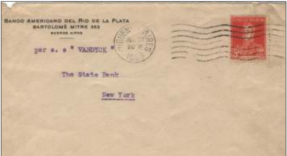
Afb. 3: Briefomslag van de Banco Americano del Rio de la Plata te Buenos Aires naar The State Bank New York. Vervoerd per s.s "VANDYCK".

Op het zegelbeeld staat José Francisco de San Martin (1778-1850), een Argentijnse generaal en de belangrijkste zuidelijke leider in de Zuid-Amerikaanse onafhankelijkheidsstrijd. Hij is de nationale held van Argentinië. Bevrijder van Chili, Peru en Argentinië! Zijn medestrijder tegen de Spaanse overheersing is de wellicht meer bekende Simon Bolivar.