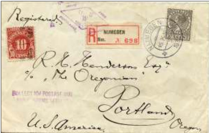
Nijmegen, 15 november 1932. Brief met bestemming Portland, USA. Tarief: brief tot 20 gram 12½ cent, aantekenrecht 15 cent. In de USA 10$ cents voor douanekosten geheven.