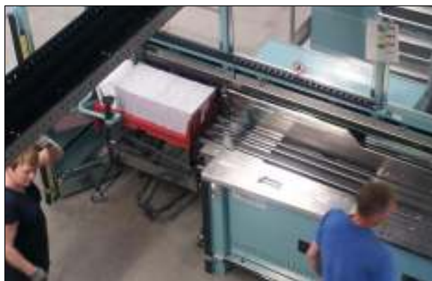
Krab maar eens achter je oren