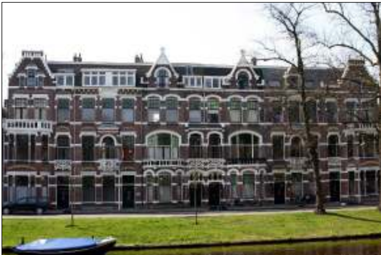
Leiden, Witte Singel.

's-Gravenhage, 1 april 1937. Drukwerk-rouwbrieff met bestemming Leiden. Tarief: drukwerk enveloppe 1½ cent tot 50 gram, toeslag voor SPOED (immers verplicht bij expresse drukwerk ½ cent), expresrecht 10 cent. Totaal 12 cent. De enveloppe is in de bus gegooid, zie het stempel BRIEVENBUS.