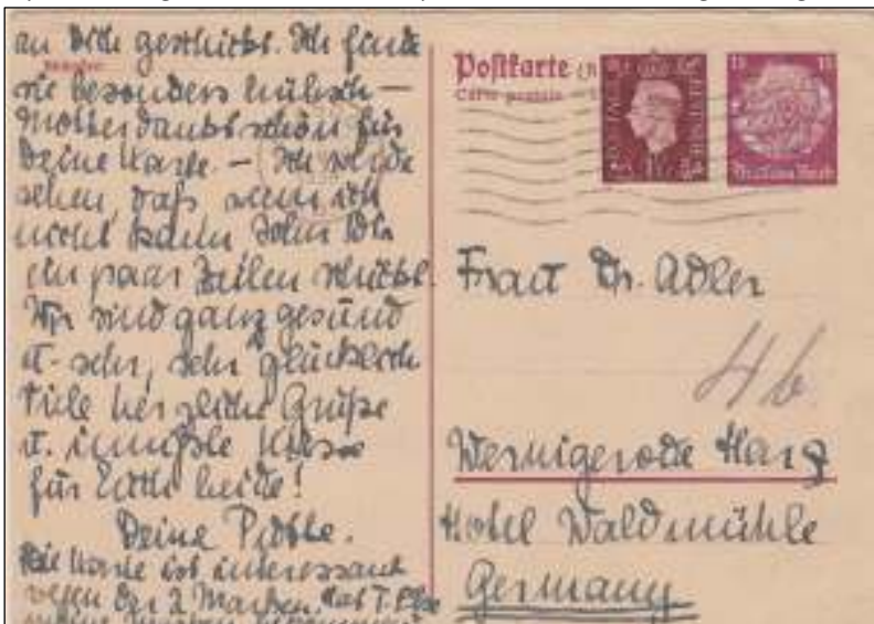
Glasgow, 18 maart 1939. Ook hier was de bijfranking van 1½ pence onnodig.