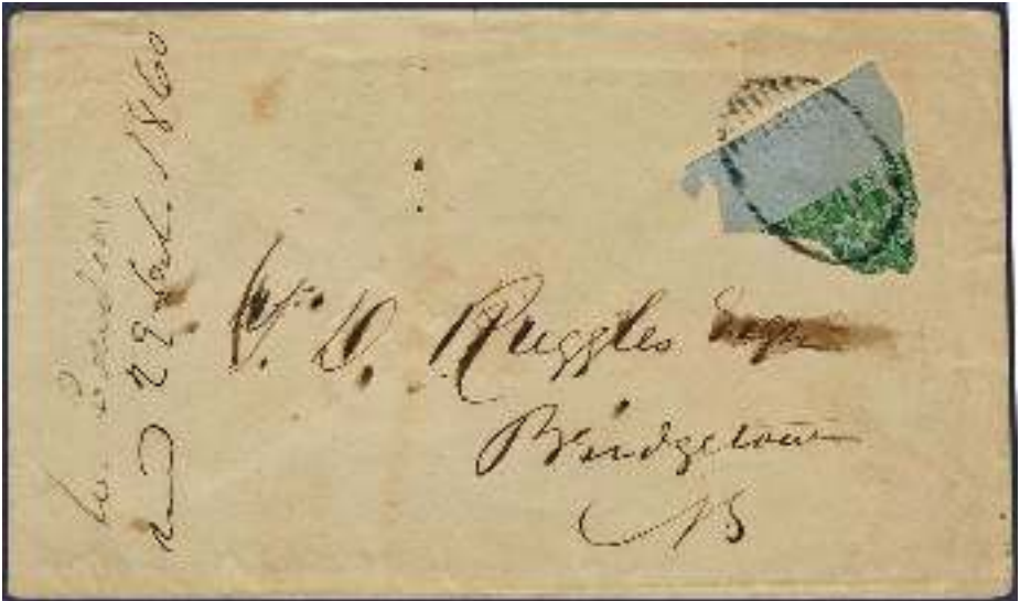
Kavel 148: Het 'Kwartje' van Nova Scotia.