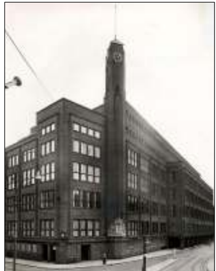
Hoofdkantoor Amsterdamsche Bank aan het Rembrandtplein 47, gebouwd 1926-1932.

Toeslag voor SPOED ½ cent, eenmalig. 39½ cent is afgerond op 40 cent.