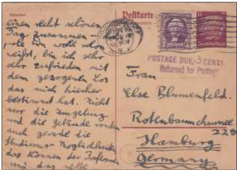
Providence, 20 oktober 1937. Antwoord-briefkaart met bestemming Hamburg. De kaart is in de USA ten onrechte naar de afzender teruggestuurd voor 3$ cents bijfranking. Deze fout komt bij antwoordkaarten regelmatig voor.

Deutsches Reich, antwoordgedeelte van briefkaart Hindenburg 15 Pf.