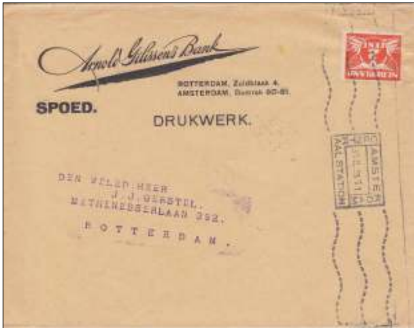
Amsterdam CS, 31 augustus 1928. Drukwerk enveloppe verzonden met SPOED, bestemming Rotterdam. Het woord SPOED is op de enveloppe gedrukt.