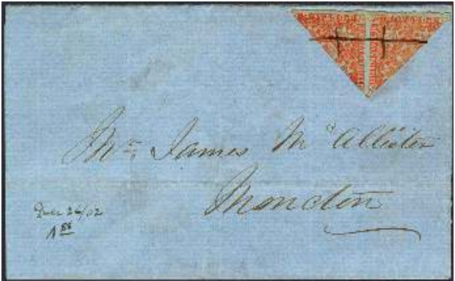
Kavel 98: Ook heel bijzonder: een gehalveerd paartje van een rode 3 d postzegel van New Brunswick uit 1860.