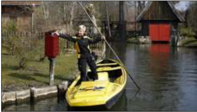
Postbezorging in het Duitse Spreewald, rijk aan riviertjes en kanaaltjes.