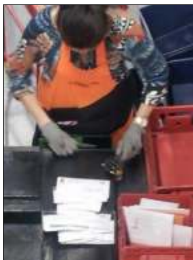
Het oude handwerk met rol- en hamerstempel blijft toch ook nog nodig.