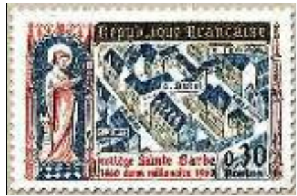
Afb. 5: Collège Sainte-Barbe.

In 1960 bestond het Collège Sainte-Barbe 500 jaar. De Franse posterijen gaven op 5 december ter herinnering een postzegel van 0,30 Franse franken uit, Yvertnummer 1280 (afb. 5). Deze zegel laat links de heilige Barbara zien en rechts vanuit vogelvluchtperspectief een oude versie van het Collège Sainte-Barbe. De straatnaam 'r. de Rains' op de zegel is de in dit artikel bedoelde Rue de Reims. Het 'C. Rains' op de postzegel is het vroegere Collège de Reims (gesticht in 1412). De straat 'Rue de Reims' is na 1880 bij ingrijpende verbouwingen opgeheven. De straatnaam duikt na die tijd elders in Parijs op.