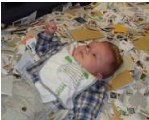
Basje, de jongste Teurlings telg, voelt zich al helemaal thuis tussen de postzegels.

Kortom: de Bossche Filafair smaakt naar meer!