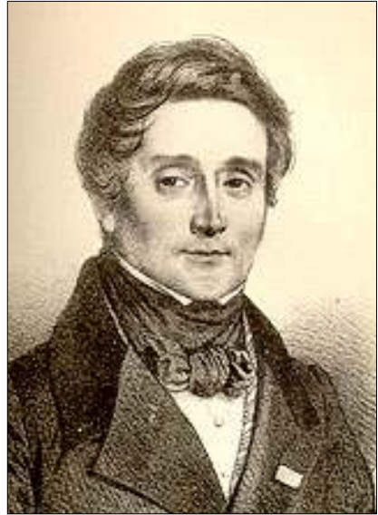
Afb. 4: Emile Deschamps

in Versailles. Bourges ligt slechts 70 km ten westen van Nevers! Deze Emile was een bekend Frans dichter en schrijver. Hij is een weliswaar een Deschamps met 'sch', maar verschrijvingen zijn van alle tijden. Vindt u deze Emile wat jong op 12 augustus 1811? De twintigjarige publiceert vier maanden later, op 1 januari 1812, bij de uitgeverij J. Gratiot in Parijs al zijn ode 'La Paix Conquise'.