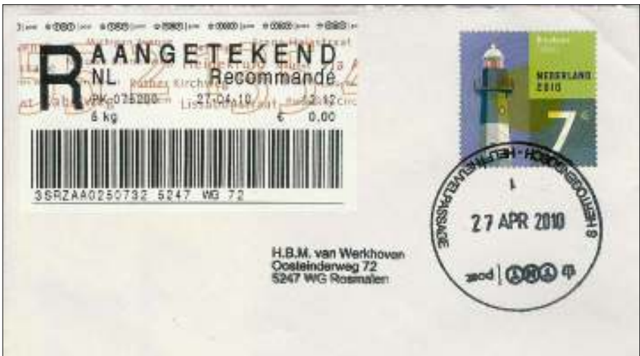
Afb. 2: De aangetekende brief met vuurtoren à € 7,- d. d. 27 apr. 2010.

Maar hoe nu verder? De beambte wist namelijk niet hoe in de tegenwoordige tijd een aangetekend stuk nog te frankeren met een postzegel. Dat moet nu immers altijd met zo'n computergestuurde plaksticker. Hij verzon na enig nadenken een oplossing: toch een plaksticker plakken, maar dan met een aangegeven frankeerwaarde van € 0,00 (afb. 2).