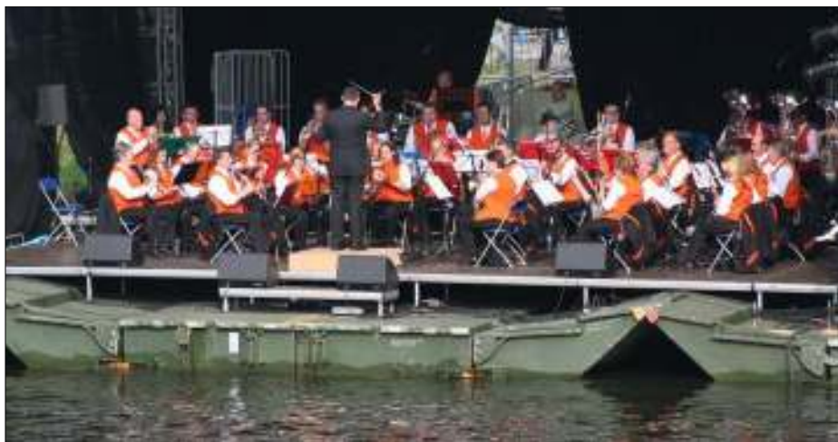
De Koninklijk Erkende TNT Harmonie tijdens Maritiem 's-Hertogenbosch 2009.

De Bossche harmonie telt ruim 60 leden en wil in ieder geval doorgaan. De uniformen en instrumenten hoeven ze niet in te leveren. Het gezelschap is daarom nu op zoek naar een nieuwe identiteit.