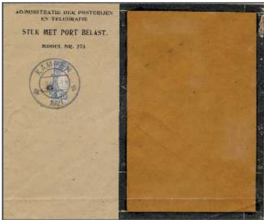
Afb. 2: De Kamper Noodport van drs. Klaassen.