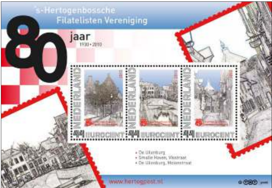
Een van de zes postzegelvelletjes van de 's-Hertogenbosche Filatelisten Vereniging.