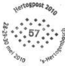
Puntstempel 57 van 's-Hertogenbosch

TNT Post is met een verkoopstand aanwezig met zowel nieuwe, als uitgiften van enige tijd geleden. Bovendien zijn er bijzondere poststempels. Uiteraard zijn de NVPH-handelaren aanwezig met een zeer gevarieerd aanbod. Ook zal de Deutsche Post AG Briefmarken nieuwe uitgiften aanbieden, net als een aantal andere buitenlandse standhouders. De grootste Nederlandse aanbieder van Ansichtkaarten en prentbriefkaarten zal er zijn. Ook andere gespecialiseerde verenigingen zijn aanwezig en iedere bezoeker kan hier vrijblijvende informatie krijgen. Tijdens de drie dagen verschijnen 21 velletjes met drie zegels. Elk velletje in een eenmalige, beperkte oplage, uitsluitend te koop op de stand van uw vereniging.