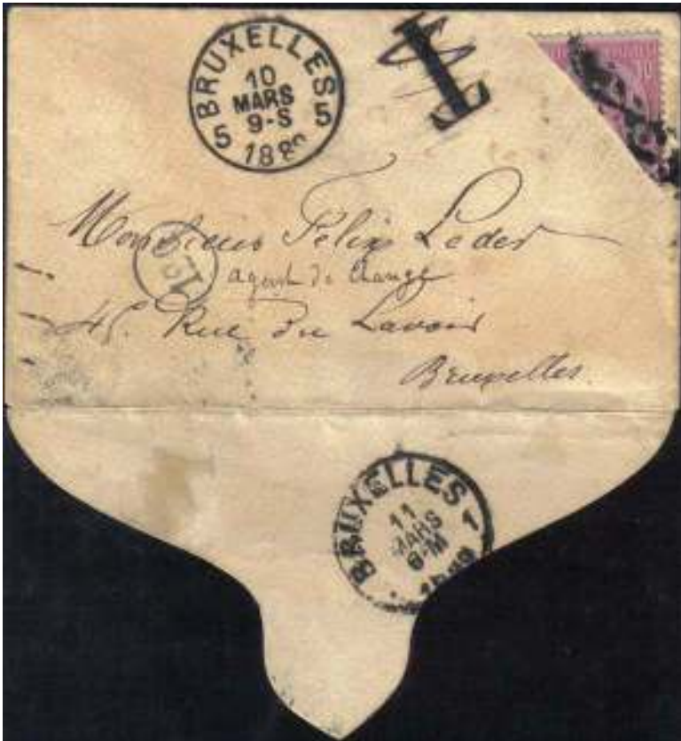
De kleine enveloppe voor het visitekaartje, Brussel 5, 10 maart 1889.