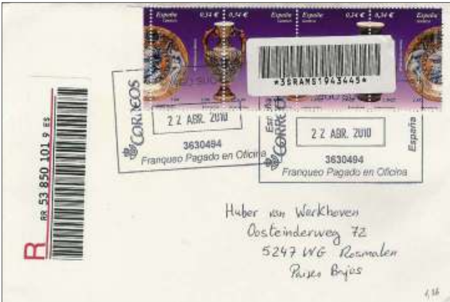
Afb. 3: De aangetekende brief uit Spanje d.d. 22 april, bezorgd op 27 april 2010.

Bij thuiskomst stond er juist een TNT-auto voor de deur. Een gekwalificeerde mevrouw (een gewone brievenbezorger mag zoiets niet meer) had toevallig juist een aangetekende brief voor mij, helemaal uit Spanje (afb. 3). Zowaar gefrankeerd met echte postzegels, hele mooie, en netjes afgestempeld. Kleurig Spaans porselein met een weelderige Spaanse schone er op. Bovendien in de vorm van een doorloper. En ik verzamel doorlopers! Je zou denken, deze dag kan niet meer stuk. Maar ook in Spanje weten ze wat een plaksticker is: drie van die mooie postzegels naar de Filistijnen. Mijn vrouw probeerde nog dat lelijke streepding er af te peuteren, maar zij wist nog niet dat de plakkracht daarvan veel groter is dan de geschonden gevoelswaarde van een verzamelaar van postzegels.