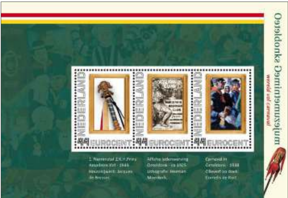
Een van de drie postzegelvelletjes van het Oeteldonks Gemintemuseum.