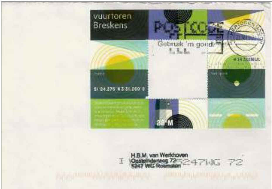
Afb. 4: Brief d.d. 27 april 2010 met velletje zonder postzegel.

Na al die consternatie was ik een beetje chagrijnig geworden. Ik wilde mijn gram halen. Dat leeggescheurde vuurtorenvelletje zat nog in mijn binnenzak. Misschien kinderachtig, maar ik wilde iets terugdoen. Ik plakte het velletje op een envelop en adresseerde ook die aan mezelf (afb. 4).