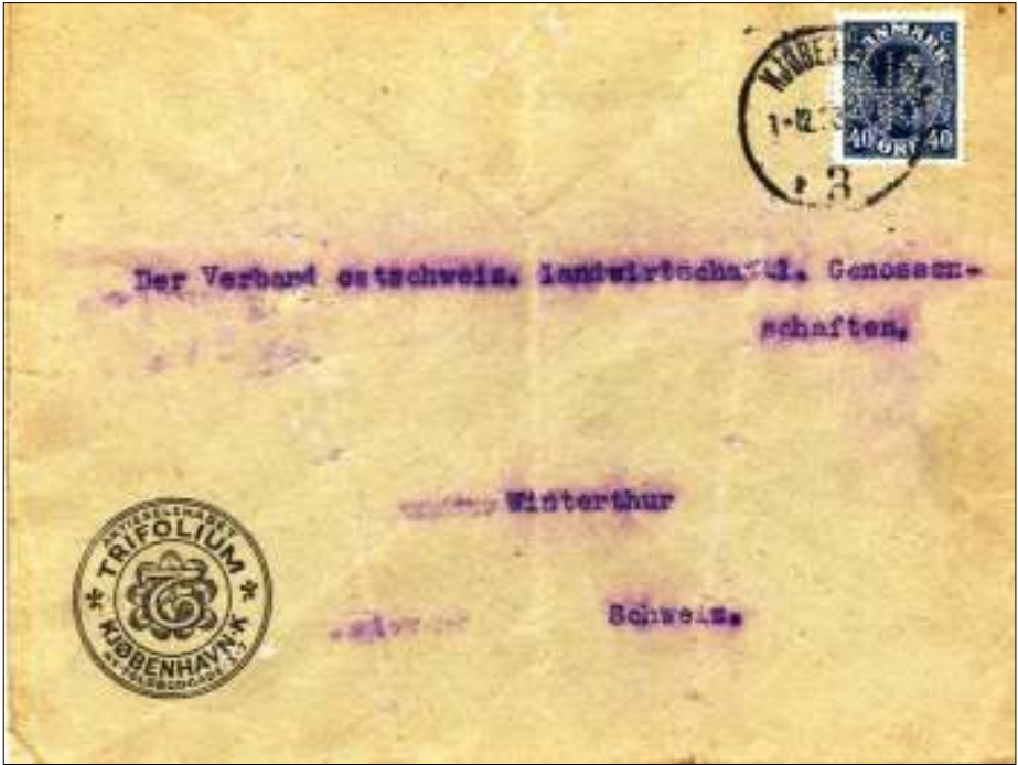
Afb. 4: Klaverplant als firmaperforatie