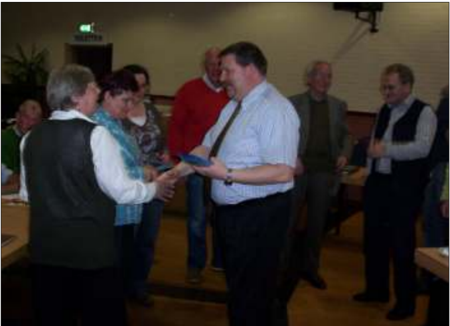
Vrijwilligers, hartelijk bedankt!