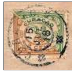
Afb. 2: Curaçao Hulpuitgifte 1918

‘Onze’ Nederlandse brief ging van Bathmen naar Colmschate. De afstemming is tamelijk moeilijk te lezen: 5 maart is duidelijk. Maar is het jaartal 90 of 96, 00 of misschien zelfs 06? De veilingcatalogus houdt het op 1890. Maar dan wordt het pas echt interessant. Het jaartal 1890 is hier namelijk niet mogelijk, want de emissie Prinses Wilhelmina hangend haar begon pas in 1891.