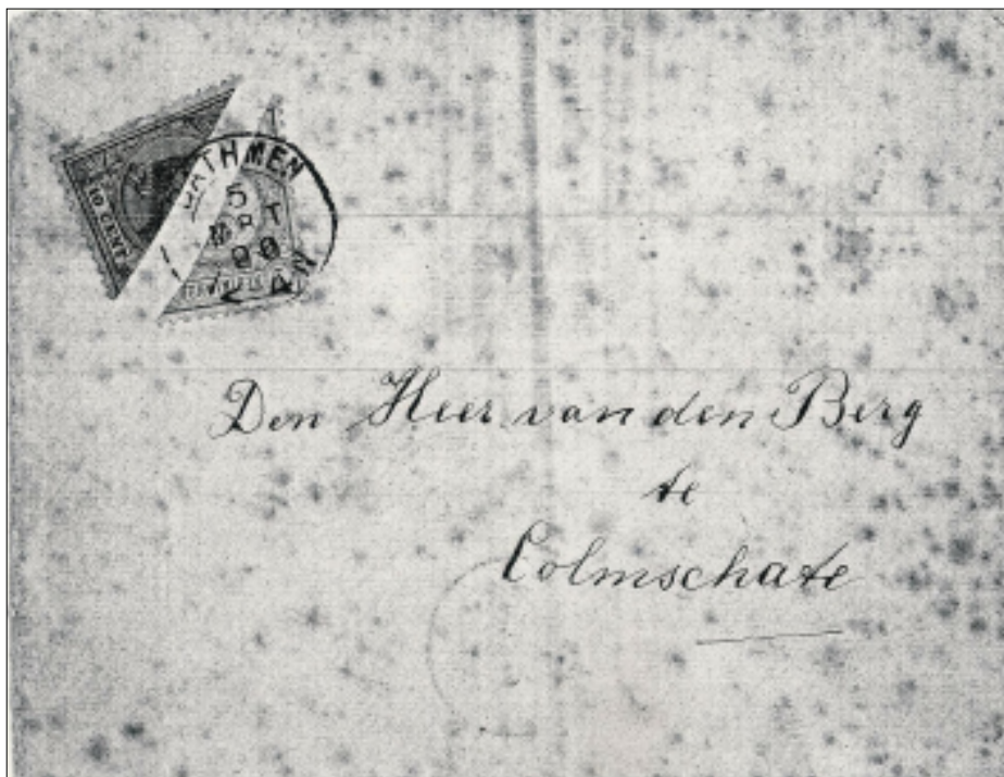
Afb. 1: Brief van Bathmen naar Colmschate

Halvering van zegels was namelijk alleen toegestaan, als de voorraad van een bepaalde waarde op een postkantoor was uitgeput en uitsluitend wanneer de verzending meteen vanuit het postloket plaatsvond. Dergelijke echt gelopen poststukken zijn daarom erg zeldzaam. Wat wel enige bekendheid kreeg is de z. g. Heumense halvering.