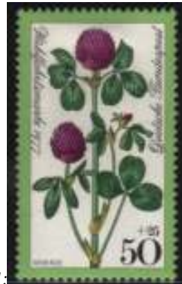
Afb. 1: Afb. 3: Klaverplant

dieren'. Dus vooral bij levende voorwerpen heb je deze kans om er meer van te maken. Zo kun je vele aspecten van een vogelsoort tonen, telkens weer op een andere zegel etc. afgebeeld. Een gewone reiger in de vlucht, tijdens daling, opstijgen, baltsgedrag, jacht op voedsel, nestelgedrag en nog veel meer.