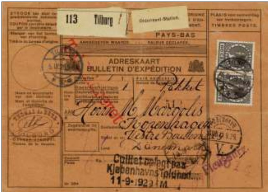
Tilburg, 5 september 1929. Pakketkaart naar Kopenhagen. Tarief: van 1.1.1926 tot 1.1.1935 1,20 gld. voor 3 tot 5 kg. Gewicht van het pakket 3,50 kg.