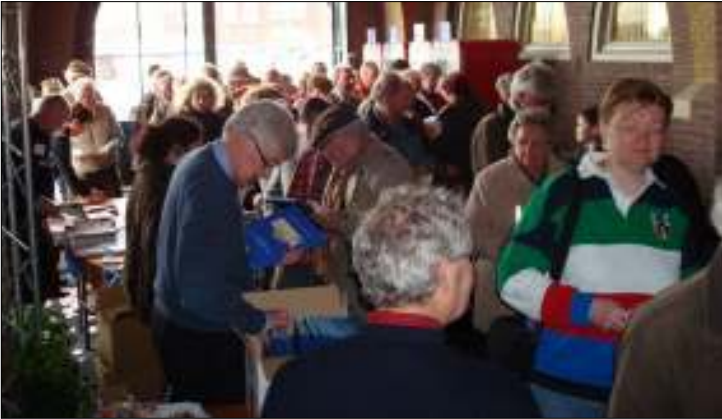
Zo ging het 'flyeren' in zijn werk voor het binnenstromende publiek