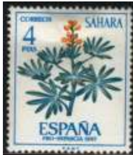
Afb. 2: Lupine