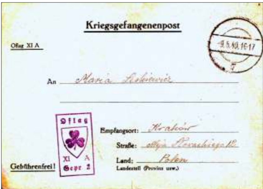
Afb. 5: Kampstempel met klaverblad