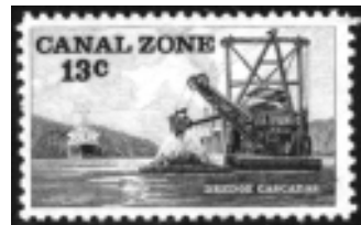
Afb. 17b: baggerschip in het Panamakanaal

Maar....inmiddels was de Eerste Wereldoorlog uitgebroken, waardoor er nauwelijks belangstelling was voor het prachtige waterbouwkundige werk. Het duurde tot 1920 voordat het kanaal eindelijk officieel werd geopend.