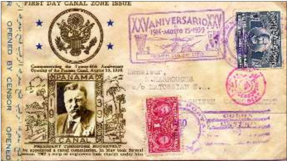
Afb. 11: president Roosevelt, stimulator aanleg Panamakanaal (FDC met Egyptische censor sluitstrook en censor stempel van Colon naar Cairo, 15-8-1939)