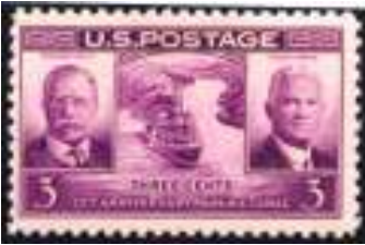
Afb. 14: postzegel met links president Roosevelt, rechts George Washington Goethals en in het midden de "Andrea F. Luckenbach" in de Gaillard-geul.

iemand die geen ontslag kon nemen: een genieofficier van het Amerikaanse leger. De keus viel op George Washington Goethals, die op zijn post bleef tot de opening van het kanaal in 1914 (afb. 14).