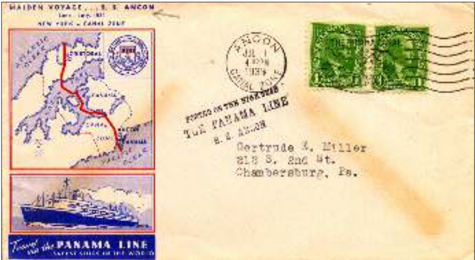
Afb. 16: Scheepspost van de stoomboot Ancon posted on the high seas.

economisch belangrijke verbinding zou hierdoor benut kunnen worden. Er werd een groots feest voorbereid voor de officiële opening van het kanaal. Door de gebeurtenissen in Europa werd de opzet wat anders. De stoomboot “Ancon” maakte de eerste officiële tocht door het kanaal (afb. 16).