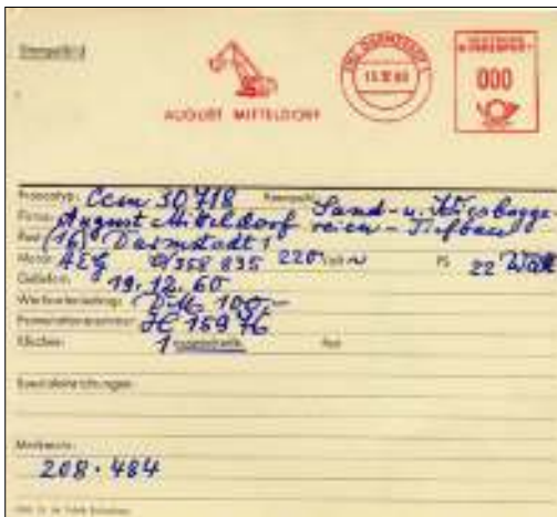
Afb. 17a: Staalkaart frankeerstempel Duitse aannemer van groot grondverzet.

Door aardverschuivingen werd het kanaal weer opgevuld, zodat sinds 1914 de baggerschepen onafgebroken in bedrijf zijn (afb. 17).