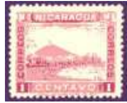
Afb. 12: de postzegel met de rokende vulkaan

Tijdens het doorkijken van enkele postzegelverzamelingen in Washington deed hij een opzienbarende ontdekking: een Nicaraguaanse postzegel met de afbeelding van een onheilspellend rokende vulkaan aan de oever van de Rio San Juan (afb. 12). Hij verzamelde tachtig van deze “vulkaanzegels”, die hij ieder apart op een wit vel plakte, met als onderschrift: “Een officiële getuige van vulkanische activiteit op de landengte van Nicaragua”.