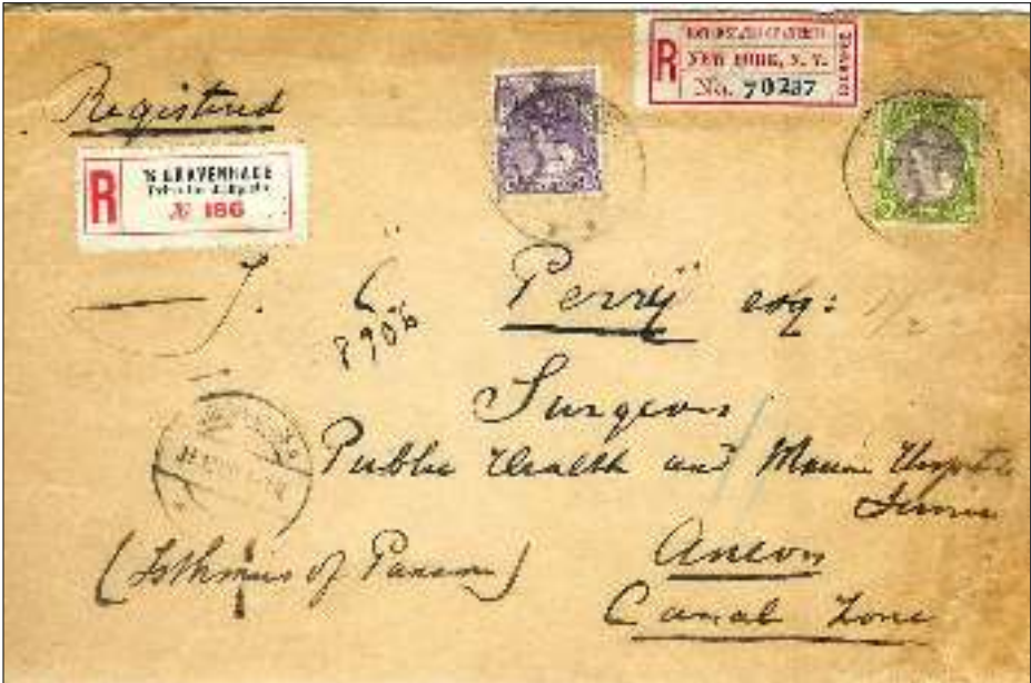
Afb. 1: voorzijde van de brief