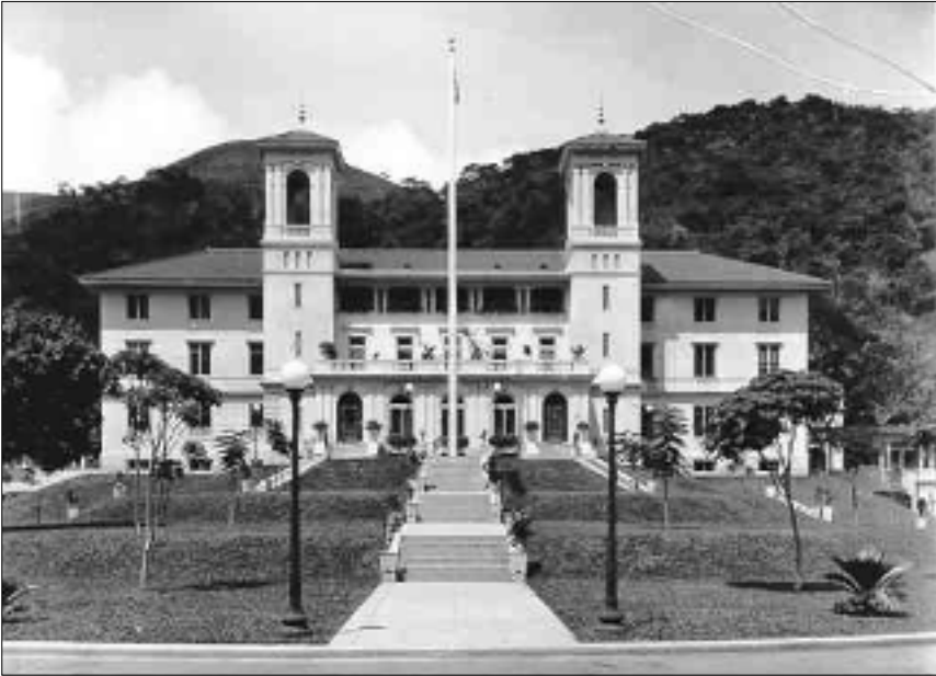
Afb. 4: Ancon Hospital in 1920

In 1915 werd het ziekenhuis opnieuw gebouwd in baksteen (afb. 4). In 1928 kreeg het de naam Gorgas Hospital naar de Generaal en Geneesheer van het Amerikaanse leger William C. Gorgas, welke naam het tot op de dag van vandaag nog heeft.