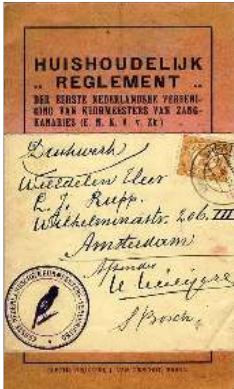
Afb. 6 Als drukwerk verzonden huishoudelijk reglement van de E.N.K.V v. Zk. !