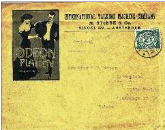
Afb. 7 Drukwerk naar het buitenland 2,5cts op geïllustreerde envelop VEEL PLEZIER MET UW EIGEN POSTSTUKKEN ONTDEKKINGSREIS!