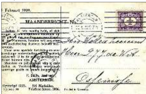
Afb. 2 Mooi 'maandbericht' dat de Fa. Sluis regelmatig verzond aan alle (potentiële) klanten, ook voor nieuwsbladen tarief