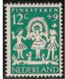
Afb. 1 NVPH 762

Pinksterbruid, wat schone ruit, Wie heeft ons dat gegeven? Dat heeft een rijke heer gedaan, Die heeft ons dat gegeven. Pinkstr'en komt maar eenmaal in 't jaar, Nu moet ge ons all'maal wat geven.