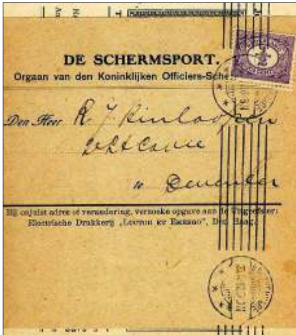
Afb. 1 'De Schermsport' als drukwerk verzonden voor nieuwsbladen tarief van 1/2 cent

Als opzette hierbij enkele (naar mijn idee) aardige poststukken gefrankeerd met de cijfer emissie 1899-1913.