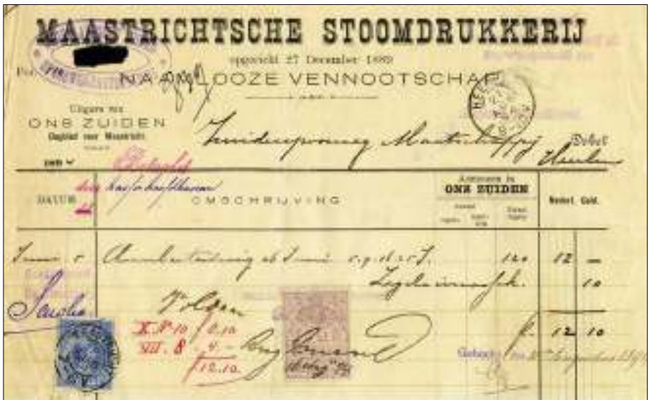
Afb. 2 Kwitantie uit 1894 voor een bedrag van Hfl. 12,10 met een postzegel van 5 cts en een belastingzegel van 5 cts. Beide werden wel in rekening gebracht.