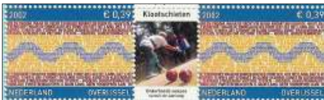
Afb. 4 Provincievelletje van Overijssel met op tab het Klootschieten

Sinds kort is er ook een afbeelding van het 'klootscheeten', waarmee de Twentse mannen zich in de zomertijd weten te vermaken (afb. 4).