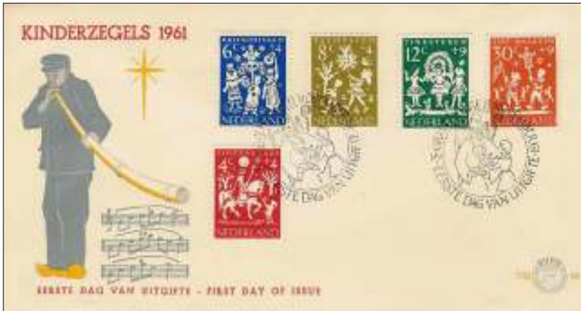
Afb. 3 FDC nr. 49. Links een midwinterhoornblazer en drie van zijn melodietjes

Van de andere Twentse tradities heeft degene die uniek is voor Ootmarsum helaas nog geen filatelistisch spoor getrokken. Ik doel op het fameuze 'vlögelen', de processie door het stadje van de acht z.g. Paoskearls, die te herkennen zijn aan hun lichte regenjas en slappe hoed. Wèl terug te vinden is het midwinterhoorn blazen in de adventstijd: een oud, Germaans gebruik om de boze geesten te verdrijven (afb. 3).