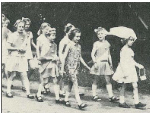
Afb. 2 De Pinksterbruid en haar gevolg