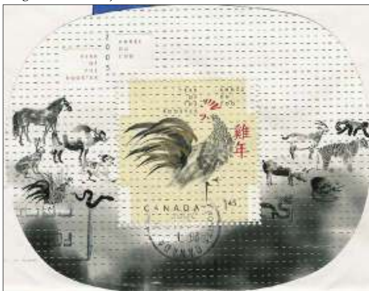
afb.1 Canadees blokje ter gelegenheid van het Jaar van de Haan

In de Chinese traditie wordt de haan bewonderd als een moedig dier, een weldoener en hij staat symbool voor betrouwbaarheid, omdat hij nooit in gebreke blijft het aanbreken van een nieuwe dag al kraaiend aan te kondigen. Wie geboren is in een Jaar van de Haan ziet er gewoonlijk goed uit, is slim en nauwgezet. Maar hij of zij kan ook ongevoelig zijn en zal niet gauw zijn/haar ongelijk toegeven. Vaak zijn het uitstekende acteurs.