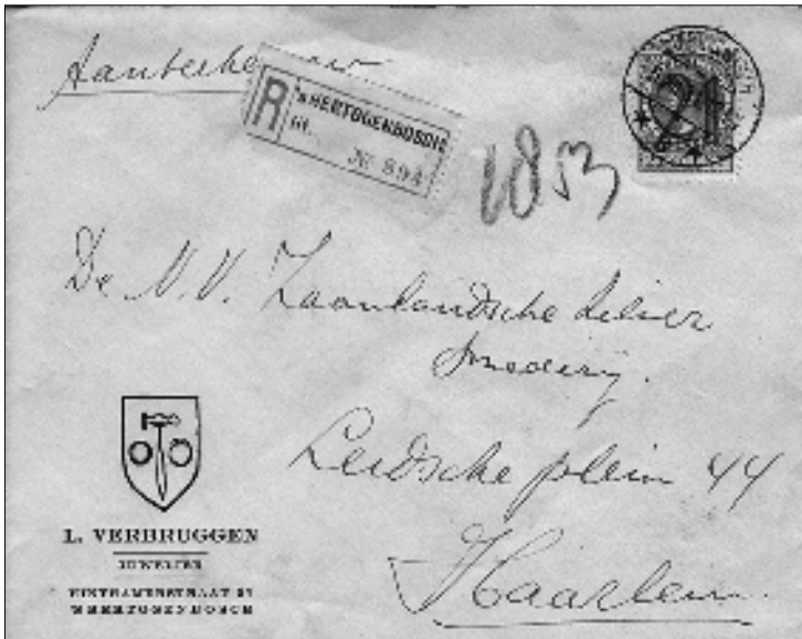
afb. 5 Aangetekende brief van 's-Hertogenbosch naar Haarlem d.d. 5.12.1931. Tarief: brief 6 cts, aantekenrecht 15 cts. NVPH 224: hulpzegel; opdruk 21 op 22½ cts .