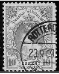
afb. 2 NVPH 80