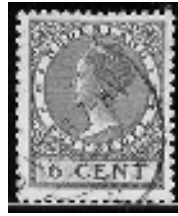
afb. 4 Veth 6 cts

catalogus-waarde zijn uiteraard de meeste zegels, al dan niet afgeweekt, in albums verdwenen