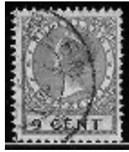
afb. 3 Veth 9 cts