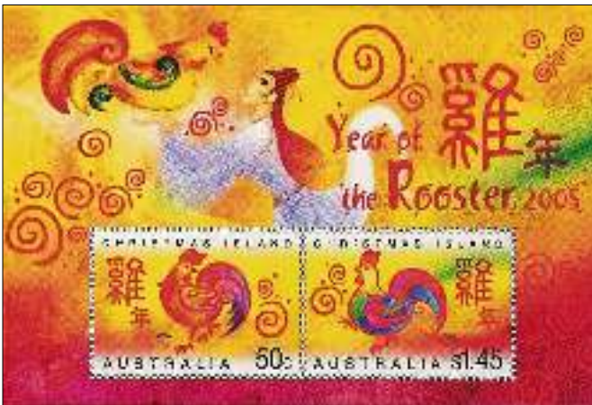
afb. 2 Australisch blokje t.g.v. het Jaar van de Haan

Thuis kregen de kinderen als altijd rode envelopjes met geld toegestopt. Die rode envelopjes moesten geluk en voorspoed brengen in het nieuwe jaar.