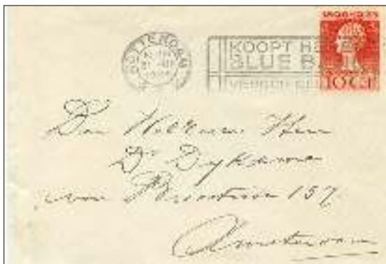
Briefomslag met een afdruk van het niet-continuerend Blue Band stempel op de eerste dag van gebruik