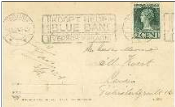
Briefkaart met een afdruk van een continuerend Blue Band Stempel