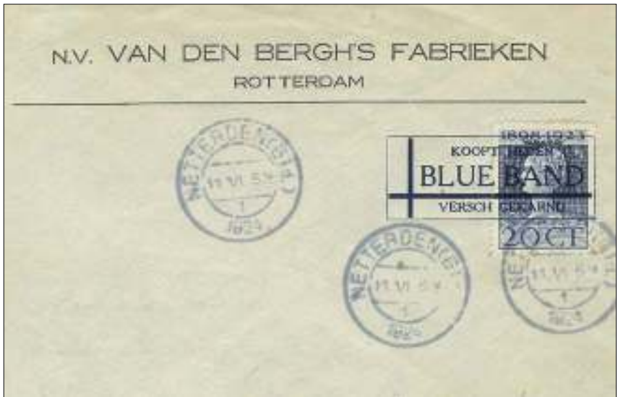
Briefomslag van NV Van Den Bergh's Fabrieken met een niet gekozen proefstempel

Type 2: continuerende stempels van Krag stempelmachines uit Breda, Groningen, Nijmegen en Zwolle.