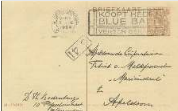
Briefkaart met een niet continuerend stempel gericht aan de "Apeldoornsche Coöperatieve Fabrick van Melkproducten". Het staat buiten kijf dat deze geadresseerde NIET gelukkig was met een reclame voor "Kunstboter" op haat-correspondentie!!