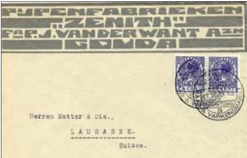
Gouda, 1 juni 1928. Brief met bestemming Lausanne, Zwitserland. Tarief: tot 20 gram 15 cent. Reclamehandstempel voor de kaas- en varkensmarkt te Gouda.