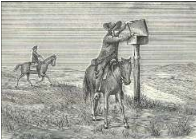
Brievenbus in de woestijn van Utah.