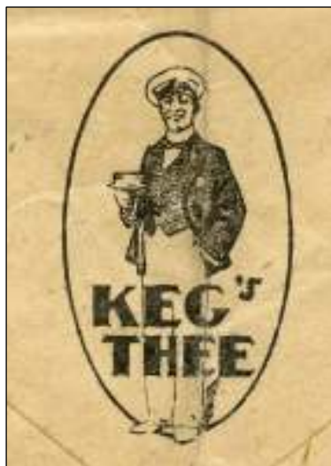
Logo op de achterzijde.

Zaandam, 17 april 1929. Aangetekende brief met bestemming Amsterdam. Tarief: Brief tot 20 gram 7\frac{1}{2} cent, aantekenrecht 15 cent. De frankering van 22\frac{1}{2} cent is voldaan met drie 'poko-zegels' van 7\frac{1}{2} cent, voorzien van de firmaperforatie C K.