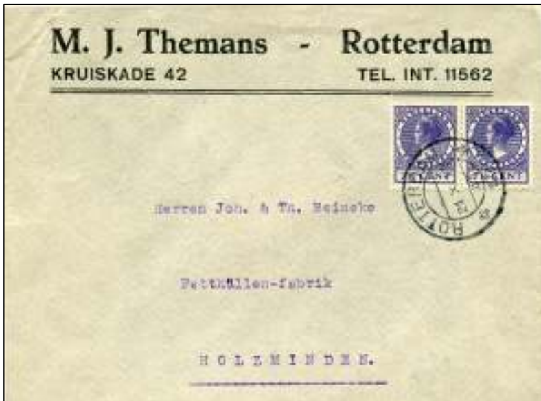
Rotterdam, 21 oktober 1928. Brief met bestemming Holzminden, Duitsland. Tarief: brief tot 20 gram 15 cent.