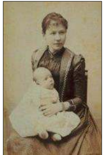
Jo van Gogh-Bonger en Vincent in 1890

Vincent van Gogh hield de kunstverzameling, die hij na de dood van zijn moeder in 1925 had geërfd, bij elkaar en leende schilderijen van Vincent van Gogh uit aan verschillende musea. Vanaf eind jaren dertig ging hij zich steeds meer bezighouden met de kunstverzameling en het promoten van Vincent van Goghs werk. In 1960 richtte hij de Vincent van Gogh Stichting op met als doel