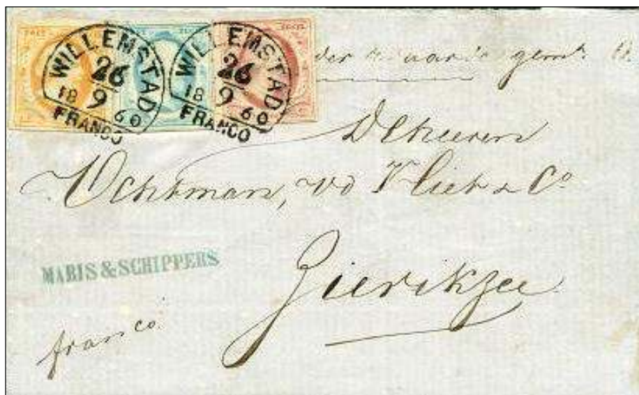
Prachtige zgn. tricolore brief die onlangs te koop was bij Van Dieten Postzegelverilingen.