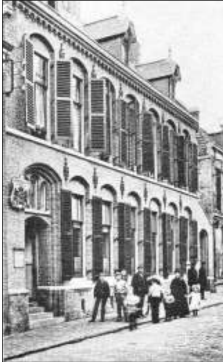
Postkantoor Kanaalstraat te IJmuiden in goede tijden.

Het begon bij het lezen van een kort verhaal in het blad van de Landelijke Vereniging van Aantekenstrookjesverzamelaars. Dat ging over een postkantoor in IJmuiden, het kantoor in de Kanaalstraat. Het gebouw verrees in 1908 op de plaats van het vroegere postkantoor, dat te klein was geworden in het snelgroeïende en rijke IJmuiden. Stad immers van het Noorzeekanaal, de zeesluizen, havens en visafslag.