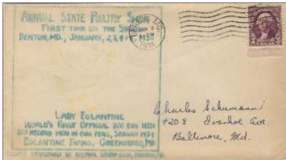
Afb. 1: Briefomslag naar Denton voor de jaarlijkse pluimveetentoonstelling 1934 in de staat Maryland USA.

Een briefomslag uit de Verenigde Staten van Amerika, het land van onbegrensde mogelijkheden, uit Denton in de staat Maryland (afb. 1). Op het eerste oog is er niets grappigs of vreemds aan de omslag te zien. Het is een uitnodiging voor de jaarlijkse pluimveetentoonstelling. Kennen wij Hollanders ook. Beter kijken levert links een vaalgroen en grotendeels leesbaar reclame-stempel op, met in het midden een lichtgeel silhouet van een kip. Dit is een beetje bijzonder. Wat de omslag interessant maakt is de tekst over een wereldrecord. Een kip met de aristocratische naam 'Lady Eglantine' is de eerste leghen die in het seizoen 1934 het officiële wereldrecord eieren leggen op 310 stuks zou hebben gebracht, aldus de omslag. De lady zou in 1934 op de kippenboerderij 'Eglantine' in Greensboro hebben gehokt, 10 km noord van Denton.