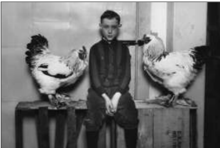
Afb. 2: Jongen met twee White Leghorn-hennen – kleurslagvariant – op de Eglantine boerderij in Greensboro nabij Denton.