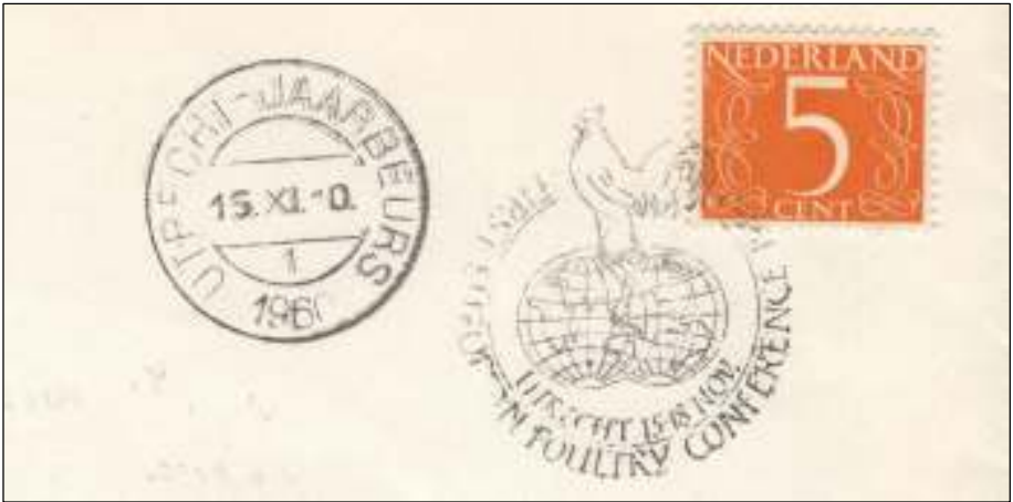
Afb 5: Briefstukje FIRST EUROPEAN POULTRY CONFERENCE 1960 - UTRECHT 15-18 NOV.

Bijna een halve eeuw na Lady Eglantine is pluimvee wereldwijd georganiseerd, getuige het gelegenheidsstempel van de eerste Europese Pluimvee Conferentie in Utrecht van 15 tot en met 18 november 1960 (afb. 5). Een haan staat fier op twee aardbolhelften. Het stuk is gefrankeerd met een Van Krimpen-cijferzegel uit 1953, de geeloranje vijf cent.