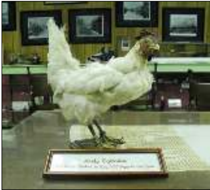
Afb. 4: De opgezette Lady Eglantine staat in het gebouw van de Greensboro Historical Society.

Wat wilt u nog meer weten? Een gemiddelde kip kan 'in vrijheid' tien, twaalf jaar oud worden. De lichaamstemperatuur van de kip is 40°C, drie graden warmer dan de mens. Daarom vinden veel kinderen kippenknuffelen zo heerlijk.