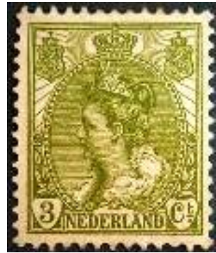
Afb. 4: De gewraakte olijfgroene Bontkraagzegel van 3 cent. Hier afgebeeld met de gebruikelijke kamtanding 12½.

In een ingelaste voetnoot onderaan dezelfde pagina schreef hoofdredacteur J.B. Robert dat Bohlmeijer hem op het laatste moment waarschuwde, dat hij had vernomen dat de bewuste tanding vals was. Robert vervolgt: 'Ik dank hartelijk voor dit bericht, daar men onbemerkt erin loopt. Mij deden de opvallende tanden twijfelen. Op den Philatelistendag werd ik [...] in mijn twijfel gesterkt. Nogmaals dank aan onzen Bohlmeijer.'