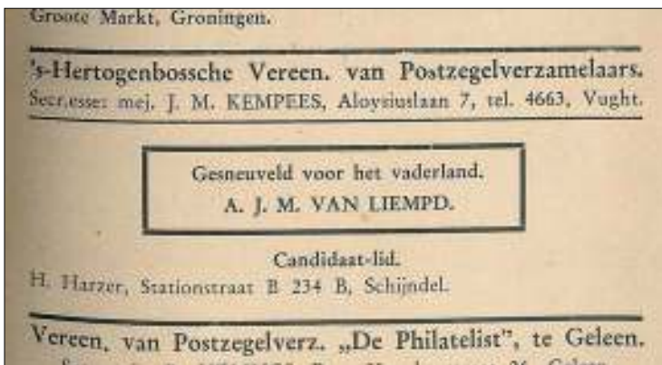
Afb. 1: Mededeling in het Ned. Maandblad voor Philatelie d.d. 16 augustus 1940.

Het in 2008 verschenen boek ‘Wegens bijzondere omstandigheden...’ bevat een lijst van alle in de Tweede Wereldoorlog omgekomen Bosschenaren. Het jaarboekje van onze vereniging over 1940 bevat een ledenlijst. Maar tussen die twee lijsten was geen overeenkomst te vinden. Kennelijk was de gesneuvelde geen Bosschenaar. Waar dan te zoeken? Misschien in het maandblad voor Philatelie? Dat bevatte in die jaren immers verslagen van de vergaderingen van aangesloten verenigingen. Dat bleek een rake gedachte. In het nummer van 16 augustus 1940 stond onder de ‘s-Hertogenbossche Vereeniging van Postzegelverzamelaars ditmaal geen verslag. Maar wel een zwart omrand kader met de mededeling: ‘Gesneuveld voor het vaderland. A.J.M. van Liempd’ (afb. 1).