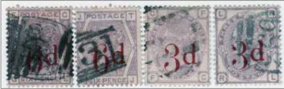
Opdruk op zegels voor bedrijven om diefstal tegen te gaan.

Deze opdrukken moeten niet verward worden met commerciële opdrukken voor accijnsdoeleinden.