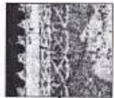
Afb. 3: plaatnr. 100