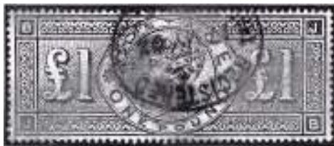
Afb. 5: de MOOISTE: 'One Pound' uit 1891

Op de valreep geeft hij nog twee gratis adviezen: 'Vanaf het punt waar de NVPH-catalogus niet meer het onderscheid aangeeft tussen zegels met en zonder plakker, zeg maar vanaf 1940, kun je het beste wèl postfris verzamelen.' En: 'Houd binnen één serie gestempeld en ongestempeld uit elkaar. Want mocht je ooit willen verkopen, zul je merken dat je ze anders aan de straatstenen niet kwijt kunt.'