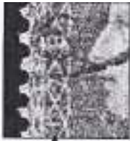
Afb. 2: plaatnr. 178