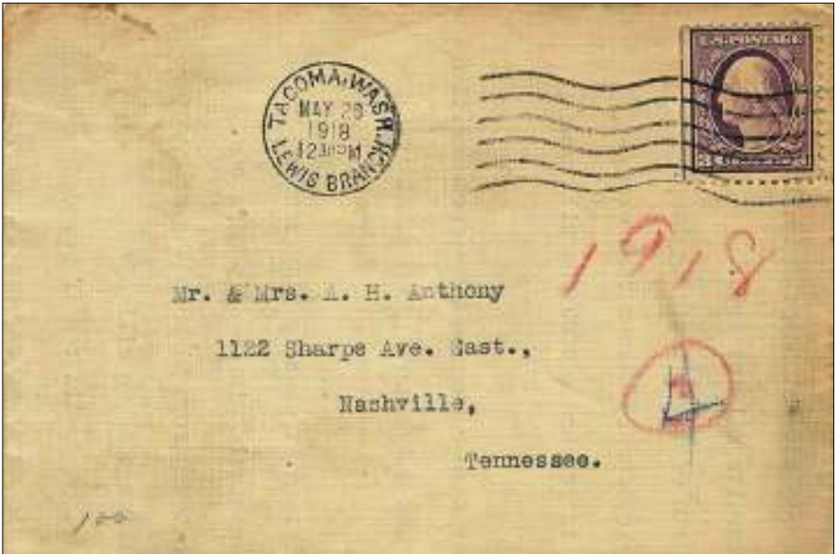
Afb. 5 Brief verzonden op 28 mei 1918 en gefrankeerd met een zegel die aan de linkerkant is afgesneden en een snijlijn vertoont.