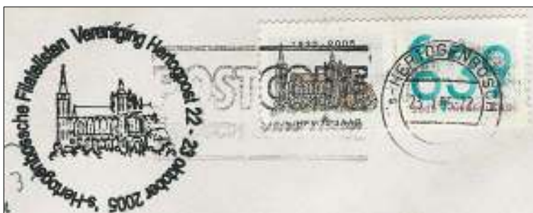
Afb. 3 Gelegenheidsstempel en 'persoonlijke' postzegel t.g.v. het 75 jarig jubileum van de 's-Hertogenbosse Filatelisten Vereniging

Op het stempel en de postzegel-tab t.g.v. het jubileum van de vereniging in 2005: de zuidzijde Sint Jan zoals te zien vanaf de Parade (afb. 3). H.v.W.