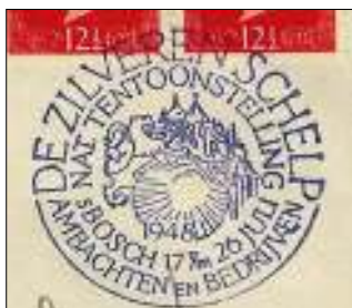
Afb. 1 De Zilveren Schelp

In het Jubileumboek van onze vereniging is een artikel opgenomen dat een aantal filatelistische afbeeldingen toont en beschrijft van de Sint Jan. Het zal geen verbazing wekken dat dit overzicht niet uitputtend was, omdat de Sint Jan van 's-Hertogenbosch nu eenmaal geldt als het fraaiste kerkgebouw van Nederland. Vandaar deze aanvulling. Wellicht bestaan er nog meer filatelistische afbeeldingen: dan houden wij ons aanbevolen.