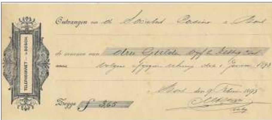
Afb. 4 Kwitantie van het Telefoonnet 's-Hertogenbosch uit 1893