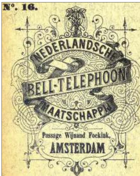
Afb. 2 Advertentie van de Nederlandsche Bell-Telefoon Maatschappij

Op 15 februari 1881 werd de eerste 'Bell'-centrale in Nederland geopend in Amsterdam (afb. 2) met 49 abonnees. Dat aantal nam snel toe evenals het aantal aangesloten plaatsen (afb. 3).