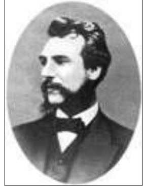
Afb. 1 Alexander Graham Bell

Alexander Graham Bell is dan ook officieel de uitvinder van de ‘dynamische telefoon’.