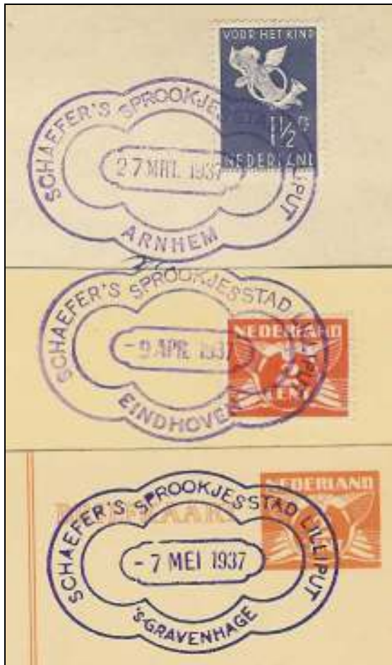
Afb. 5: stempels Arnhem, Eindhoven en Den Haag 1937

Diezelfde brievenbus werd in de andere plaatsen gebruikt. En aan poststukken met afdrukken uit Arnhem, Eindhoven en Den Haag is te zien dat stempelverzamelaars de weg naar de Sprookjesstad wisten te vinden.