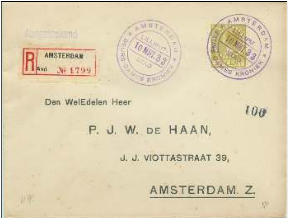
Afb. 2: het stempel op een aangetekende brief uit 1933

In het Nederlandsch Maandblad voor Philatelie van april 1933 lezen we: Van 3 t.m. 13 maart 1933 was een bijzondere stempel in gebruik voor correspondentie gepost in de z.g. Lilliputstad op de Beurs van het tijdschrift "Dameskroniek", gehouden in het R.A.I.-gebouw in Amsterdam-Z. Een der dwergen stempelde onder toezicht van een postambtenaar met een dubbelringstempel met omschrift * AMSTERDAM * BEURS DAMESKRONIEK, in den verkorten balk de datum, b.v. 7 MART. 33, in het bovenste segment LILLIPUT- en in het onderste STAD, kleur violet.