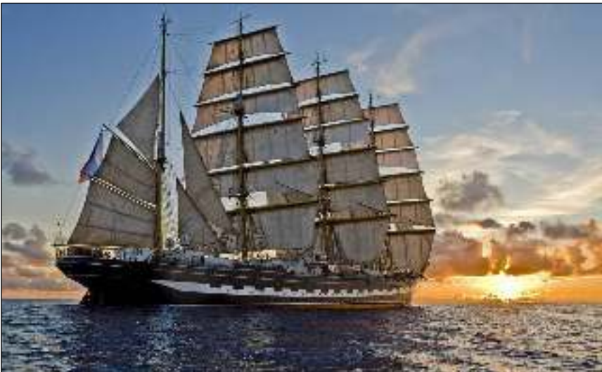
Afb. 5: De Kruzenshtern tijdens de Windjammerparade , Kieler Woche 2014.

Een voorbeeld van een deelnemer aan de Windjammerparade is het 114 meter lange, historische zeilschip Kruzenshtern . In afbeelding 5 ziet u deze bekende viermastbark op de parade van 2014. Na de Sedov is zij het grootste nog varende traditionele zeilschip.