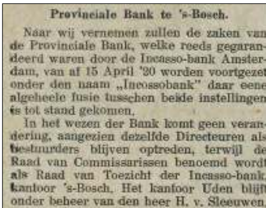
Afb. 6: Bericht in de Graafsche Courant d. d. 31 maart 1920.