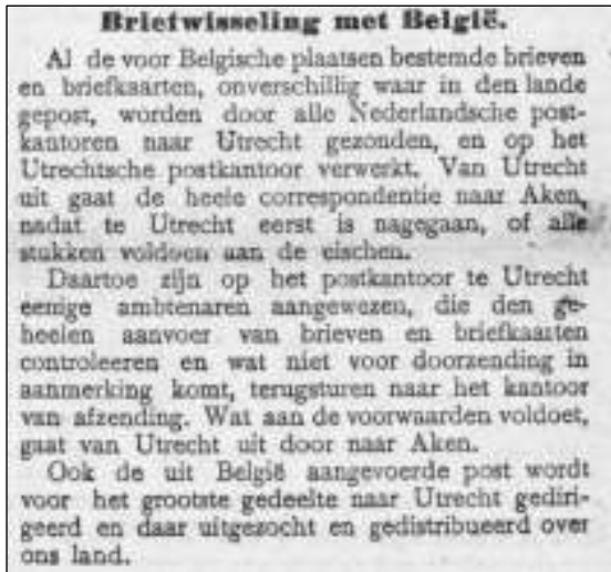
Afb. 2: februari 1915 Mededeling over de post naar België.

Reeds in februari 1915 was er in de kranten aangekondigd dat brieven en briefkaarten met bestemming België via Utrecht zouden gaan. (Fig.2)