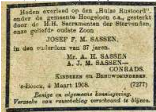
Afb. 5: Overlijdensadvertentie van Josef F.M. Sassen, 4 maart 1908.

De overlijdensadvertentie van Jos. Sassen laat zien dat hij was opgenomen in een rustoord, waarschijnlijk na een langdurige periode van ziekte (afb. 5).