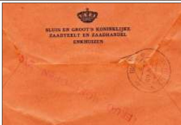
Afb. 1: 28 mei 1918, Enkhuizen naar Luik (België).