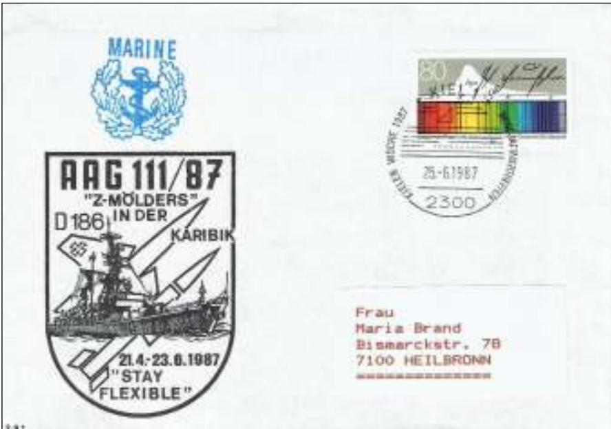
Afb. 1: De briefomslag met vijf maritieme kenmerken.

In eerste oogopslag lijkt de Duitse briefomslag van afbeelding 1 niet interessant. Het is maakwerkje nummer 291, een herinnering aan de NAVO-missie van een fregat in de Caraïbische Zee. De omslag staat vol maritieme kenmerken. Vijf! En elk van deze kenmerken heeft te maken met de Duitse maritieme historie. Variërend van een beladen verleden tot een sportief, jaarlijks terugkerend watersportevenement op wereldniveau.