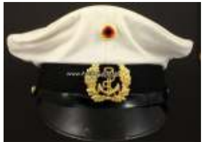
Afb. 4: Pet Duitse marine met het pet-embleem.

Linksboven op de briefomslag staat in blauwe inkt een ietwat armetierig MARINE -logo als derde kenmerk. Het is een voorstelling van het embleem dat ook in 1987 op de Duitse marinepet wordt gedragen. Zie afbeelding 4. Tussen 1956 en 1990 heet de Duitse marine officieel Marine der Bundesrepublik Deutschland , kortweg Bundesmarine .