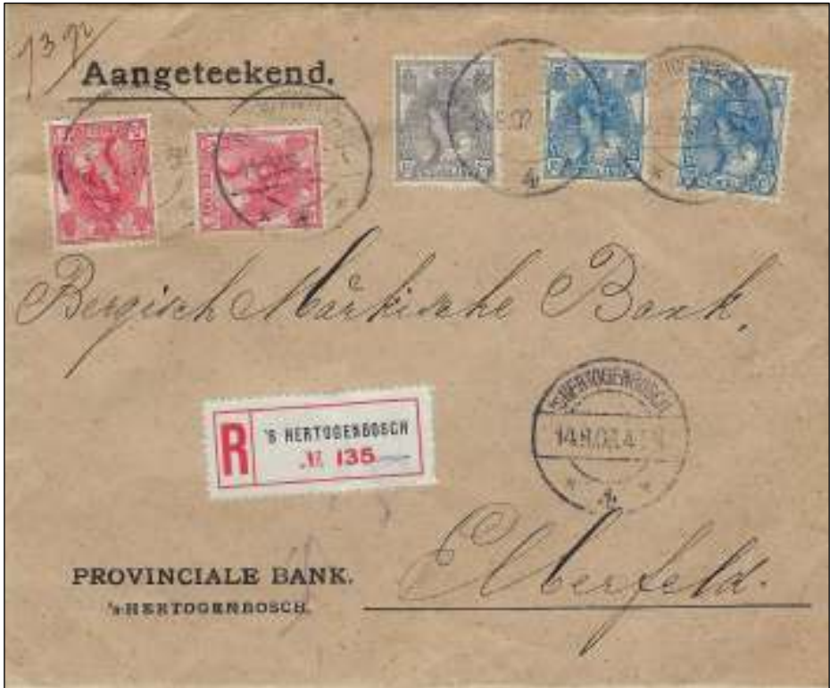
Afb. 1: Aangetekende brief d. d. 14.8.1909 van de Provinciale Bank naar het Duitse Elberfeld, fraai en correct gefrankeerd: 4 e gewicht (73 gr.) 35 ct + 10 ct aantekenrecht.

Nadat firmabrieven van de Hanzebank en van de 's-Hertogenbossche Bank aanleiding hebben gegeven tot tamelijk smeuijge verhalen in de Hertogpost over deze indertijd in 's-Hertogenbosch gevestigde instellingen, dook onlangs een fraaie brief op van een bank waarvan ik eveneens niet eerder het bestaan had vermoed: de Provinciale Bank (afb. 1).