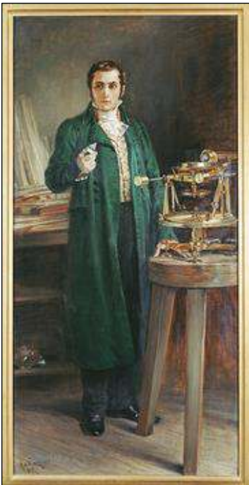
Afb. 6: Joseph von Fraunhofer.

Fraunhofer wordt lid van de Bayerische Akademie der Wissenschaften. Wordt in 1924 – op 37-jarige leeftijd! – tot Ritter des Verdienstordens der Bayerischen Krone geslagen en krijgt hierdoor een adellijke titel. Hij mag zich voortaan ‘Von Fraunhofer’ noemen. In 1825 wordt longtuberculose bij hem ontdekt. Het jaar daarop sterft hij, 39 jaar jong. Hij krijgt een staatsbegrafenis en wordt bijgezet op het Südfriedhof te München.