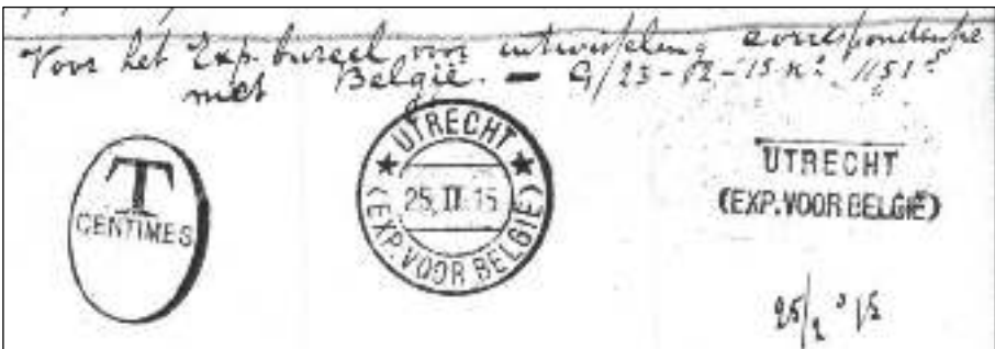
Afb. 3: UTRECHT (EXP. VOOR BELGIË), 25 februari 1915.

Het Expeditie'bureel' in Utrecht ontving in februari 1915 twee stempels van de Munt, een typenraderstempel en een langstempel. Beide met de tekst UTRECHT (EXP. VOOR BELGIË). Ze waren bestemd voor 'uitwisseling correspondentie met België' (afb. 3).