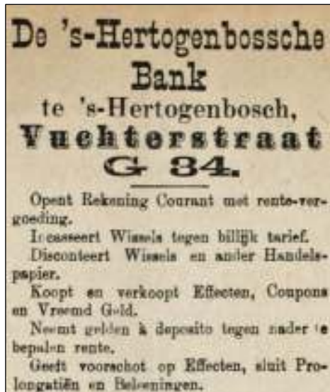
Afb. 3: Krantenadovertentie d. d. 16 februari 1901.

De volgende stap in deze affaire was dat op 31 december 1907 een Buitengewone Algemeene Vergadering werd belegd met twee 'punten van behandeling':