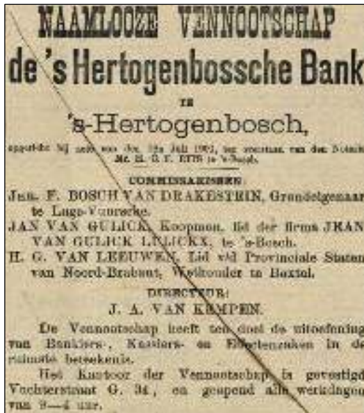
Afb. 2: Krantenadvertentie d. d. 27 juli 1900.

firma Joh. F. van Rijckevorsel & Zonen om. En trouwe lezers van de Hertogpost herinneren zich vast nog het schandelijke faillissement van de Hanzebank in 1923. Maar van De 's-Hertogenbossche Bank is in het standaardwerk Bankieren in Brabant in de loop der eeuwen (1987, red. Van den Eerenbeemt) zelfs de naam niet te vinden.