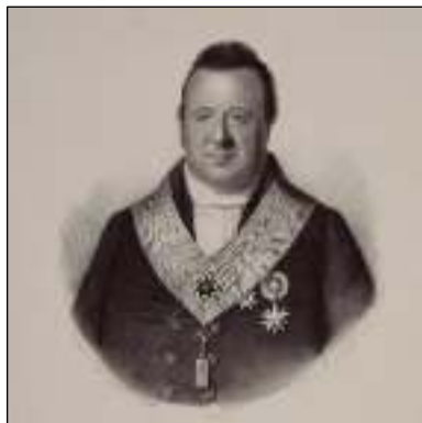
Afb. 1: Borstbeeld van Jan Schouten op gevorderde leeftijd, omhangen met maçonnieke waardigheidstekens.