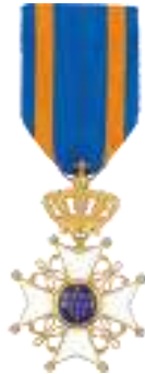
Afb. 3: Onderscheiding van een Ridder in de Orde van de Nederlandse Leeuw.

Moet de onderscheiding na de dood van de gedecoreerde worden teruggestuurd? Nee, want de familie mag de versierselen in deze tijd houden als een borg van 2.093€ (1 e ), 1.654€ (2 e ) dan wel 240€ (3 e ) is betaald.