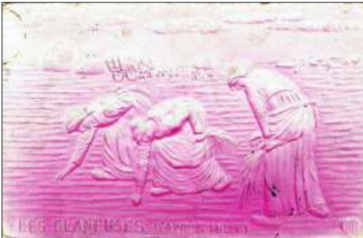
Afb. 2: Ansichtkaart 'naar de Arenleessters van Millet'.

Over Alida Spaander uit Volendam, de schrijfster van de kaart, valt gelukkig meer te vertellen. Daarvoor moet wel eerst een stapje terug in de tijd gedaan worden. Volendam is van oudsher een vissersdorp geweest. Rond 1875 begonnen kunstenaars Volendam te bezoeken en op schilderijen, tekeningen en foto's vast te leggen. De oorzaak hiervan was een ontwikkeling in de kunst. Rond 1850 keerden in Frankrijk een aantal schilders zich af van de traditionele thema's van mythologische figuren en fantasielandschappen en werd het realistische (boeren)leven van alledag in beeld gebracht. De Franse schilder Jean-François Millet (1814-1975) was hierin een voorloper. Vrijwel iedereen (her-)kent onmiddellijk Millet's schilderijen van het Angelus en de Arenleessters (afb. 2).