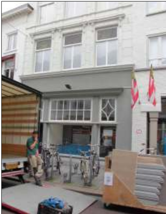
Afb. 6: In de huidige situatie is het pand Vughterstraat 44 onderdeel van de winkel van Albert Heijn.

Hoewel Van Heeswijk in die periode nog steeds adviseur was van de Udenhoutse Boerenleenbank en de pastoor geestelijk adviseur, zal het niet verbazen dat de pastoor vijf dagen later, op 29 januari 1909, zijn saldo bij de plaatselijk bank opnam en zijn spaarrekening liet opheffen. Wellicht had de pastoor herderlijke gevoelens voor zijn parochianen. Maar nadat de burgemeester de plaatselijk bank op weinig subtile wijze bij de pastoor in diskrediet had gebracht, achtte deze zijn pecunia kennelijk veiliger thuis bij de 's-Hertogenbossche.