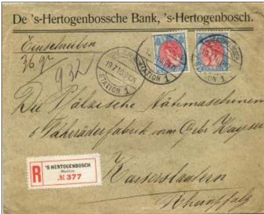
Afb. 1: Aangetekende brief van De 's-Hertogenbossche Bank d.d. 19-7-1910 naar Kaiserlautern.

Nou verzamel ik al best een tijdje firmabrieven van Bossche bedrijven en instellingen. Groot was daarom mijn verrassing en vreugde toen ik een fraaie brief tegenkwam uit 1910, mooi gefrankeerd, en aangetekend verzonden naar het buitenland door De 's-Hertogenbossche Bank, van welks bestaan ik nog niet eerder iets had vernomen. Voor een schappelijk bedrag kon ik de brief 'arresteren' (afb. 1).