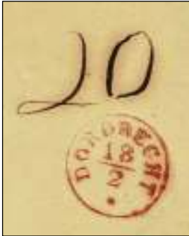
Afb. 5: Rood aankomststempel Dordrecht 18 februari en zwarte portaanduiding '20' op achterzijde.

PEP1 noemt stempel 'AMSTERDAM 17 2 FRANCO' een postmerk 30 met het PEP-nummer 6020-89: halfroond franco A, blauwe inkt, Ø23,5 mm, zonder jaartal, gebruiksperiode 1842-1850 .