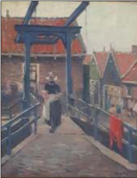
Afb. 3: A.P. Schotel, Volendams meisje.

Ook in Nederland ontstonden er diverse kunstenaarskolonies in (onder andere) Katwijk aan Zee, Domburg, Heeze, Laren, Blaricum en ook – vanaf 1875 – in Volendam. De kleurige traditionele klederdracht en levensstijl van het vissersdorp Volendam spraken erg tot de verbeelding van deze kunstenaars. Datzelfde gold voor de verweerde visserskoppes, de botters, de pittoreske huisjes en de gekleurde ophaalbruggetjes.