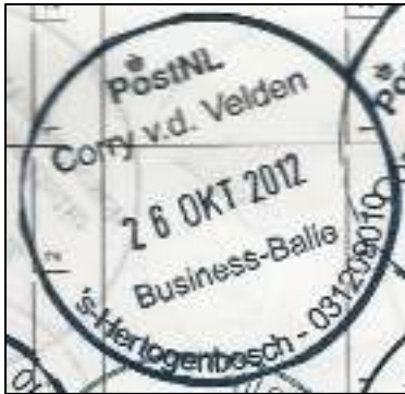
Afb. 6: Corry v.d. Velden