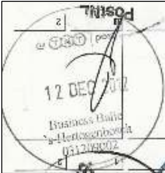
Afb. 16: 031209002.

Op basis waarvan het nummer in afb. 14 is gekozen 031209001 blijft onduidelijk. Het is in ieder geval het eerste in een reeks stempels die alle beginnen met het nummer 0312090; en vervolgen met 02 tot en met 10 (afb. 16 en 17).