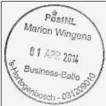
Afb. 3: de nieuwe en