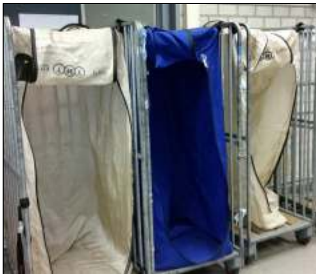
Afb. 10: Rolcontainers met hangtenten.