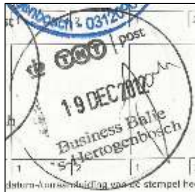
Afb. 9: 'Jane'.

Geleidelijk raakte bekend op de afdeling dat er veel zou gaan veranderen. Na de afstempeling van 9 april 2013 in het Stempelrapport is de opmerking te lezen: 'Als we niets meer hoeven te stempelen? dan is dit toch ook overbodig! Oh nee de kaarten op de containers.'