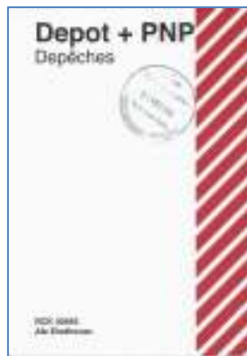
Afb. 11: Kaartlabel.

Aangetekende post die privé personen aanboden op een postkantoor of op een agentschap/serviceloket, werd daar ter plekke in een verzegelde zak gedaan en ging via het sorteercentrum ongeopend meteen naar Arnhem.