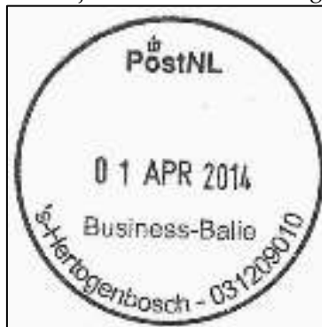
Afb. 18: 1 april ....

Deze nummering, aangebracht in de periode van TNT|post, vertoont een zekere logica. Maar toen de firma haar naam veranderde in PostNL en nieuwe stempels moesten worden aangemaakt, is het nummer 031209010 een eigen leven gaan leiden. De PostNL-stempels met de namen van de vijf medewerksters, en een stempel zonder naam (afb. 18), dragen alle ditzelfde nummer. Noch op de werkvloer, noch bij het management van De Brand weet men nog waarop dit nummer betrekking heeft. Al deducerend en combineerend weten wij het nu wel: het cijfer 031209010 slaat nergens op. Heerlijk toch!