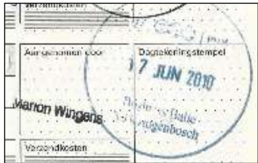
Afb. 4: de oude situatie.

Daags na het verhelderende en prettige bezoek van beide dames kreeg ik per post een envelop bezorgd, met een aantal postale documenten en formulieren die voor mij het vertelde konden illustreren. Met het gevolg dat ik mij prompt in een filatelistisch Luilekkerland waande. In de envelop zaten voorbeelden van allerlei stickers, labels en doorschrijfformulieren die zij op hun afdeling gebruikten, en soms nog steeds gebruiken. Echter ook een gebruikt (verjaard) exemplaar van een registerboekje met verzendsbewijzen (vgl. afb. 4). En als klap op de vuurpijl het zgn. Stempelrapport dat op hun afdeling heeft