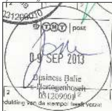
Afb. 15: Nieuwe nummering.