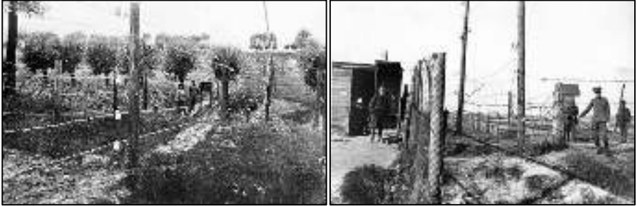
Twee opnames van de geveesde stroomdraad aan de Belgisch-Nederlandse grens.

In 1915 plaatsten de Duitsers een circa 200 kilometer lang stroomhek langs de grens van België en Nederland. Men wilde een halt toeroepen aan de oorlogsvrijwilligers die gehoor gaven aan oproepen van koning Albert I en kardinaal Mercier om het laatste stuk onbezette Belgisch grondgebied te helpen verdedigen, en naar Frankrijk wilden om zich aan te sluiten bij de geallieerde legers.