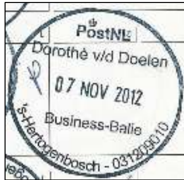
Afb. 7: Dorothé v.d. Doelen.