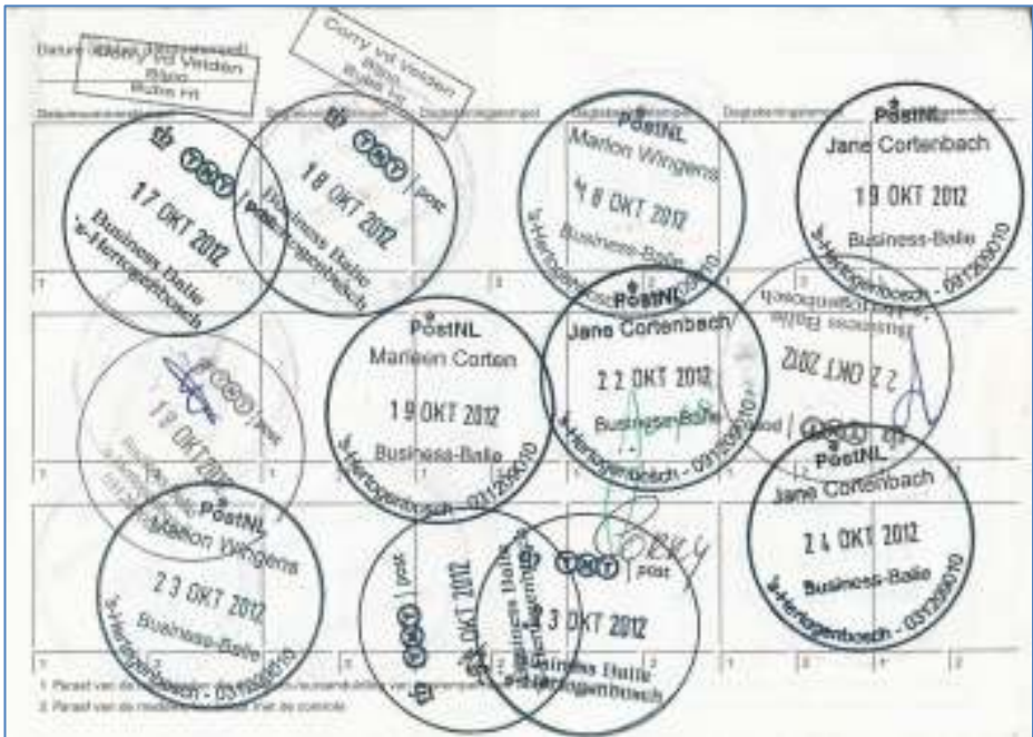
Afb. 5: De eerste pagina in het Stempelrapport.