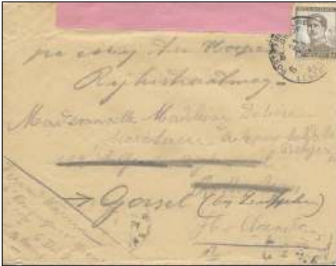
Doorgezonden brief, verzonden via de Belgische Legerposterijen en onderworpen aan militaire censuur (roze sluitstrook), in Rotterdam aangekomen, naar Gorssel.

Aanvankelijk vond de opvang van de burgervluchtelingen zo veel mogelijk plaats bij en door particulieren. Uit correspondentie uit die tijd kennen we tal van adressen van pensions waar ze tegen betaling verbleven. Maar niet iedereen kon dat bekostigen. Soms was die huisvesting van tijdelijke aard, en moest er correspondentie worden nagezonden. Dat systeem werkte perfect.