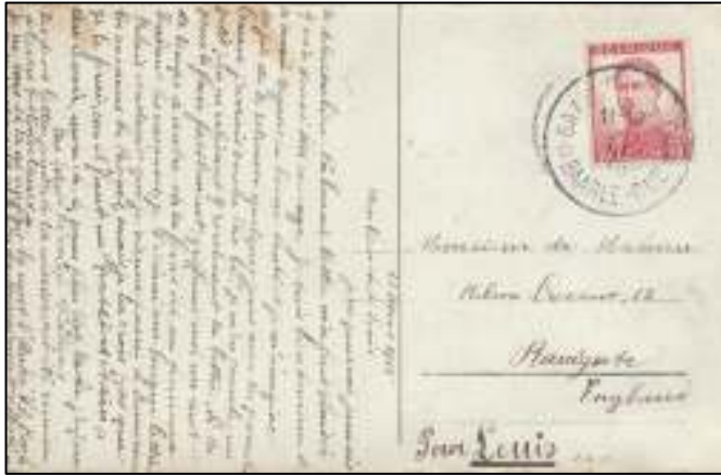
Ansicht uit de enclave Baarle Hertog van 23 maart 1915, verzonden via het vrije Nederland naar Ramsgate, GB.

verstandhouding met het neutrale Nederland diende te worden gerespecteerd.