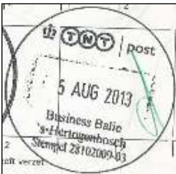
Afb. 14: Stempel genummerd.