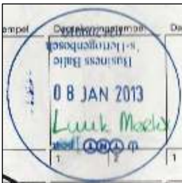
Afb. 8: (n.b. kopstaande datum)