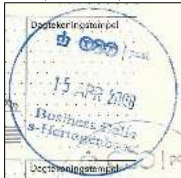
Afb. 13: Cijferloze onderrand.