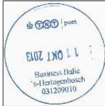
Afb. 17: 031209010.

Deze nummering, aangebracht in de periode van TNT|post, vertoont een zekere logica. Maar toen de firma haar naam veranderde in PostNL en nieuwe stempels moesten worden aangemaakt, is het nummer 031209010 een eigen leven gaan leiden. De PostNL-stempels met de namen van de vijf medewerksters, en een stempel zonder naam (afb. 18), dragen alle ditzelfde nummer. Noch op de werkvloer, noch bij het management van De Brand weet men nog waarop dit nummer betrekking heeft. Al deducerend en combineerend weten wij het nu wel: het cijfer 031209010 slaat nergens op. Heerlijk toch!