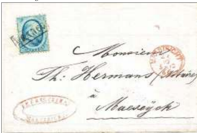
Maastricht, 27 oktober 1866. Briefje met bestemming Maaseik, België, afstand 36 km.

Nederland heeft zijn langste grens langs Duitse zijde (577 kilometer). Opvallend is dat hier minder grenspoststukken zijn terug te vinden dan bij de grens met België (458 kilometer). Een mogelijke reden is dat langs de grens met Duitsland meer 'lege plekken' zijn te vinden. Met 'lege plekken' bedoel ik: minder postkantoren in de grensstreek binnen de genoemde afstand van 30 kilometer.