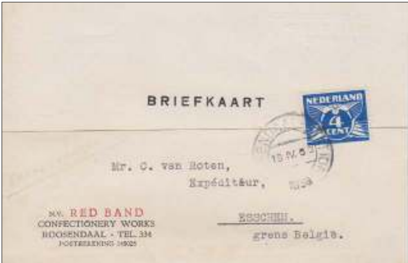
Roosendaal-Station, 19 april 1938. Briefkaart met bestemming Esschen in België, afstand 9 km. Tarief: briefkaart binnenland vanaf 1 september 1937 tot 1 april 1939 4 cent.