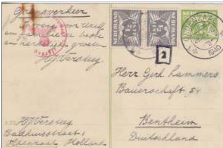
Oldenzaal, 28 maart 1940. Briefkaart met bestemming Bentheim in Duitsland, afstand 25 km. Tarief: briefkaart binnenland vanaf 1 april 1939 tot 20 augustus 1940 3 cent. Uit de tekst valt op dat men al eerder contact heeft gehad in het verleden. De frankering van 4 cent was het tarief uit de voorgaande periode.