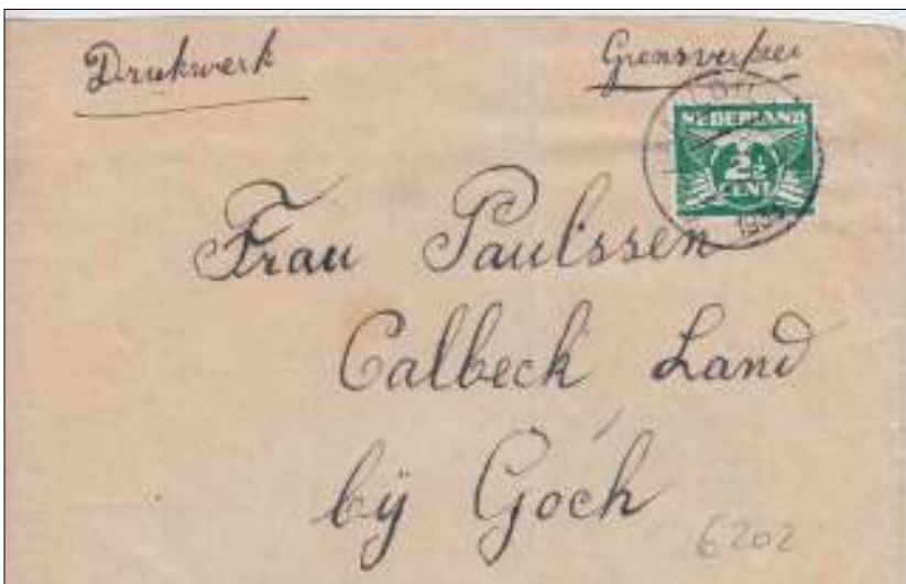
Baarlo (Lb.), 2 september 1933. Drukwerkband met bestemming Goch. Tarief: drukwerk naar het buitenland 2½ cent per 50 gram of een gedeelte van 50 gram. Geen grenstarief voor drukwerk.