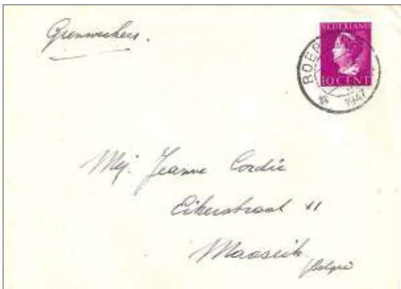
Roermond, 25 februari 1947. Brief met bestemming Maaseik in België, afstand 23 km. Tarief: brief binnenland tot 20 gram vanaf 1 november 1946 tot 1 november 1957 10 cent.

NB. De opgave in kilometers bij de stukken is de afstand gemeten over de weg.