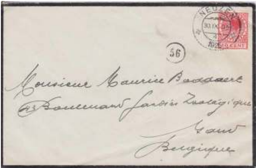
Neuzen, 30 september 1925. Rouwbriefje met bestemming Gand (Gent). Neuzen is de oude benaming van Terneuzen. De stad ligt op 35 km afstand van Gent. Tarief: brief tot 20 gram binnenland 10 cent vanaf 1 maart 1921 tot 1 juli 1927.