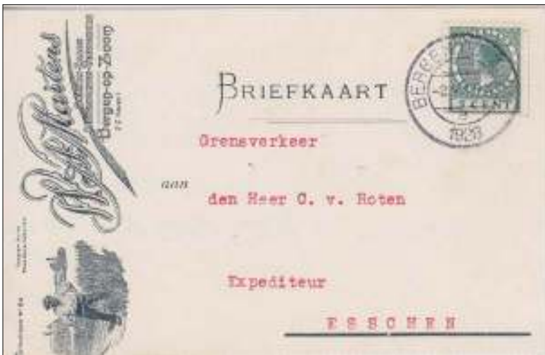
Bergen op Zoom, 2 augustus 1928. Briefkaart met bestemming Esschen in België, afstand 16 km. Tarief: briefkaart binnenland vanaf 1 oktober 1926 tot 1 september 1937 5 cent.