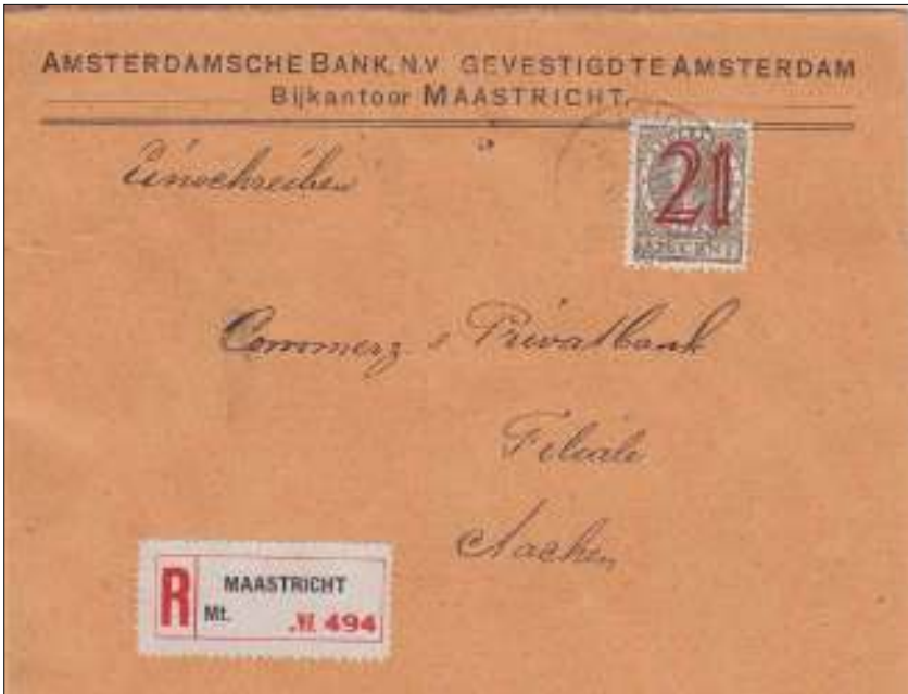
Maastricht, 25 januari 1930. Aangetekende brief met bestemming Aachen, afstand 39 km. Kennelijk lagen de postkantoren wel binnen een afstand van 30 km. van elkaar. Tarief: brief tot 20 gram 6 cent, aantekenenrecht 15 cent.