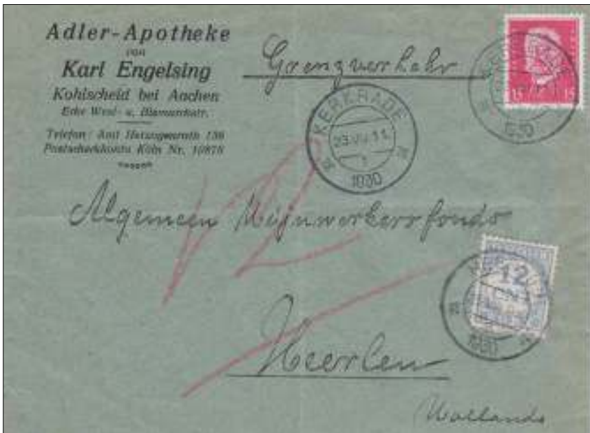
Kohlscheid/Kerkrade, 23 augustus 1930. Brief met bestemming Heerlen, gelegen op 15 km. van Kerkrade. Tarief: brief tot 20 gram in het binnenland 6 cent. De brief is over de grens in Nederland gepost, waar de Duitse zegel geen waarde had. Belast in Nederland met het dubbele van het Nederlandse tarief, dus 12 cent.