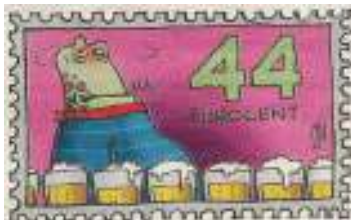
21 mei: Cartoon boven een paginagrote afbeelding in het Brabats Dagblad van alle ruim 60 speciale Bossche postzegels.