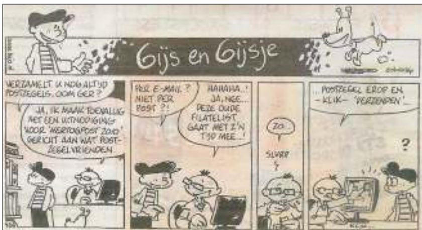
23 mei: De Bossche Omroep: oom Ger, een oude filatelist die met z'n tijd meegaat.