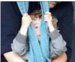
Hier moet ik nog mee geholpen worden.