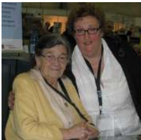
'Old soldiers never die...'