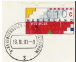
de aanvullingswaarde van 10 cent.