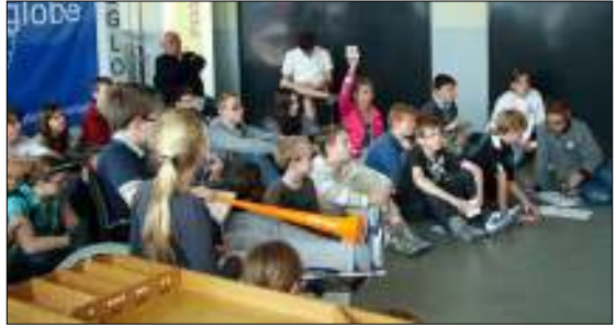
Aandacht voor de veiling op zaterdag.