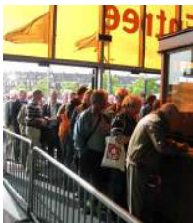
28 mei: Dringen voor de kassa.