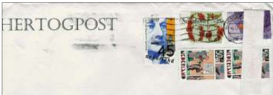
Hertogpost-envelop van april met barcodesticker.

Ik durf het best nog sterker te stellen: TNT Post heeft geen enkel begrip voor de filatelist! Een mooi voorbeeld is de klacht van de heer Wibier in Filatelie van april j. l. (Hulde hoofdredacteur voor de publicatie. Zo hoort het in een 'onafhankelijk' maandblad.) Hij ergert zich aan de barcodestickers die bij herhaling over mooie postzegels op aan hem gezonden aangetekende brieven zijn geplakt. Hij heeft de kwestie diverse malen bij TNT Post aan de orde gesteld, zonder enig resultaat. Ook de envelop van onze eigen Hertogpost,