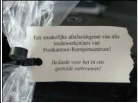
Afb. 3: een bonbon tegen de nare smaak.