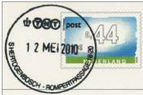
Afb. 9: Bruna Rompertpassage 18-20.