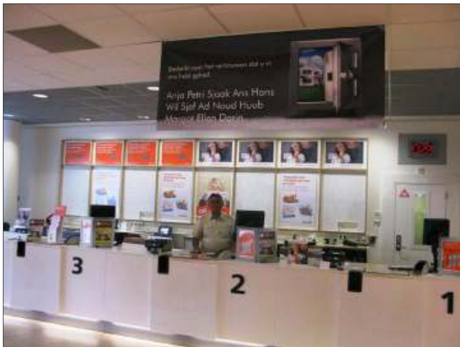
Afb. 1: In september 2009 nam Sjeff van Overbeek afscheid van het postkantoor in Rosmalen, waar hij jarenlang heeft gewerkt. Nu mocht hij als laatste man het licht uitdoen in het postkantoor Rompertcentrum.

Het moment van sluiting wilde ik natuurlijk weer vastleggen op foto en documenteren met stempels van de laatste en eerste dag.