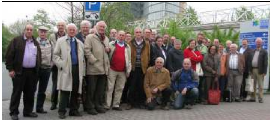
Zaterdag 8 mei 2010. Bezoek aan de Briefmarkenmesse Essen.