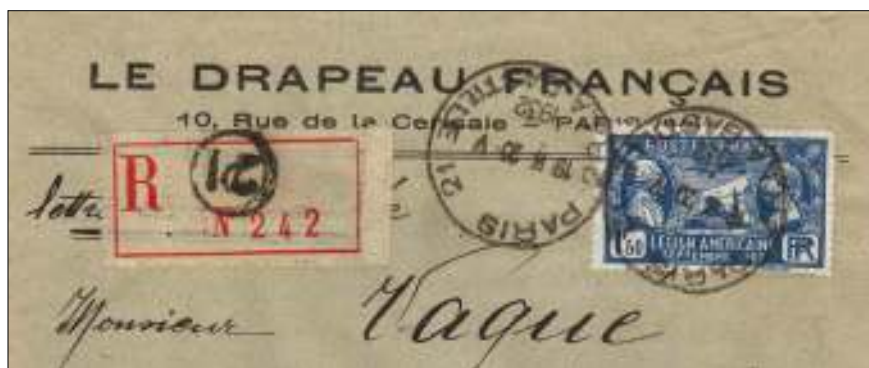
Afb. 3: Aangetekende brief verzonden door postkantoor nr 21 in de Rue de la Bastille. Dit Parijse postkantoor ligt aan een straatje dat uitkomt op de Place de la Bastille (Bastille-plein). Hier stond vroeger de Bastille, een gevangenis die in 1789 door de revolutionairen werd bestormd.

tische verzameling over Parijs op te nemen (afb. 3). En zo geschiedde. Samen met allerlei andere filatelistische elementen is dit nu een collectie geworden die me behoorlijk bezig houdt, met alle problemen die het met zich meebrengt.