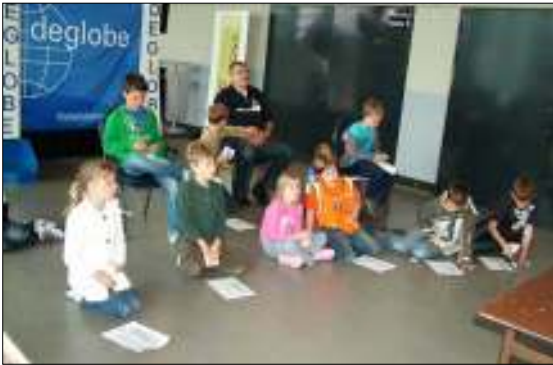
Wat minder opkomt voor de veiling op zondag.