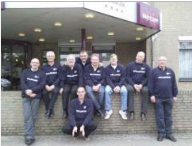
Het complete spelenteam van de Globe.

Is 's-Hertogenbosch een slaapstad? Of heb ik teveel aan de je never geze ten uit de fle sje s?