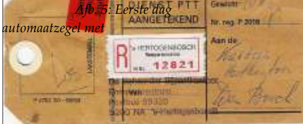
Afb. 5: Eerste dag automaatzegel met