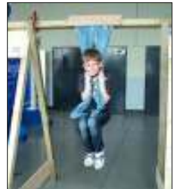
Maar ik kom al verder dan 25 seconden!