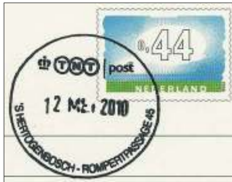
Afb. 10: Albert Heijn Rompertpassage 45.

Er is nog èèn postkantoor over in 's-Hertogenbosch: Helftheuvelpassage. De sluiting vindt plaats in het komend najaar.