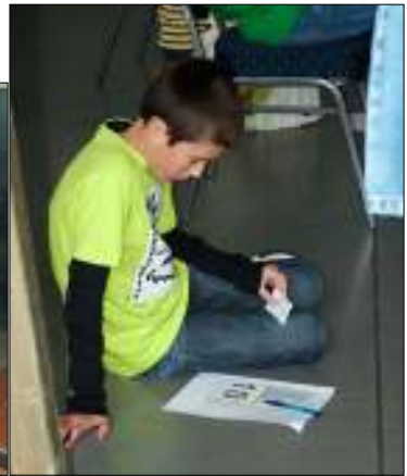
Hoeveel punten heb ik nog?