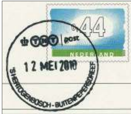
Afb. 8: Supercoop Buitenpepersdreef 353.