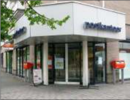
Afb. 2: Postkantoor Rompertcentrum.