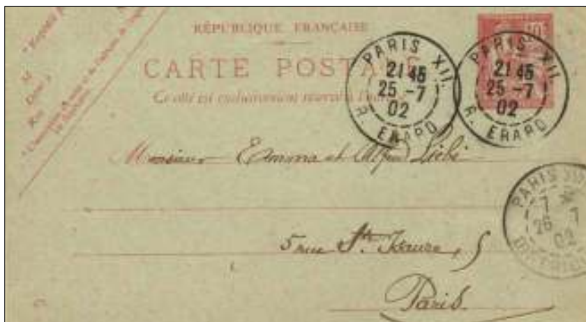
Afb. 2: Briefkaart verzonden door post-wijkkantoor 12; ontvangen door wijkkantoor 18 voor bestelling.

tische verzameling over Parijs op te nemen (afb. 3). En zo geschiedde. Samen met allerlei andere filatelistische elementen is dit nu een collectie geworden die me behoorlijk bezig houdt, met alle problemen die het met zich meebrengt.