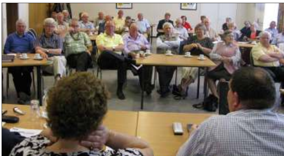
25 mei: Briefing in de Helfheuvel van ca. 50 vrijwilligers voor Hertogpost 2010.