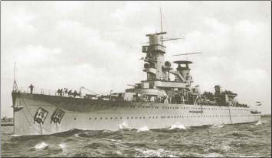
Hr. Ms. kruiser De Ruyter op woelige baren

leven. In de volgende uren werd bijna het gehele eskader vernietigd. Doorman zelf sneuvelde, tezamen met een groot deel van de bemanning van zijn vlaggeschip. Hoewel hij genoeg tijd had om zijn schip te verlaten, besloot hij, geheel volgens de marinetraditie, aan boord te blijven en samen met zijn schip ten onder te gaan.