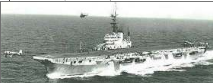
Vliegkampschip Hr. Ms. Karel Doorman in volle zee

Voor zijn heldhaftig optreden tijdens de Slag in de Java-Zee werd Karel Doorman in 1949 postuum benoemd tot Ridder der derde klasse der Militaire Willemsorde. Ter herinnering werd na de 2 e Wereldoorlog een vliegkampschip naar hem genoemd. Hr. Ms. Karel Doorman maakte als vlaggeschip tot 1968 deel uit van de Nederlandse vloot, totdat het werd verkocht aan de Argentijnse marine. In 1988 doopte Koningin Beatrix het nieuwe fregat 'Karel Doorman' waarmee de naam van deze Nederlandse zeeheld blijft voortleven bij de Koninklijke Marine.