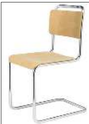
Buizenstoel van Gispen.

Gispen werd in 1890 geboren en volgde van 1913 tot 1916 onderricht bij de Academie voor Beeldende Kunst en Technische Wetenschappen in Rotterdam. In 1916 begon hij voor zichzelf onder de naam Kunstsmederij WH Gispen en Co. Gispen opende als eerste in de jaren twintig in Nederland een fabriek waar seriematig stalen buismeubilair voor woning en kantoorinrichting geproduceerd werd. Iedereen heeft wel eens op een stoel of aan een bureau van Gispen gezeten, of er op zijn minst een gezien.