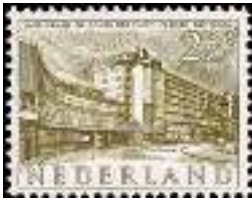
Van Nellefabriek Rotterdam, NVPH 655.

Zijn bedrijf verhuisde in 1934 naar Culemborg, waar het nog steeds is gevestigd ( https://www.gispen.com ).