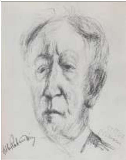
Arthur Rubinstein 1967.