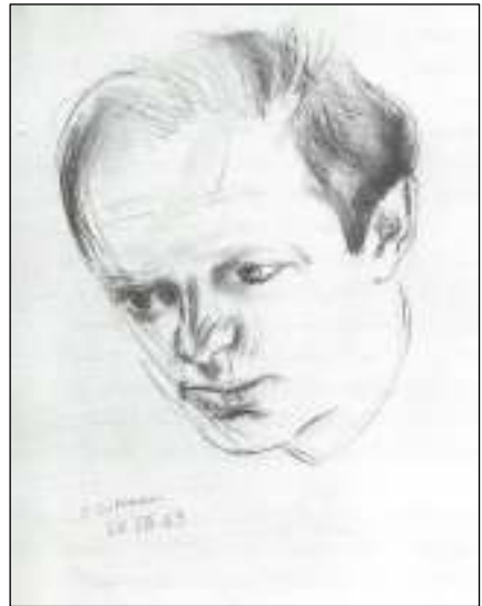
Bernard Haitink 1963.