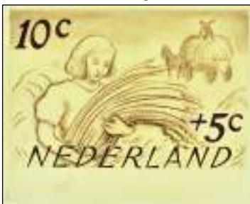
Werktekening voor de zomerpostzegel 1949.