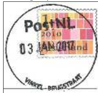
Postkantoor in Coop-winkel 3 januari 2017