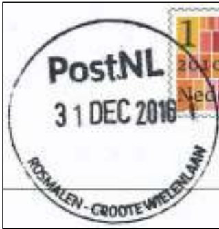
Postkantoor in Albert Heijn-winkel