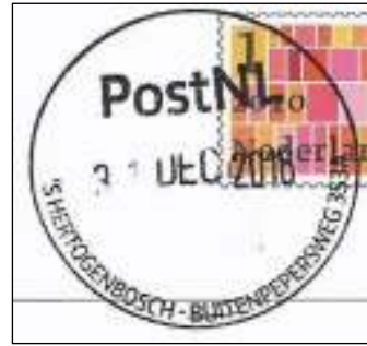
Pakketpunt in Super Coop Buitenpepersdreef (niet: -weg)