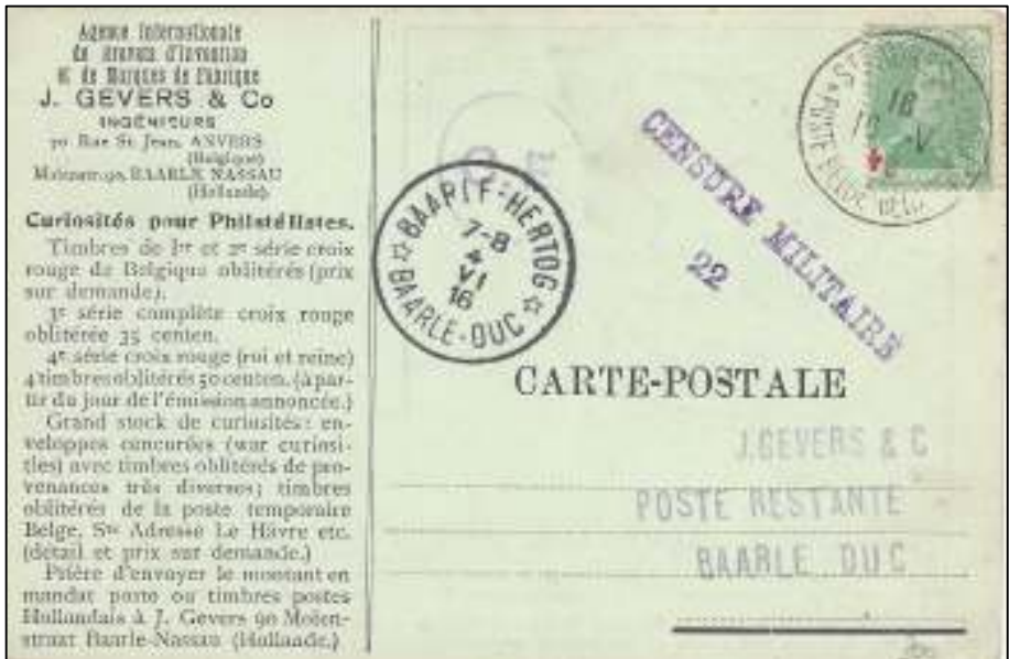
Afb. 4: Kaart van de heer J. Gevers van Sainte-Adresse naar Baarle Hertog: 'Curiosités pour Philatélistes'.