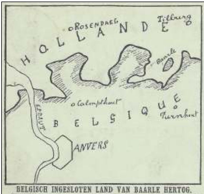
Afb. 5: Belgisch-Nederlandse grensregio met de enclave Baarle-Hertog.

Op de voorzijde prijkt een redelijk primitief landkaartje van de Belgisch-Nederlandse grensregio (afb. 5). Daaronder heeft hij een historische verklaring opgenomen over de herkomst van het Belgisch ingesloten land van Baarle-Hertog.