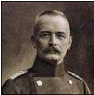
Afb. 2: Von Falkenhayn.

Maar Von Moltke heeft het wel bij het rechte eind: het grote Duitse offensief valt midden september stil. In plaats van aan te vallen graven de Duitsers in allerijl loopgraven en stellen hun machinegeweren op. Een mitrailleur blijkt sterker dan een hele massa soldaten in de aanval. Golf na golf worden aanstormende troepen neergemaaid en honderdduizenden soldaten klampen zich vast in hun loopgraven.