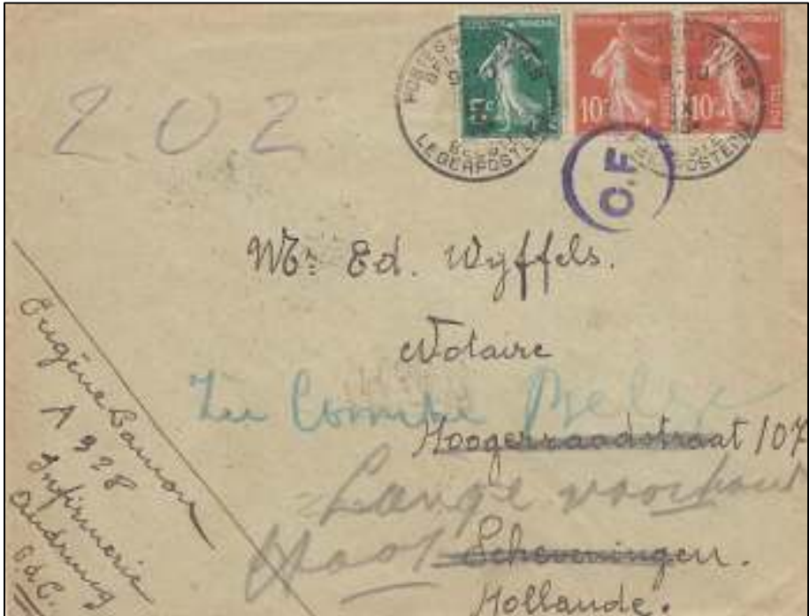
Afb. 6: Brief gefrankeerd met Franse zegels, ontvaard met een stempel van de Belgische Legerposterijen.

adres, de (Dirk) Hogerraadstraat 107, onbekend. Verdere navraag door de post in Scheveningen leverde de aantekening 'Onbekend bij Streijdonk Seinpostduin nr. 24' op. De post schreef vervolgens 'Zie Comité Belge'. Daar wist men wel raad en werd het correcte adres in potlood bijgeschreven: Lange Voorhout, Haag.