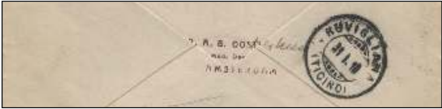
Afb. 5: Achterzijde van de briefomslag.

Op de achterzijde van de omslag (afb. 5) staat het adresstempel van de dokter, in rode inkt. Door hemzelf met blauwe inkt iets verduidelijkt. Het rondstempel van Ruvigliana in het kanton Ticino is vier dagen na versturen aangebracht, aankomst 31 januari 1918. Ticino is het zuidelijkste kanton van Zwitserland en bijna volledig Italiaanstalig.