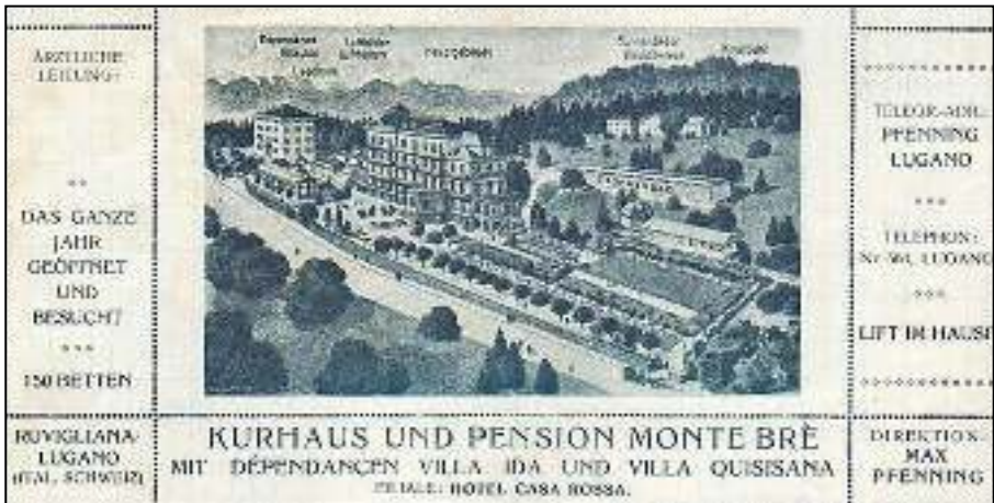
Afb. 4: Kuuroord Monte Brè met dependances en hotel Casa Rossa.