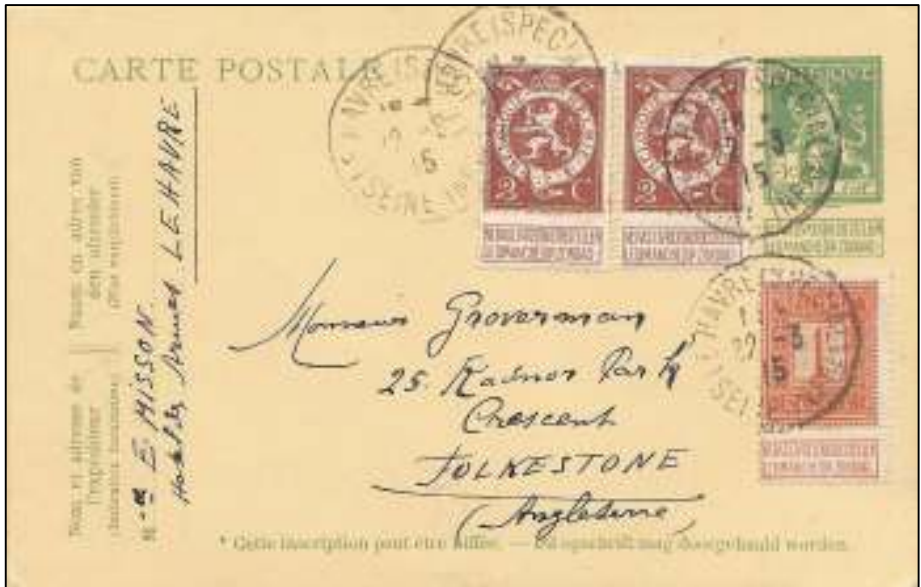
Afb. 3: Belgische bijgefrankeerde briefkaart van Le Havre naar Folkestone.