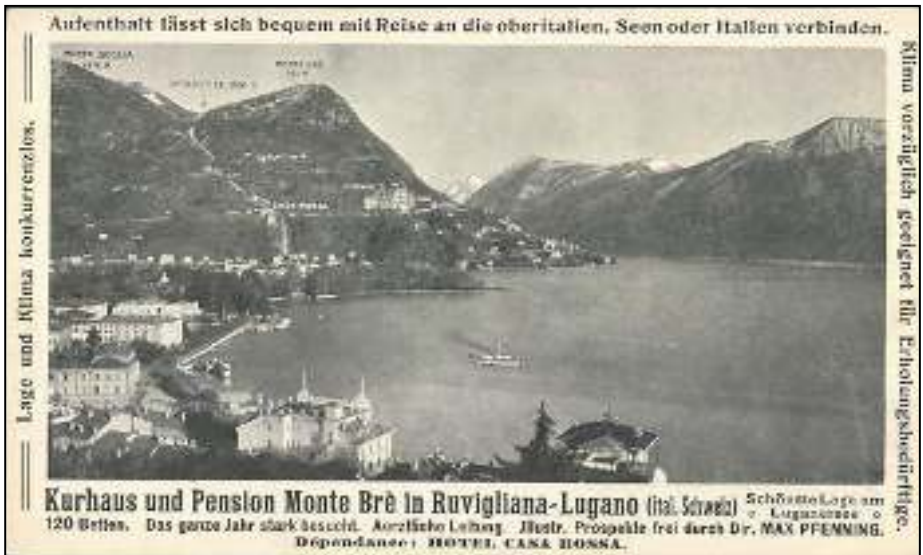
Afb. 2: Kuuroord complex Monte Brè in Ruvigliana-Lugano Italiaans Zwitserland.