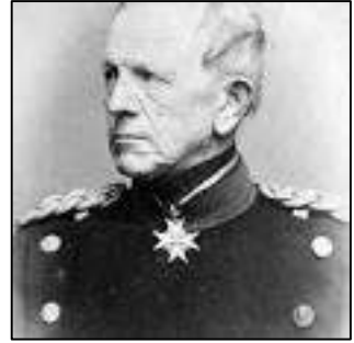
Afb. 1: Von Moltke.

Die laat hem prompt vervangen door Von Falkenhayn. Die gelooft dat de oorlog in het westen gewonnen of verloren zal worden en is in 1916 de aanjager van het bloedbad bij Verdun (afb. 2).