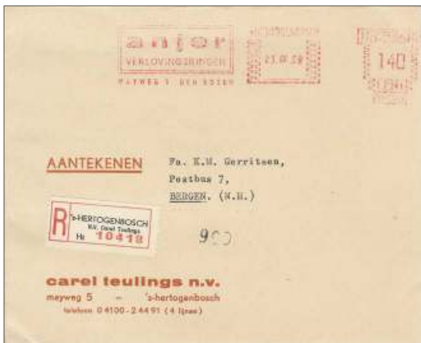
Juwelierspost uit 1969 die wel is aangekomen bij de geadresseerde.

Wikipedia kent 29 verschillende termen voor het werkwoord 'stelen'. Dat wil zeggen dat 'jatten' of 'tsjoeken' – om er maar twee te noemen – een wijdverbreid verschijnsel is. 'Rotte appels bij de post', luidde een kop in het Brabants Dagblad van 5 december j. l. De krant vervolgde: 'Sorteercentra van PostNL zijn een potentiële goudmijn voor boeven. [...] Een 23-jarige post-sorteerder in Den Bosch werd in september betrapt op openen van een pakketje om de inhoud te pikken. Elders bleek uit camerabeelden dat medewerkers 'juwelierspost' achterover drukten.'