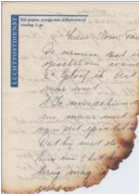
Velletje van de gedeeltelijk verbrande inhoud.