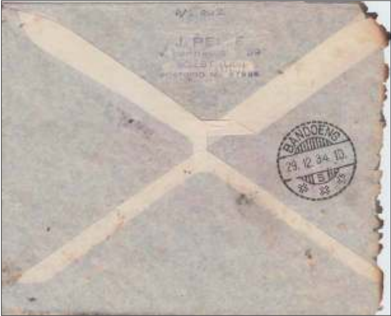
De achterzijde van de gedeeltelijk verbrande brief met aankomststempel Bandoeng, 29 december 1934.