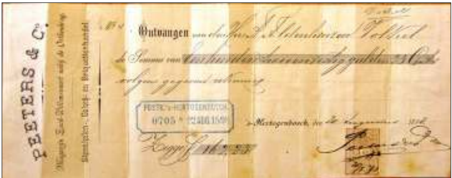
Deze postkwitantie ad f 162,23 deed Hoefs de das om.