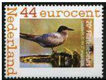
De beurspostzegel van 2008

Zoals steeds is de entree en het parkeren gratis. Een speciale bus pendelt ieder half uur tussen het NS-station Hilversum en het beursgebouw.