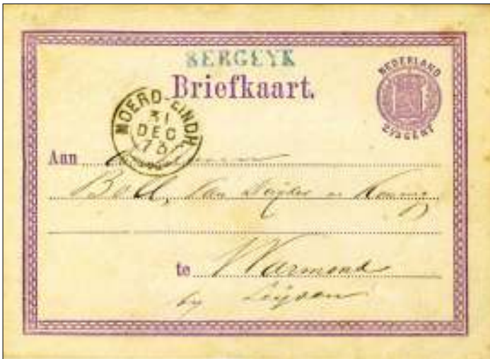
Briefkaart geschreven in Bergeijk verzonden naar Warmond.

Hulpkantoor 'Bergeijk' lag aan de bodeloop Luijksgestel – Valkenswaard. Van hulpkantoor Valkenswaard wisselde een bode twee maal daags de post uit met de conducteur der briefmalen op de lijn Moerdijk – Eindhoven.