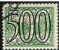
Twee van de postzegels waarmee de majoor zo in z'n sas was.

Die 'krabbel' is bij het dagboek bewaard gebleven; in 's-Hertogenbosch wat wil zeggen toch niet in het Haagse Postmuseum.