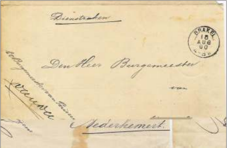
Afb.3a: .Dienstbrief van de gemeente Brakel naar de gemeente Nederhemert.

van de namiddag verzonden en tussen 8 en 9 uur 's avonds aangekomen. Interessant is hierbij de achtergrond, een stukje 'rivierhistorie': in die tijd was Nederhemert nog van Gelderland gescheiden door de oorspronkelijke Maas, zodat Nederhemert in Noord-Brabant lag. Maar het is mij niet duidelijk waarom de route niet van Hedel via 's Hertogenbosch naar Heusden ging. Was er geen bode(loper) die op Heusden liep, of heeft het met het spoedkarakter te maken?