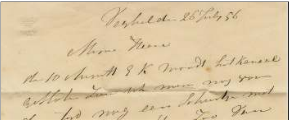
Afb. 3: Begin van de tekst van de vouwbrief. De complete tekst luidt als volgt: "Veghel 26 July '56. Mijnne Heren, den 10 Augustus E.K. wordt het kanaal gesloten. Zou u min nog voor dien tijd een Schuitje met Vlinke Stukke en Steen Zo Van ieders wat Ze mins eve generen. Zou u die mins nog konde Zende in die Verwachting met Achtung. in haest. L.v.d.Hout.

De Heer Schreuders Zorgt voor goede qualiteit en Leuke prijs. doe Zulks te men om onzen Kennis en Vriendschap te behouden."