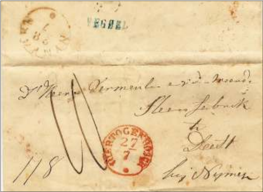
Afb. 2: Vouwbrief van Veghel (naamstempel) via 's-Hertogenbosch (27.7) naar de Steenfabriek te Deest bij Nijmegen (28.7). Gewicht 11 gram; tarief t/m15 gram: 10 ct.