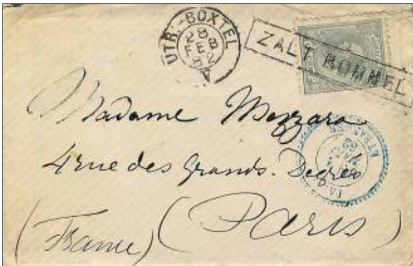
Afb. 1: Internationaal poststuk van Zaltbommel naar Parijs. Treinhaltestempel Zaltbommel, treinstempel Utrecht-Boxtel. Aankomststempel Parijs 1 maart 1882. Dit aardige stukje doet dienst in een hoofdstuk over treinverbindingen.