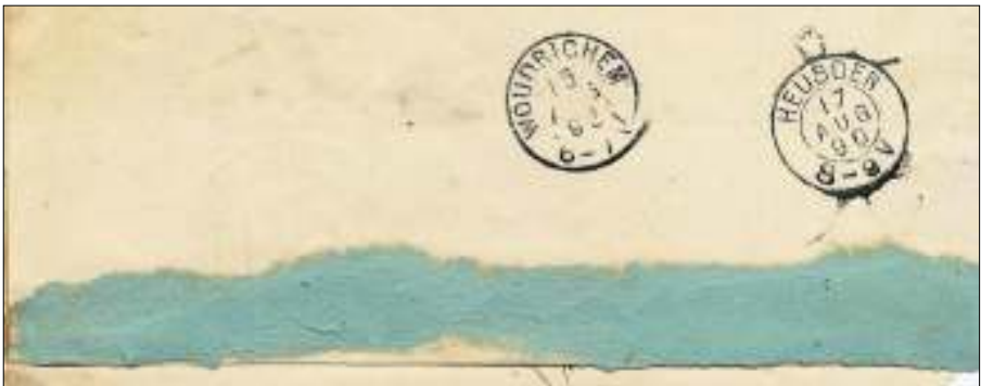
Afb. 3b: Achterzijde van deze dienstbrief. De route liep dus via Woudrichem en Heusden naar Nederhemert.