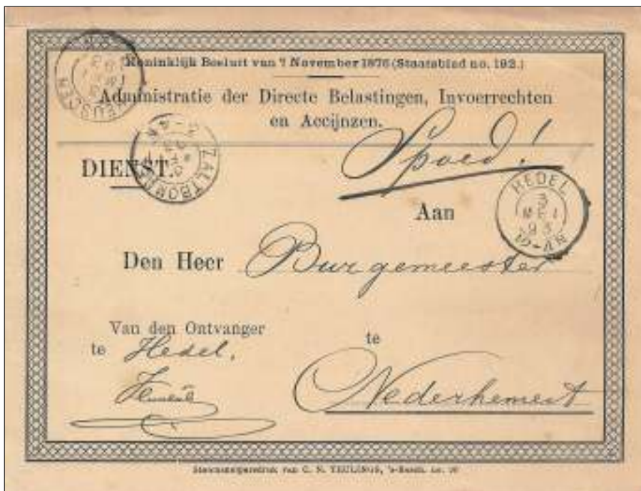
Afb. 2: Dienstkarte van Hedel naar Nederhemert. Via Zaltbommel en Heusden. Begin