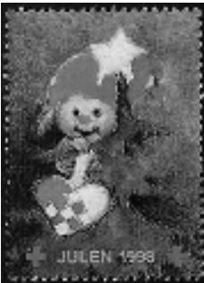
Afb. 13: Rode Kruis