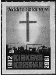
Afb. 11: Kerkelijk