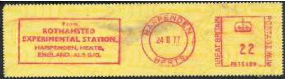
Afb. 6: Door dit Engelse proefstation zijn diverse goede appelonderstammen ontwikkeld.

verzamelde om in leven te blijven. Daarna komt de landbouwende oermens in beeld, hij ging wat fruit verbouwen. We moeten ons voorstellen, dat die prehistorische vruchten van bijvoorbeeld een appelboom slechts enkele centimeters groot waren. Ook tegenwoordig kunnen we in Europese oerbossen nog wilde appeltjes en peertjes aantreffen. Zonder enige kennis selecteerde de vroege fruitboer al op bepaalde kenmerken en dit ging door via de verschillende beschavingen (Grieken, Romeinen) tot in de moderne tijd. Er wordt nu ook gekruist tussen rassen, zodat uiteindelijk vele duizenden verschillende rassen ontstaan. De teelt wordt moderner, er worden betere onderstammen verkregen (afb. 6). Bovendien zijn er in de fruitveredeling in de 20 ste eeuw hypermoderne technieken bijgekomen.