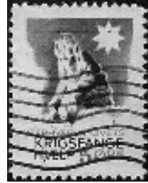
Afb. 12: Algemeen