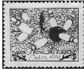
Afb. 14: Sportvereniging