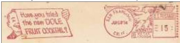
Afb. 12 b: Een cocktail smaakt natuurlijk ook.

Veel plezier met uw hobby en ben benieuwd naar uw reacties, KOERBRIEF.