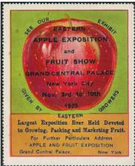
Afb. 7: een fraaie Amerikaanse plakzegel met reclame voor een 'fruit-show'.

verzamelde om in leven te blijven. Daarna komt de landbouwende oermens in beeld, hij ging wat fruit verbouwen. We moeten ons voorstellen, dat die prehistorische vruchten van bijvoorbeeld een appelboom slechts enkele centimeters groot waren. Ook tegenwoordig kunnen we in Europese oerbossen nog wilde appeltjes en peertjes aantreffen. Zonder enige kennis selecteerde de vroege fruitboer al op bepaalde kenmerken en dit ging door via de verschillende beschavingen (Grieken, Romeinen) tot in de moderne tijd. Er wordt nu ook gekruist tussen rassen, zodat uiteindelijk vele duizenden verschillende rassen ontstaan. De teelt wordt moderner, er worden betere onderstammen verkregen (afb. 6). Bovendien zijn er in de fruitveredeling in de 20 ste eeuw hypermoderne technieken bijgekomen.