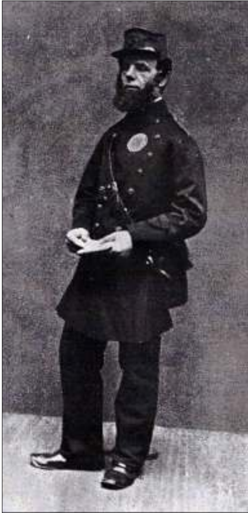
Afb. 3: Postbode gekleed in een enigszins gedateerd uniform

Wanneer u nog meer droevige verhalen kent van leed dat filatelisten door PTT, KPN, TPG of TNT is aangedaan en u kunt dat eventueel laten zien met post die op de een of andere manier is mishandeld, dan houd ik mij aanbevolen.