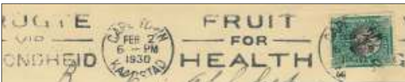
Afb. 11 a: Het is al tientallen jaren bekend dat fruitconsumptie gezond is.

De handel wordt gestroomlijnd mede door het verschijnen van de supermarkten. In de marketing wordt ook steeds meer de nadruk gelegd op het gezonde van fruit (afb. 11 a en b).