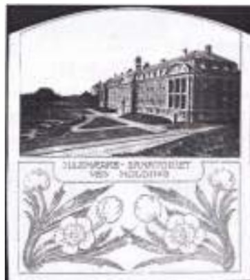
Afb. 6: Sanatoria