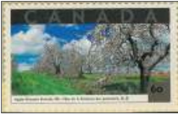
Afb. 3: Een boomgaard met (half-)hoogstamappels in bloei-pracht.