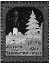
Afb. 15: Gemeenten