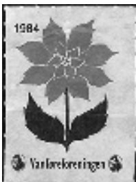
Afb. 9: Medisch