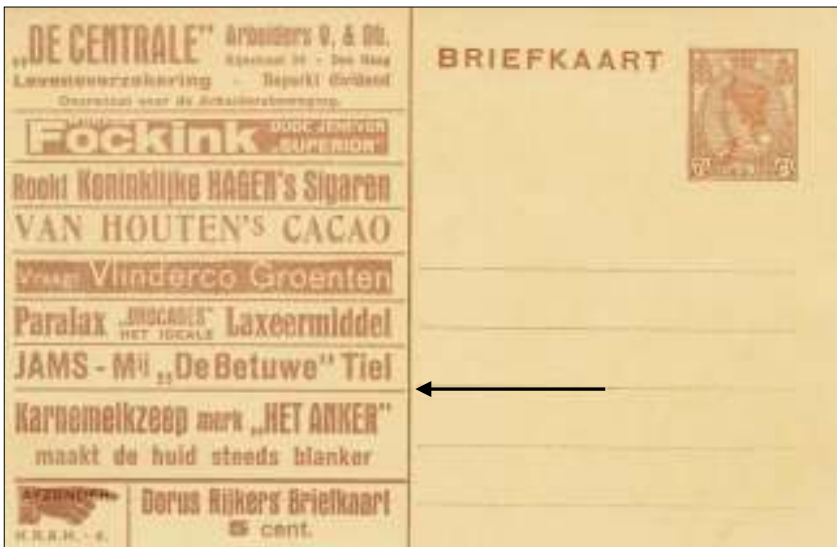
Afb. 12 a: Inmiddels is 'De Betuwe' al opgeslokt door Hero Breda (particulier bedrukte briefkaart).

Natuurlijk is er een onderscheid tussen het eten van vers fruit en het nuttigen van fruitproducten, deze laatste in allerlei vormen (afb. 12 a en b).