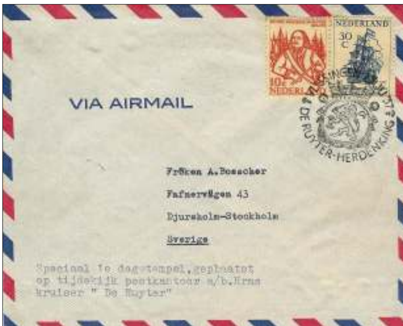
Afb. 1: Brief met gelegenheidsstempel Vlissingen 2 juli 1957 en Zweedse bestemming