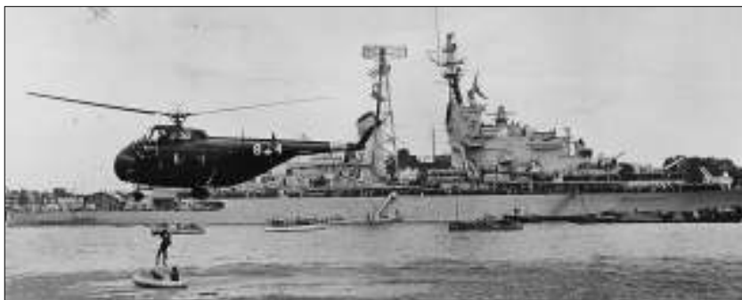
Afb. 2: Marine helikopter met op de achtergrond Hr. Ms. Kruiser De Ruyter