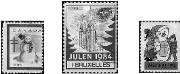
Afb. 4: Jule-zegels van Canada, België en de Verenigde Staten