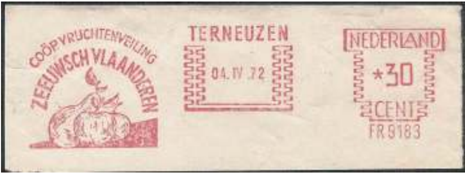
Afb. 8: Elke fruitregio had in Nederland haar eigen veiling.

De afzet wordt vergemakkelijkt door de beroemde Nederlandse coöperatieve veilingen (afb. 8).