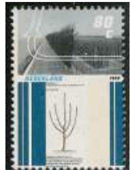
Afb. 5: Boven: rijen dicht opeengeplante laagstammen; onder: één apart met snoeisysteem.

Alle oude rassen zijn van onschatbare waarde voor de ontwikkeling van nieuwe rassen. Het is dus van grote betekenis dat deze bewaard blijven voor de toekomst. Het gaat om de erfelijke eigenschappen die kunnen worden 'ingekruist'. Men kan de boompjes van oude rassen planten en zo bewaren, maar het is ook mogelijk om stekken te bewaren door ze in te vriezen. Wat zodoende ontstaat is een zogenaamde genenbank. In veel landen bestaan deze al, ook in Nederland. Met de uitgifte van de twee zegels schenkt Zwitserland dus aandacht aan de genenbank van oude fruitrassen.