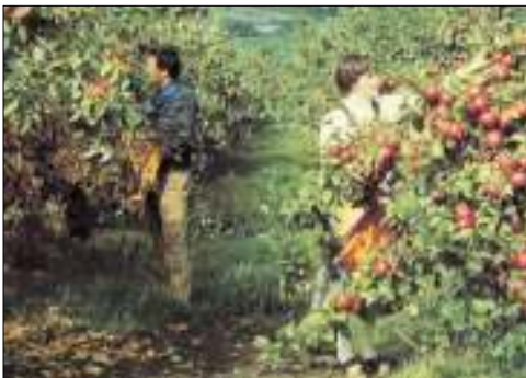
Afb. 4: Zonder ladders oogsten van laagstam-appels oogt een stuk gemakkelijker!

Voor een deel is de kwaliteit en smaak teruggelopen. De consument wil graag een grote prachtige appel, maar vergeet dat een kleiner formaat appel veel geuriger en smakelijker kan zijn. Al met al heeft zich in diverse fruit-assortimenten een grote vervlakking voorgedaan. Overigens: ook peren en kersen worden tegenwoordig al als lage boompjes geteeld.