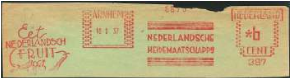
Afb. 9: De voormalige Nederlandse Heidemaatschappij deed ook aan vruchtbonenteelt

De binnenlandse consumptie moet worden bevorderd (afb. 9 en 10).