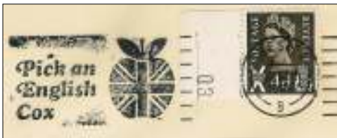
Afb. 10: De Cox Orange Pippin is omstreeks 1825 door een Engelse kweker ontwikkeld.

De handel wordt gestroomlijnd mede door het verschijnen van de supermarkten. In de marketing wordt ook steeds meer de nadruk gelegd op het gezonde van fruit (afb. 11 a en b).