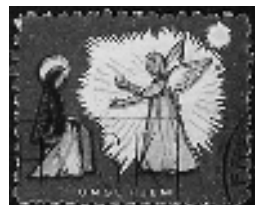
Afb. 10: Sociaal