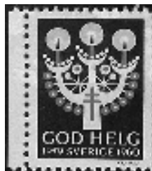
Afb. 3: Jule-zegels van Scandinavische landen

De in Nederland uitgegeven TBC-zegels zijn enigszins met de Jule-zegels te vergelijken, maar dan veel geringer in omvang, gebruik en bekendheid.