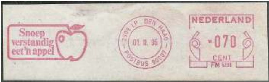
Afb. 11 b: Vanzelfsprekend maakt de commercie ook gebruik van dit feit...

Natuurlijk is er een onderscheid tussen het eten van vers fruit en het nuttigen van fruitproducten, deze laatste in allerlei vormen (afb. 12 a en b).