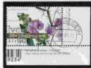
Een blad uit het album Nederland gestempeld