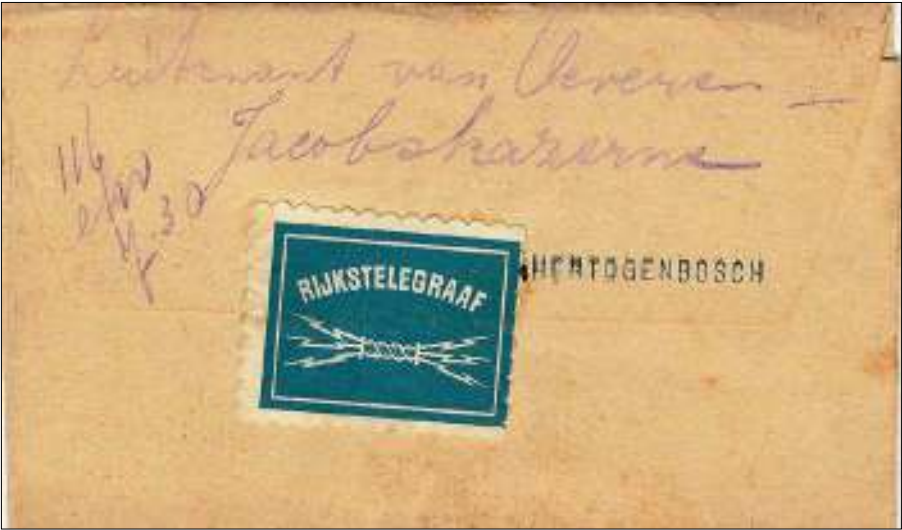
Afb. 6 Buitenzijde van een telegramformulier in 1919 verzonden van Eindhoven naar 's-Hertogenbosch.