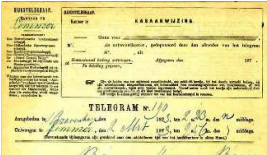
Afb. 2 Bovenste helft van een telegramformulier van de Rijkstelegraaf verzonden van Den Haag naar Lemmer in 1873.