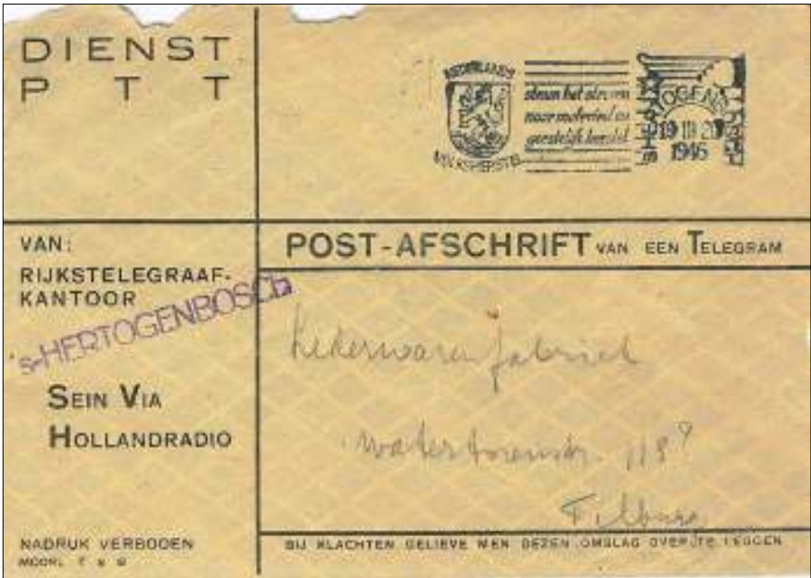
Afb. 7 Dienstenvelop van het Rijkstelegraafkantoor 's-Hertogenbosch waarin in 1946 een post-afschrift van een telegram werd verstuurd naar Tilburg.