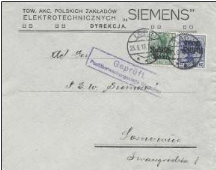
Afb. 5: Zakenbrief van de Siemens vestiging in Dyrekcja, via de post van Lodz op 23-9-'16 verzonden naar de nevenvestiging in Sosnowice. 25 Pf: tariefbrief > 20 gram. Met censuur van Warschau.

Er werd een diplomatieke oplossing gevonden in de herfst van 1915: het gebied werd voorlopig in twee generaal gouvernementen verdeeld. Het noorden kwam onder Duits beheer en kreeg de naam Generaal Gouvernement Warschau; het zuiden kwam onder Oostenrijks-Hongaars toezicht en kreeg de naam Generaal Gouvernement Lublin, met baron Diller als gouverneur. Vanaf 12 mei 1915 werden in de regio's Czenstochau, Lodz, Sosnowice, Warschau en Zawierce Duitse postkantoren opgericht in de regiohoofdsteden. Alleen deze werden bediend door de Duitse Dienst- en Reichspost. Hiervoor werden vijf waarden van de courante Germaniazegels (3, 5, 10, 20 en 40 Pf) voorzien van de opdruk Russisch-Polen (afb. 5 en 6).