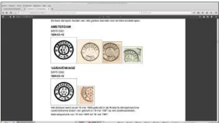
Afb. 2: Op deze schermafdrruk staan de twee grootrond proefstempels (1894). Zie Type Grootrondstempels Inleiding, map 01, pagina 4 'Proefstempels voor 'het toestel'', inclusief uitleg.