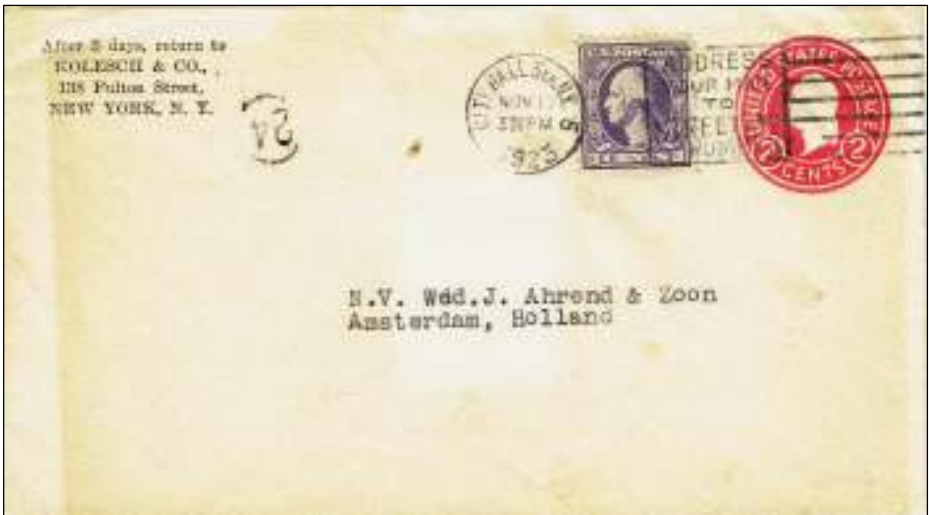
Afb.1: Poststuk New York-Amsterdam met busrechthouderstempel 'gebroken 24'. Zie Bestellerstempel, map 02, pagina 103 punt 2. Met uitleg op de pagina's 102 t/m 104 'Correspondentie voor busrechthouders Amsterdam', vanaf 1900-02-00. Er is nog geen stempelvoorbeeld en scan geplaatst. Busrechthouder, voorloper en begin van de postbus.