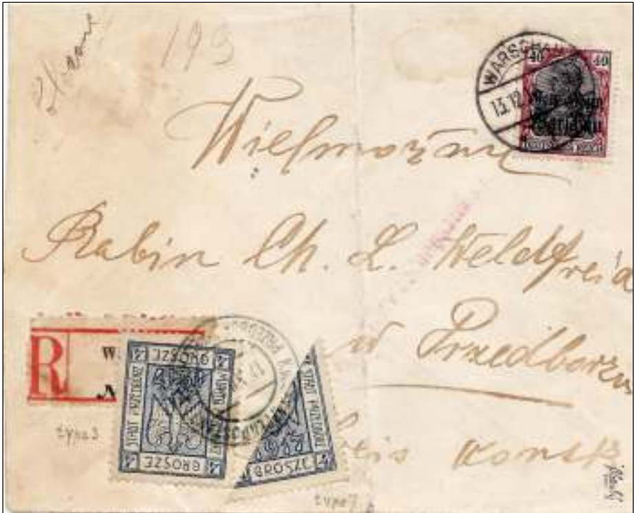
Afb. 7: Aangetekende brief van Warschau, 13-12-'17, na het passeren van de Postüberwachungs-stelle via het KuK Etappen Postamt van Predborz besteld op 18.XII. Aanvullend port van 6 Groszy, met een zegel van 4 Groszy van de lokale stadspost en, vanwege de tijdelijke schaarste aan lagere zegelwaarden op dat moment, een halvering van een zegel met dezelfde nominale waarde.

intreding in de oorlog 14 eisen die zij met hun deelname aan de oorlog wensten te realiseren. De 13 e eis stipuleerde de noodzaak van de vorming van een onafhankelijke Poolse staat, die alle gebieden met een Poolse bevolking en met een uitweg naar zee zou omvatten. En aldus is geschied.